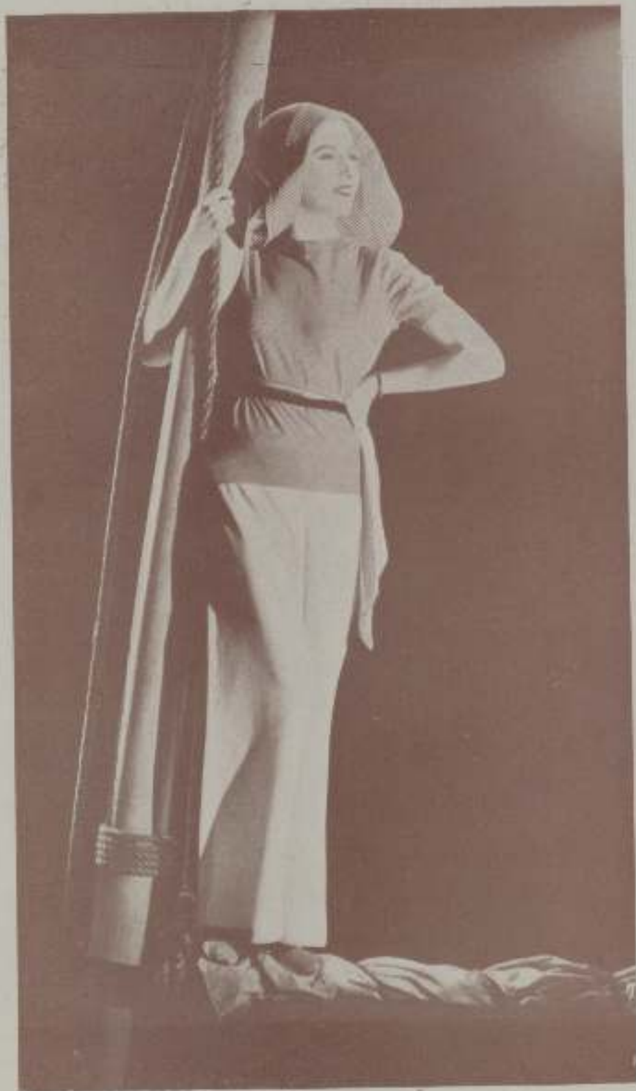
LILYAN TASHMAN de la Paramount