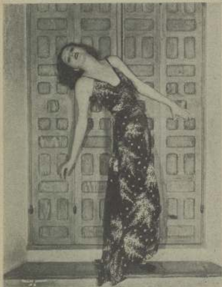
BILLIE DOVE, en esta escena de "La edad para amar", de Artistas Asociados está más bella que nunca, aun que ella niega su hermosura.

Ninguna mujer inteligente o que sienta aprecio por sí misma debe permitir que la marquen con el sello de que es hermosa! Al principio no niego que halaga y gusta, pero después llega a uno con una cantidad de responsabilidades imposibles de llevar sobre los hombros, ya que el peso es demasiado para una sola mujer. El ser conceptuada "hermosa" estropea todas las ocasiones y oportunidades de ser — tú misma — Es cierto que no deja cicatriz en el cuerpo, pero sí hue hondamente en el alma de una persona sensitiva y le resta no pocas ocasiones de ser verdaderamente feliz.