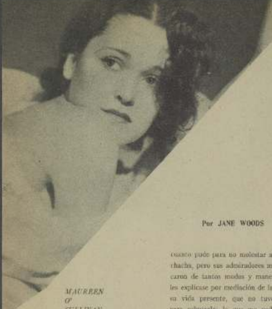
MAUREEN O' SULLIVAN