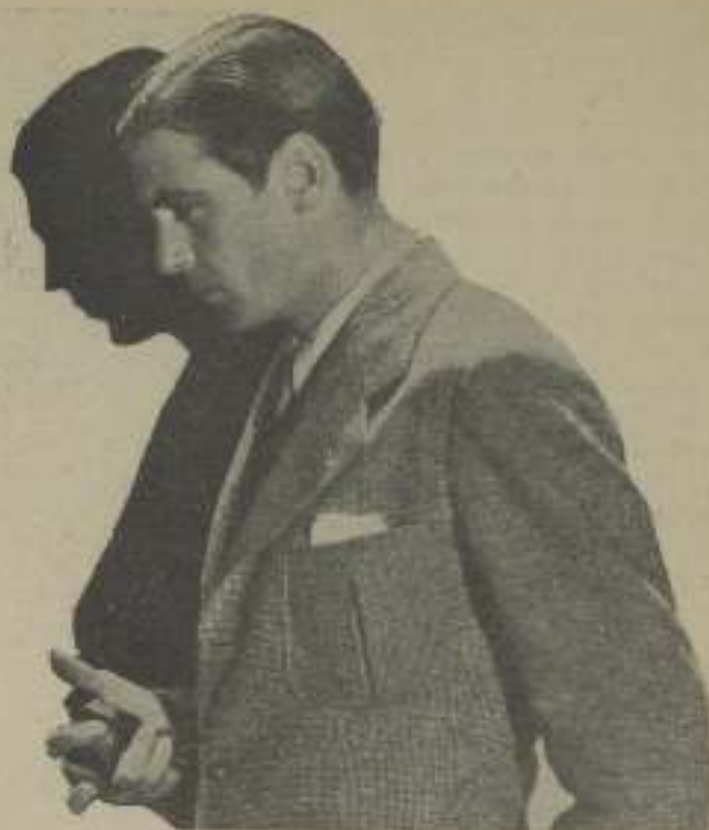
El nuevo ídolo de las multitudes femeninas en uno de sus características expresiones

"Muchos de ellos llevaban algo de ropa puesta, pero los que habitan en la parte profunda de la selva, no llevan absolutamente nada puesto. La mayor parte eran sumamente bien formados y no parecían darse cuenta en lo absoluto de su desnudez. Unos cuantos hacían la concesión de llevar un cinturón de cuentas y piedras alrededor de la cintura, pero se me informó que la hi-