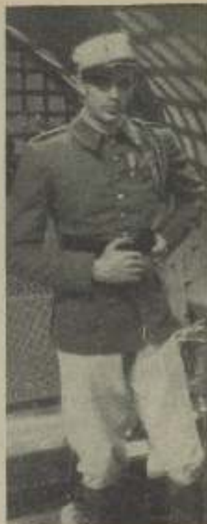
GARY COOPER, vistiendo el traje de la legión en "Marruecos"

"¿Es que quieres decirme que no eres de naturaleza fiel, que no perteneces al tipo de hombre a quienes solo le importa e interesa una sola mujer?" Casi no podía creer a mis oídos. Con sus palabras, Gary había echado por tierra una de las más caras ilusiones que me había inspirado su persona. Porque he de admitir que yo estaba completamente convencida de que Gary era uno de esos muchachos fuertes y silenciosos que solo aman a una mujer a la vez. Y él mismo deshacía mi ilusión con sus palabras: