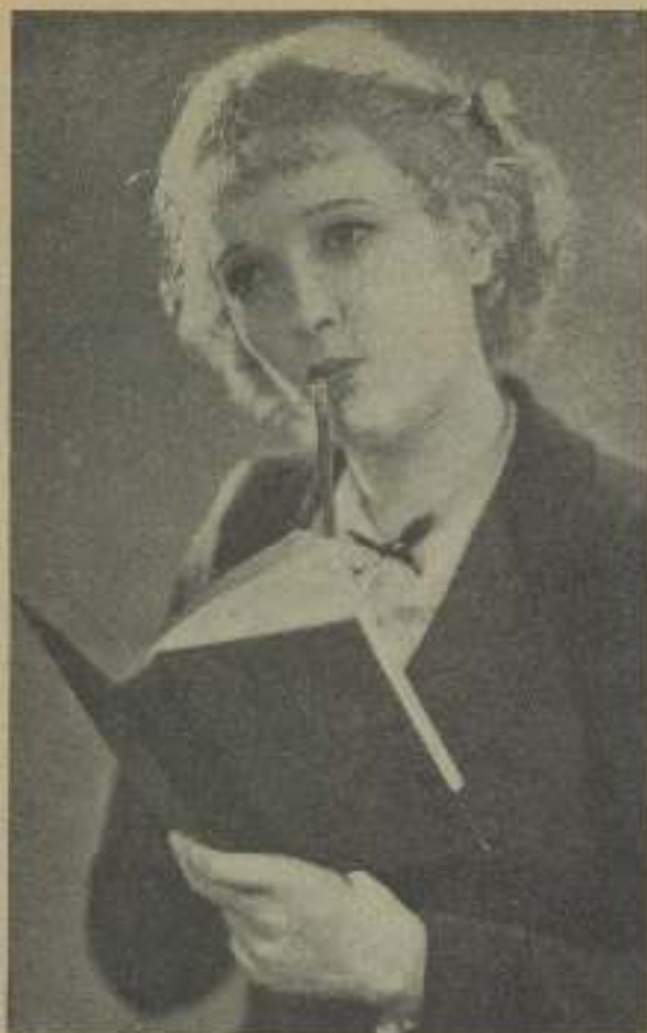
MARION NIXON, no parece casadita sino una colegiala