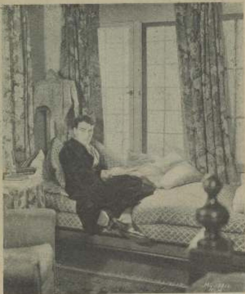
NILS ASTHER, por las tardes, en la época de descanso, leyendo en el "Living Room" de su casa en la calle Mulholland, uno de los lugares más altos en las montañas de Hollywood

o: feliz cuando puede pasar libremente por la mañana sin más compañía que su pipa.