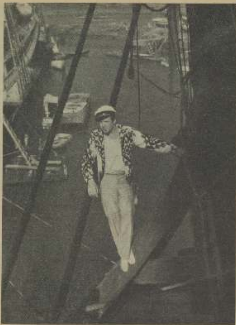
CHARLES BICKFORD, en "Sea Bat" film en el que pone de relieve sus aficiones marítimas

traordinario y se desvive por la pesca y los viajes marítimos en general.