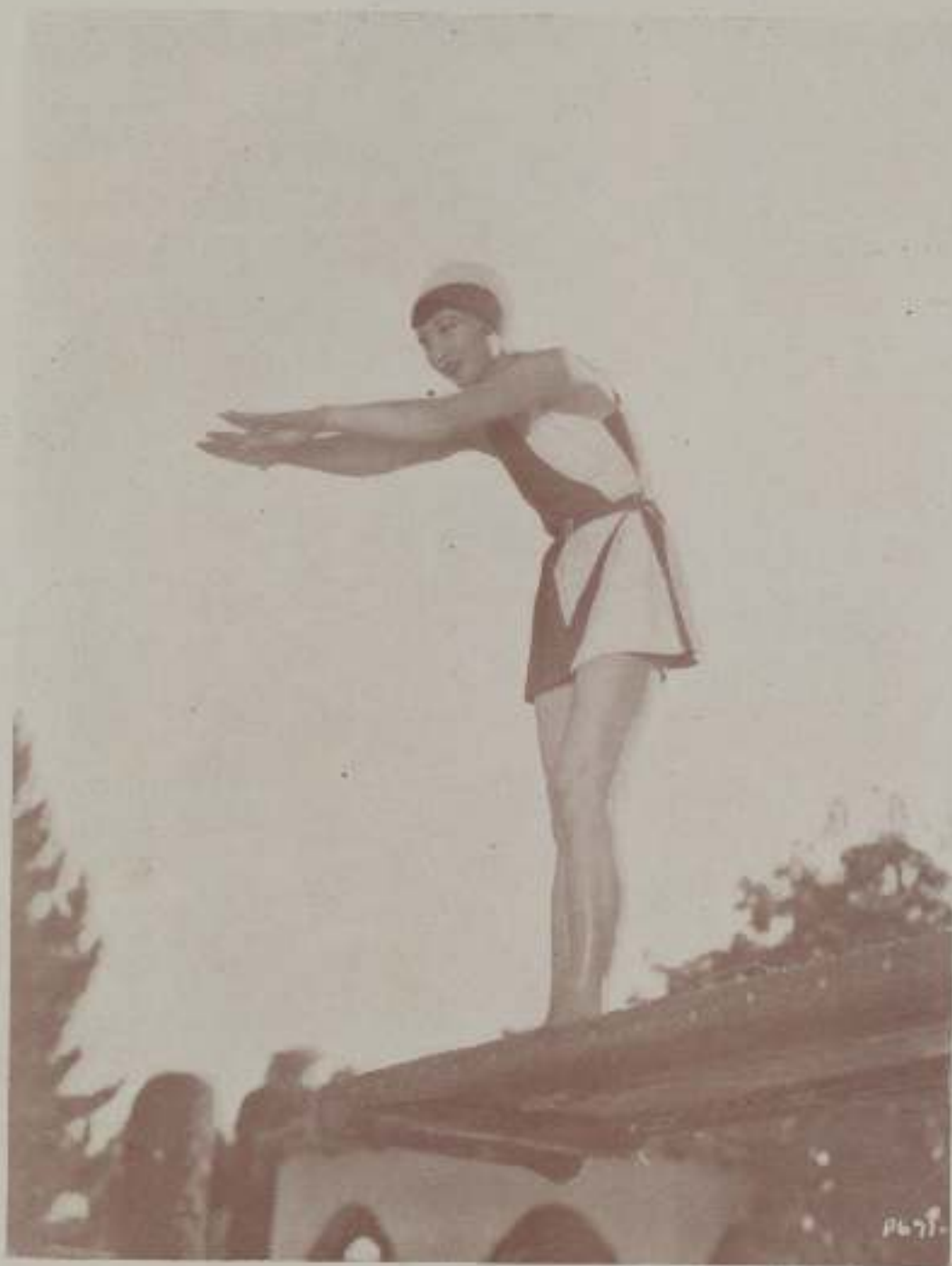
ANNA MAY WONG de la Paramount