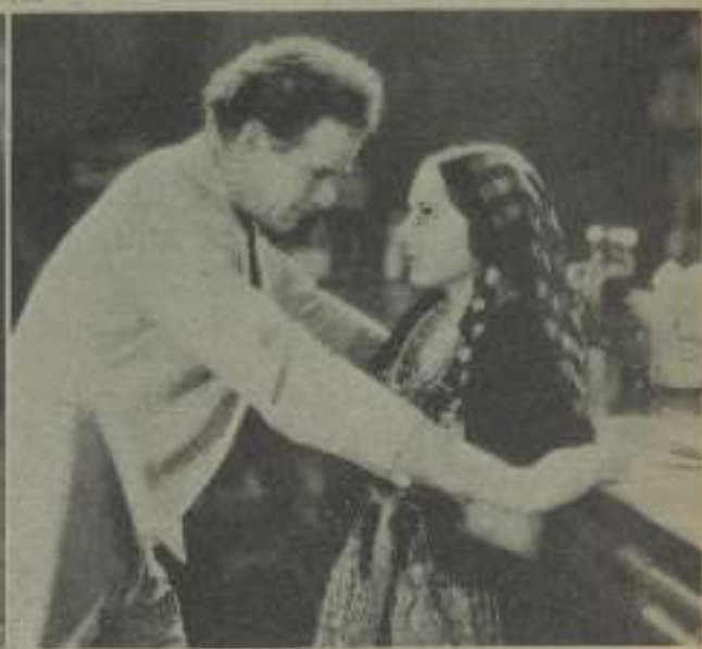
CHARLES BICKFORD en una escena con LUPE VÉLEZ de "El Impostor" y WARNER BAXTER y ELEANOR BOARDMAN, en otras del mismo film

dado tiene en su haber el jardín más bonito del sur de California. Violetas, rosas, claveles, lirios, lilas, dalias y toda clase de variedad de flores y plantas. Algunas de sus producciones botánicas han obtenido premios de consideración en las exposiciones californianas pero Charlie se niega a ser retratado con sus plantas.