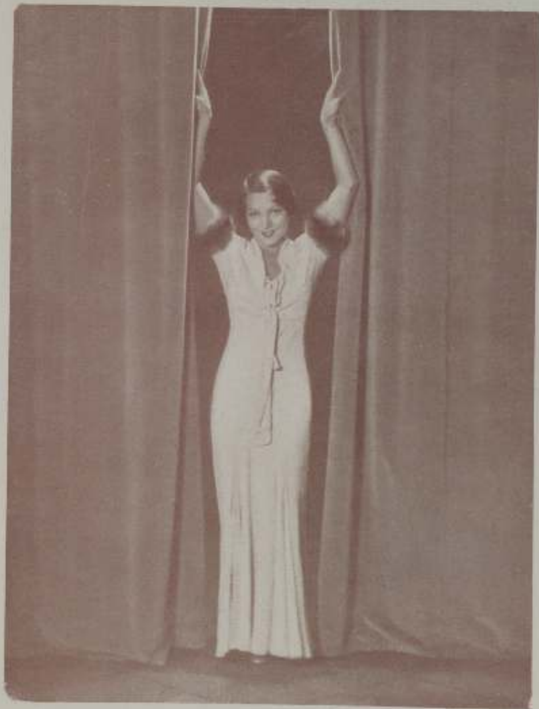
KATHE VON NAGY de la Ufa