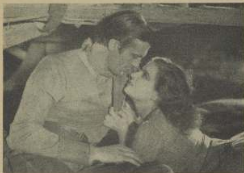
GARY COOPER y LILY DAMITA en una escena de "Caravanas delicias" de la Paramount

ser el cuerpo y el espíritu de cualquier persona, hombre o mujer, por muy fuerte o ambicioso que sea. A mí al menos me dejó completamente extenuado. Será tal vez porque nunca he sido demasiado fuerte."