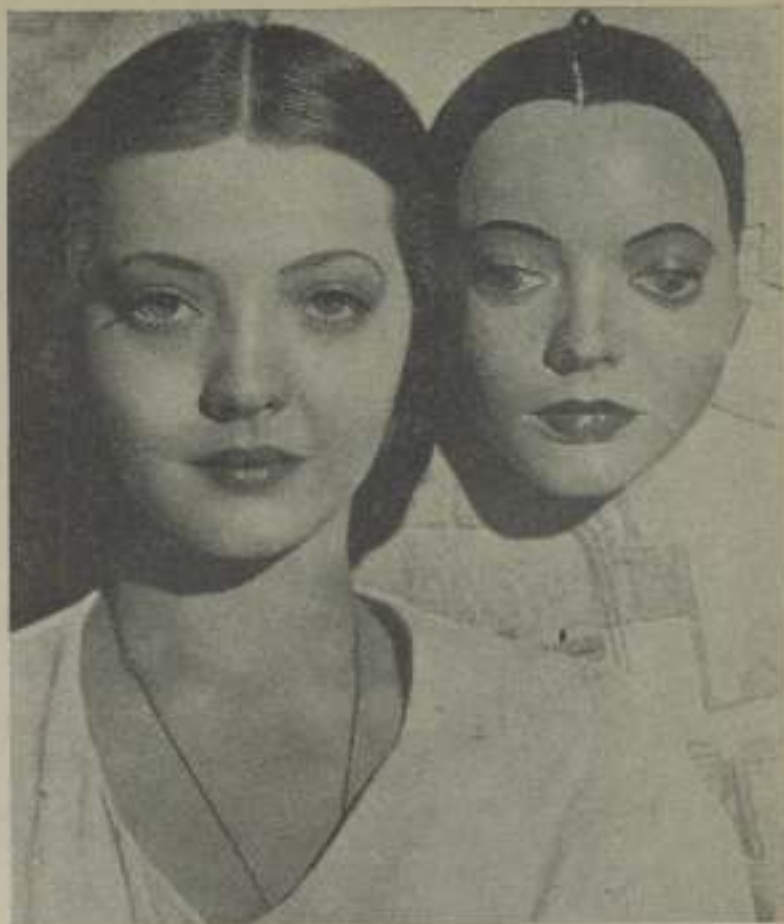
Original y copia: SYLVIA SIDNEY en persona y según la máscara sacada por el actor Richard Cromwell

cayó al suelo, gracias a las tijeras de Wally Wetmore, el famoso e insensiblemente experto de maquillaje de Paramount. La madre de la muchacha estaba inconsolable y cuando algunas de sus amigas le dijeron bromeando que el hecho de que Sylvia se cortara el cabello podía considerarse "una tragedia personal", la buena mujer por poco se pone a llorar. Tal era el desconuelo que le causó el ver la hermosa cabellera de su hija reducida a casi nada. Pero una vez terminada la obra, las cosas cambiaron de aspecto por completo. Sylvia se miró en el espejo; todo el mundo miró a Sylvia y todos unánimemente se pusieron de acuerdo en pronunciar veredicto favorable al cambio experimentado en la muchacha.