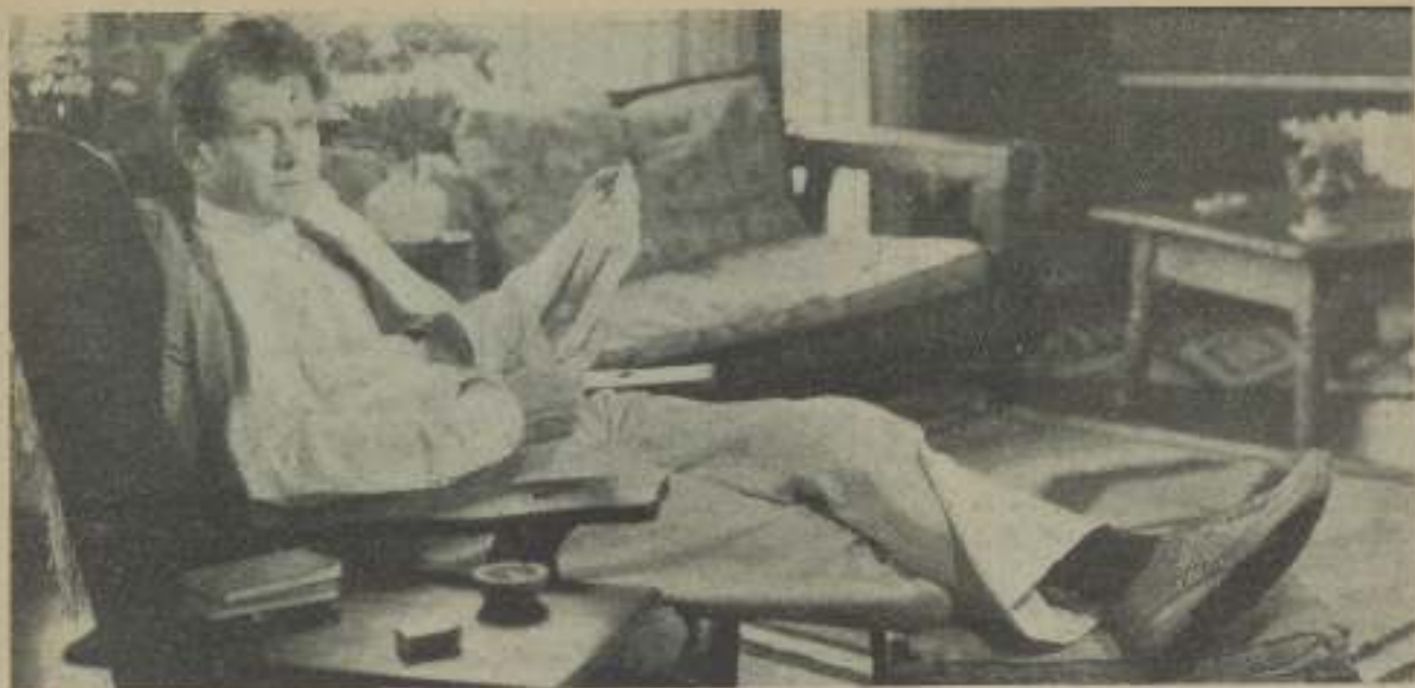
CHARLES BICKFORD en absoluto: esposo en el solá de su casa de Playa del Rey, en California