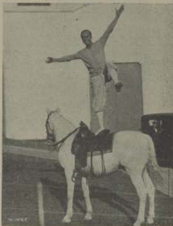
DOUGLAS FAIRBANKS en una escena de "El Luchador" cuando aún sus músculos vigorosos obedecían su voluntad

¿Recordáis aquellos saltos prodigiosos, aquel escalar rífidios de sus buenos tiempos? Douglas nos daba la sensación de hombre imantable, de superhombre físico que había conseguido encontrar la fórmula eficaz para dar a los músculos la flexibilidad del mejor templado acero y aunque aun es joven, aunque dedica su preferencia a la conservación de los músculos, ha dejado de ser el atleta imantable para convertirse en el hombre fuerte, vigoroso todavía, pero sin efectividad ya para