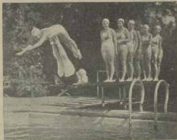
Las alegres chicas de M. G. M. se divierten cuando pueden

Y su más extraña peculiaridad, la que la hace diferente de la mayoría de las mujeres es... que es una mujer que nunca ha sentido ni conocido lo que es el amor. Tratándose de la Garbo esta es el misterio más profundo.