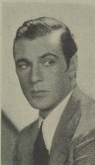
GARY COOPER, momento en un tiempo de una muchacha de Iowa y hoy ardiente enamorado de Lupe Vélez