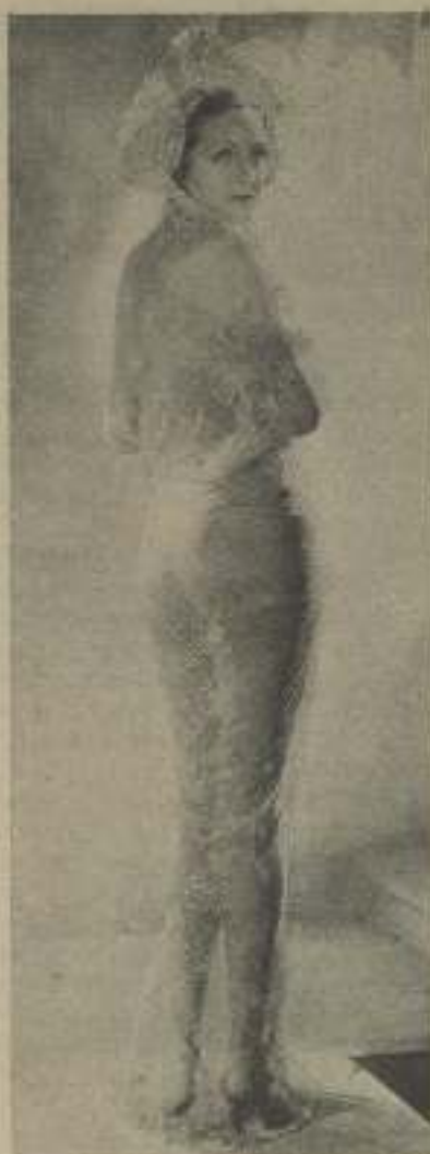
ELEANOR HUNT cubierta de preciosos velo no tanto como su divino cuerpo

"Italia me intoxica — añade Mary, — la música, las flores, es todo un intenso perfume. La naturaleza se pone en traje de fiestas; y hay una sensación personal, como si todo fuese para uno. Los gitanos me seguían por todas partes, yo vaciaba mi bolso; de si comía o no, casi no me daba cuenta, tres de ellos trabajaban en nuestra película, me enseñaron sencillamente con ellos, y me enseñaron a silbar, rasguear la guitarra y a cantar viejas canciones napolitanas, ellas me imitaban, — y sus palabras susurraban sentimientos a través de su voz. — Verdad-