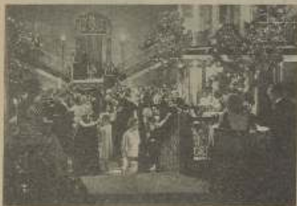
Una escena de la grandiosa hispanoparlante Fox: "Mamá" que dirigió Benito Perojo

§ Tom Douglas se ha declarado en quiebra. Ha manifestado debe 1.170 dólares a proveedores americanos y 17.500 a los ingleses; ya que se fue de la Gran Bretaña lleno de deudas. Como activo señala 800