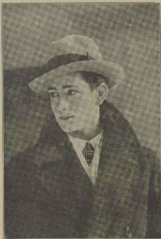
ENRIQUE GUITART, cuya actuación en la película "Luzes del Sr. Esteve" puso de manifiesto las posibilidades que como artista cinematográfico, concurren en el joven galán

—No. No fumo. Hay que conservar la voz. Tampoco bebo licor de ninguna clase. El actor dramático debe cuidar su garganta tanto o más que un cantante, puesto que la somete a una labor más intensa y fatigosa que aquél. A propósito de mi poca alición al tabaco recuerdo las extraordinarias fatigas que antes de acostumbrarme a fumar en escena, cosa que ya he conseguido, me proporcionaba tener que adaptar aires de fumador en las tablas, y en cierta ocasión logré un grande éxito cómico por lo que el público creía un detalle