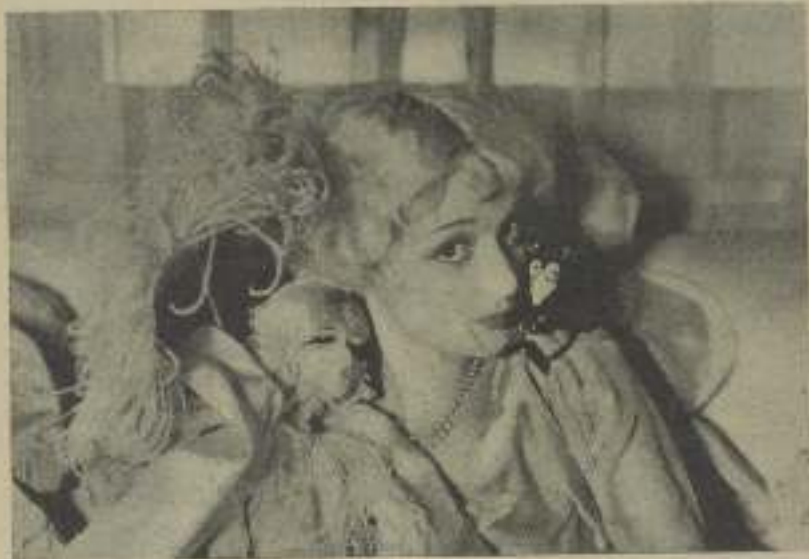
Entre sedas, trapos y muñecas, pasa la agitada vida MARY NOLAN, protagonista del film Universal "Fuera de la Ley"

Su vida ha sido anecdótica, sus escenas muestran una niña vestida con un delantal en una granja en Kentucky, jugando por entre las haces de paja; una pequeñuela huérfana, miserablemente desdénada por los otros niños en el convento donde estaba por caridad, trabajando por su comida. A los nueve años, con un hermano y un primo, se metieron en un tren hasta el límite del horizonte, una ciudad a veinte y cinco millas de distancia. ¿A dónde iba, y por qué? Se marchaba porque algo la obligaba. Ella no podía aprender las lecciones y obedecer la regularidad de las campanadas, cuando la volvieran a mandar; regresó desafiadora, con una turbulencia latente. A los cinco años empujó sus faldas por veinticinco céntimos, para comprar buñuelos. Sólo una chiquela hambrienta llena de impulsos resacañados haría tal. Sus parientes le hicieron imposible la vida en Nueva York y, si ella hubiese guardado sus