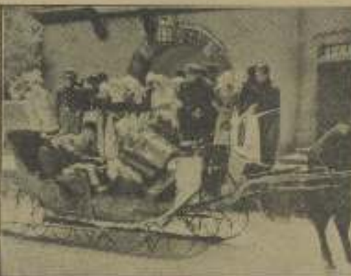
Una bella escena de "El molino de los duendes" que nos quita el miedo a ellas fijándonos en ellas

Cuando tal cosa me dijo, se me solivizó el ánimo. Figuréme que yo apenas