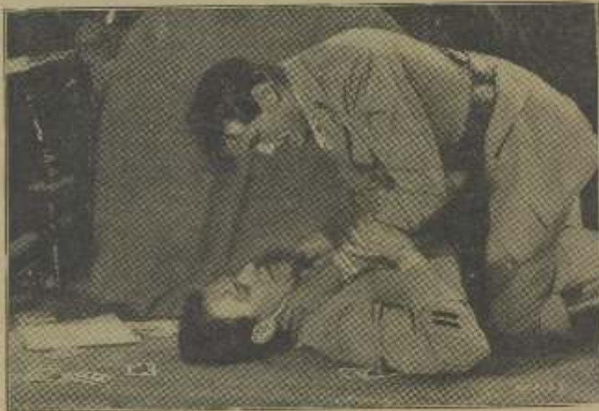
Patética escena de la "Legión de los condenados", la primera película en que se reveló el alma artista de Gary Cooper, descubriéndole el camino de la gloria.