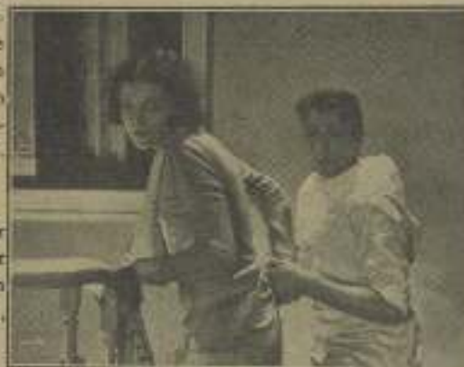
En «Detectives» se pasa un buen rato aplaudiendo las audacias, riesgos y astucias de que está llena esta película