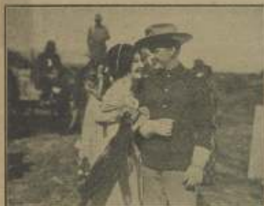
El amor no tiene terreno vedado ni tiempo limitado, pues suyo es el mundo y reina hasta en la lucha de "Blancos contra indios" como demuestra esta escena deliciosamente