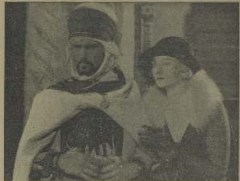
Un pasaje de "El jardín de Allah" que debe ser muy hermoso y agradable conteniendo flores tan bellas como la de vista su protagonista dulcemente atractiva, suave y delicada como la luna, riendo en el pensamiento de su hero Abderamán

Ricardo Cortez, es sin duda uno de los maridos mejores con que cuenta la colonia. Recientemente la M. G. M. ofreció a Ricardo el papel principal de "Trade Horn", pero como el aceptar ese papel obligaba a Ricardo a ausentarse durante ocho meses, no lo aceptó por creer que su deber era estar al lado de su esposa