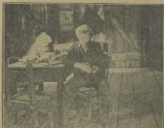
Una escena de "El viento" que parece tiene preocupado hondamente a su protagonista