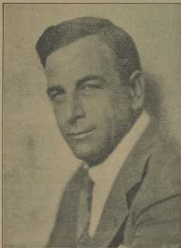
MILTON SILLS Protagonista de "Hombres de acero"

Pero fíjate en el momento en que en su vida se ha cruzado un objetivo. Entonces vibra, siente y de cachazado conviértese en nervioso y quiere trabajar y trabajar porque ya no es solo, porque ya la