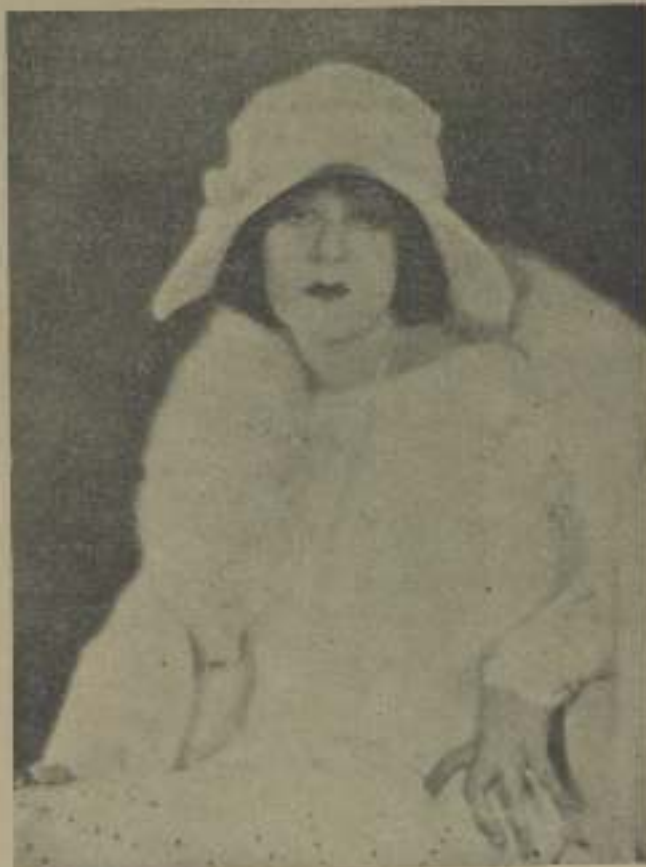
Una bella artista cuyo nombre, sin duda, lector, has repetido con frecuencia. ¡A ver si aclaras!

imperó, en los galanes cinematográficos, la temporada 1928. Todos, o casi todos, se depilaron las cejas y se tostaban al sol. Estaban monísimos, impermeables. Daba gusto verlos por la calle de Alcalá, embutidos en fumantes ternos, cortados a lo trévido... Si a alguien se le ocurre introducirlos en un frasco de cristal, obtiene una cantidad de lodo asombrosa. ¡Artistas de cine y con la faz abetunada, ¿Has visto mayor desatino?