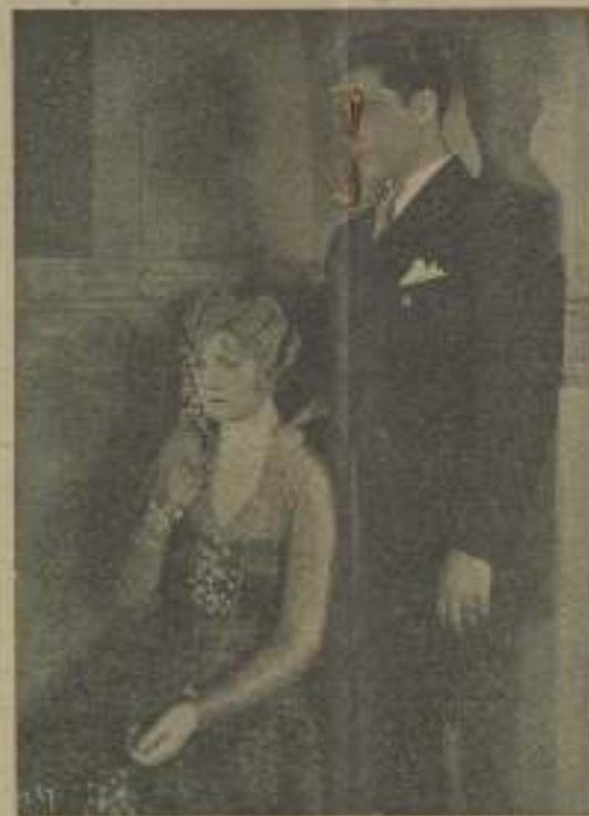
Una pareja de "Amantes" jóvenes que más parecen serlo de sí mismo cada uno, y habrá que decirles ¡qué guapos! para que no se muevan y el fotógrafo pueda enfocarlos bien