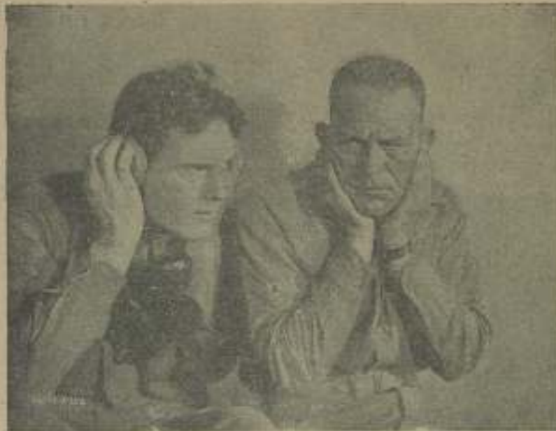
¡Hum! La cosa está grave... El volcán trepida en sus entrañas y borbuja en el cráter, pero afortunadamente estamos lejos, querido viejo, parece decir William Haines a Lon Chaney

Milton Sills, a causa de su enfermedad nerviosa que le obliga a permanecer todavía en el campo, ha perdido su contrato con la First National. No obstante creese que será renovado tan pronto como esté restablecido.