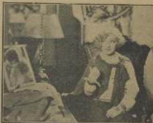
"El novio postizo", y cómo se rie a solas ella de él, pero no está mal de reserva...