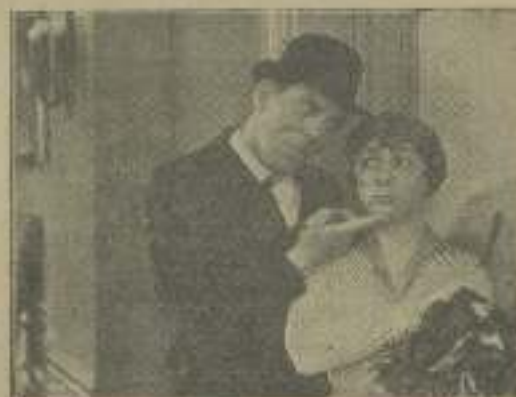
Chistosa situación de un muchacho disfrutando de muchacha en "Detectives"