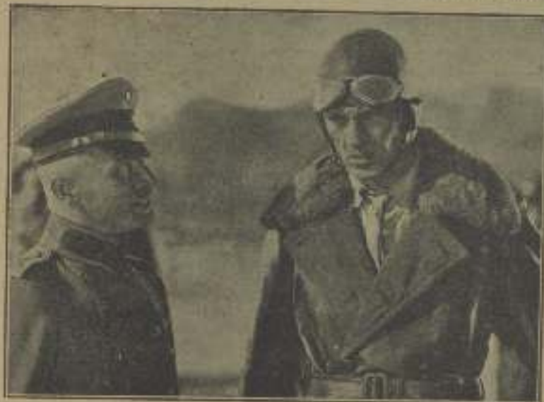
"Alas", película en la que empezó a volar hacia el estrellato la rápida y sólida fama artística de Gary Cooper

Gary vuelve a callar y a sonreír; pero esta vez su sonrisa es triste, porque recuerda su tierra, los campos que tantas veces había corrido y que fueron el primer escenario de sus heroicas epopeyas.