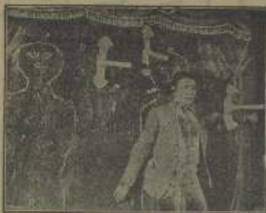
El gran cómico George K. Arthur en un graciosísimo entre Scila y Caribdis de "Gente de circo" huyendo de una mala sombra para caer en brazos de otra