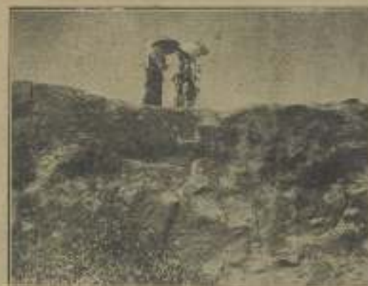
Recibiendo y transmitiendo confidencias del enemigo en "Blancos contra indios", película de bellos paisajes y de trágicos odios humanos