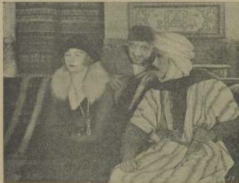
He ahí una fulminante escena, a pesar de ocurrir en "El jardín de Allah", que pone de manifiesto que una cosa es ver y otra mirar, como diferentes son el fuego y el hielo

Strongheart, el perro policía actor de la pantalla, ha muerto a la