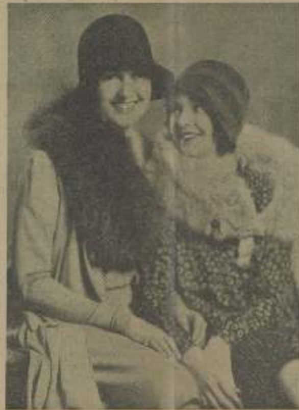
¡Dos amigas! Sí, muy buenas amigas, inseparables y de buena cepa, como que son Janet Gaynor, y... su madre ¡Verdad, lector, que habría para dudar en la decisión a decidirse por el esposo!