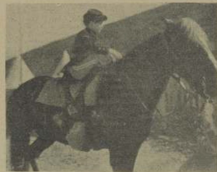
Napoleón no se veía tan grande cuando mandaba legiones de hombres a la muerte, como Jackie Coogan "El pequeño cornetín" con su uniforme y su caballo