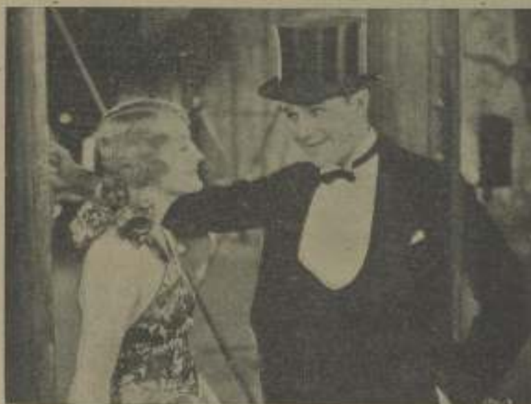
Das sonrisas píctóricas de ambrosía de ilusión, son hermanas de amor que fuera difícil concretar cuál de ellas, si la de la bella Josephine Dunn o la del apuesto W. Haines en "El renacimiento" alado de la otra

«Solamente esta vez, agregó, señalando el escenario de los estudios, la oportunidad se presentó en el orden natural. Mi contrato con la Paramount acababa de