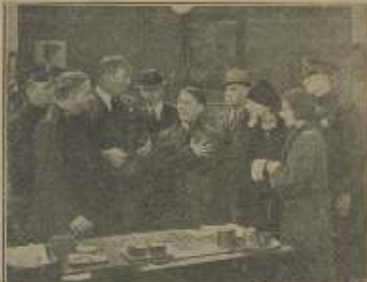
Explicando una singular captura en "Detectives"

¡¡Batiendo todos los records de la sensación!!