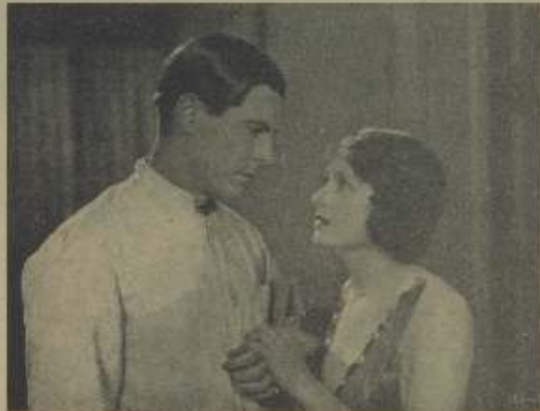
Contando un secreto a sólo un «quidras» de la noche