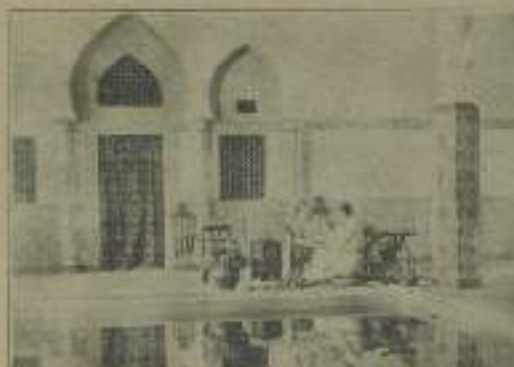
Placida escena de "Historia política" que reproduce el agua parlamentaria