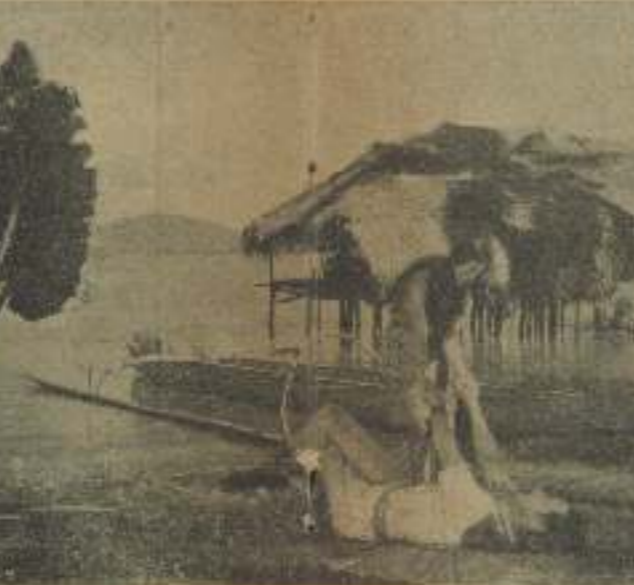
Interesante pareja de amor en una foto tomada en "Amor blanco", habiendo quitado apuestas que ganó "ella" y otros que vencerá "él"

El doctor Green, acusado de proporcionar morfina y otras drogas nocivas a Alvin Karpis, acaba de ser absuelto.