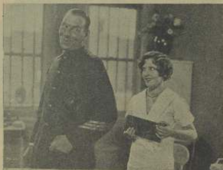
—¡Qué bien te sienta, hermano, el uniforme y las galones! —Andate, pues, con cuidado con faltarme al respeto porque sino... (Deliciosa escena de un amor fraternal)

gocia con personas de sus mismas ideas. Gusta de sus transacciones comerciales, como de hacer películas. Pero respecto al dinero, llebo no tiene que preocuparse, aunque no hiciera ningún otro film en su vida; más, no es ella sólo, también han de saber cosas que Jean Hersholt se ocupa de, algo hernoso y productivo. Libros. Primeras ediciones de toda muestra sale de