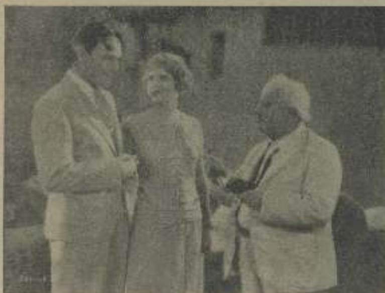
De esta escena de "El fatal" la que más atrae, indudablemente, es la fuerte mirada y la dulce sonrisa invitadora de la bella y simpática protagonista

sentir y del pensar de la humanidad, en las grandes urbes y en las varáguas de las metrópolis universales... La ciudad, en la pluralidad de todos los ambientes, ha impresionado la sensibilidad, fácilmente excitable, de la juventud, sancionada al esteticismo y simplicidad del ambiente provincial.