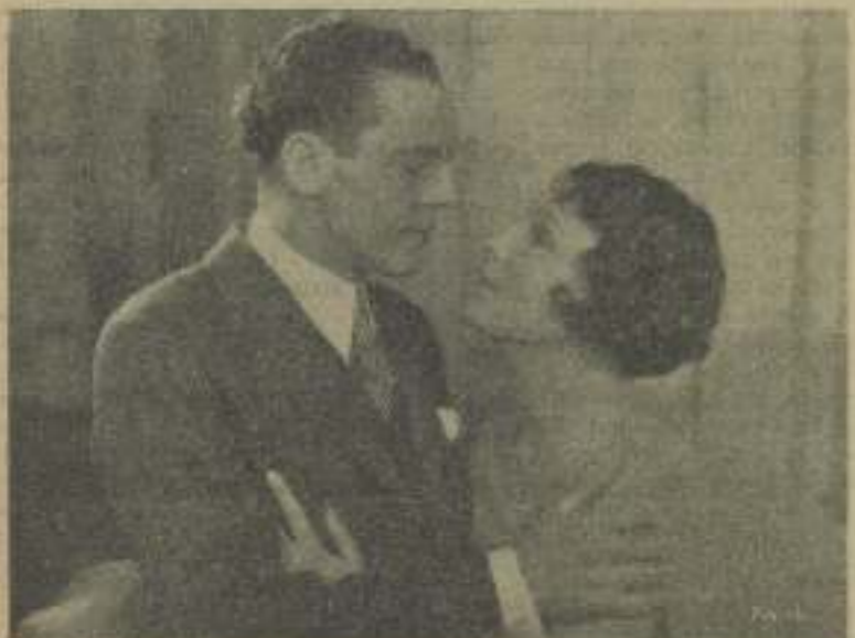
En una interesante pareja que a buen seguro se juran amor eterno (con derecho al divorcio) en "The Helmsley Trial"