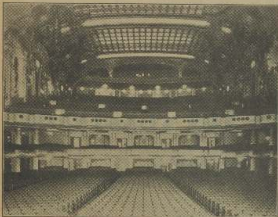
Plata y palcos del magnífico Teatro Paramount en Brooklyn vistas desde el escenario