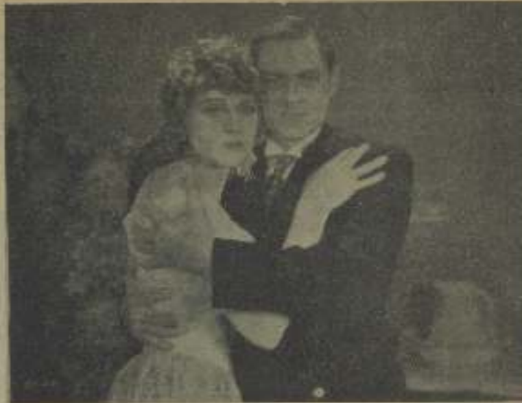
Los amantes se casaron que viven en un momento "Más allá de Zanzibar", acordando la pareja queridos

nuevo cinematógrafo que se han girado en San Francisco, con su nombre. Este es el primer cine "estrella" que así lleva el nombre de una "estrella".