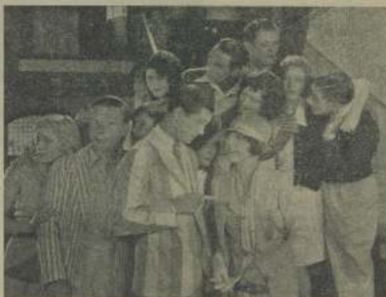
Un momento a voces del que todos se enteran en "El asturiano"

es un film notable. Greta Garbo, triunfa en él una vez más. Es la orgánica fría y sin perfume que con ayuda del amor se vuelve salvaje. En pocas palabras, es la historia de una mujer casada con un hombre más viejo que ella dedicado por completo a sus negocios, que se echa en los brazos de un joven príncipe imbecil. La mujer resiste en un principio, pero se deja arrastrar al fin hasta que se entrega al marido y en una partida de caza, hace del príncipe la presa de un tigre. Este film es sonoro, no parlante. Es el último silencioso de Greta Garbo, la cual hablará en los sucesivos aunque guardando su acento sueco.