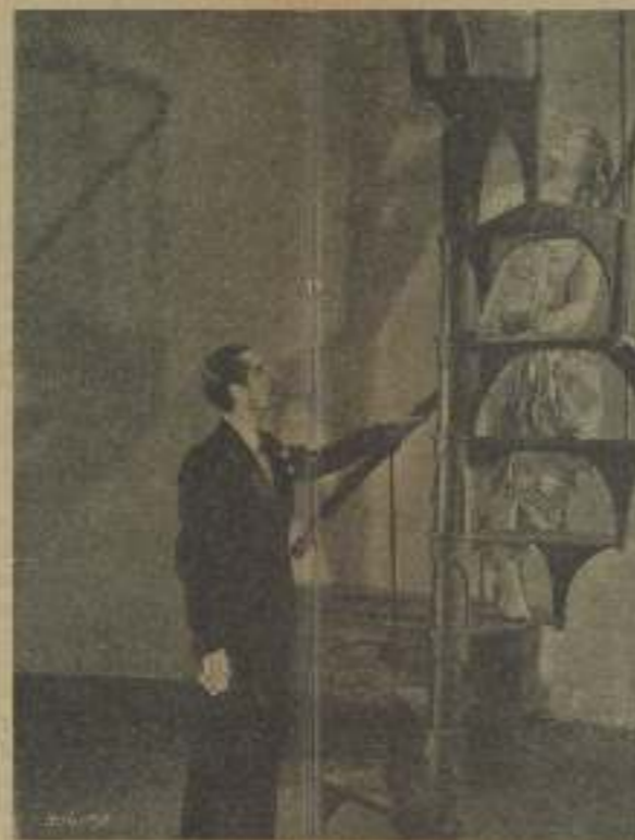
Una cascabelo indisciplinada y sus machucos ocasionados en "La máscara del diablo"