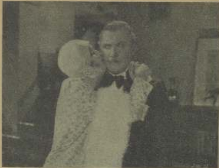
En "El cruce", el vestido está delicada acomodada, demostrando que su encanto es más honesto que Jordan

Las batallas más encarnizadas libradas en el frente francés durante la guerra europea fueron encarnizadas de niños al lado de la que libró Luisa Dresser, la famosa artista del cine, ayudada por su marido en la esposa de Crise, un ángel de fama de Los Angeles contra un viejo gato moribundo que apareció en el jardín de su casa. Luisa Dresser tiene un perro de la edad que quiere y cuida como su joya más preciosa. Como con muy natural Luisa juguetea en el jardín de su casa con el perro al calor de los rayos solares, pero cuando en esto llegó el moribundo gato moribundo con intención de morderse al "pel" de Luisa. En un abrir y cerrar de ojos, el gato se convirtió en un animal del cuchillo de Luisa y principió la batalla. De ninguna de las maneras dio Luisa a abandonar su "pel" en las garras del fiero animal y tomó parte activa en la refriega. Logró pronto coger en sus brazos al cachorro, pero entonces el gato arremetió contra Luisa que principió a luchar con sus pú-