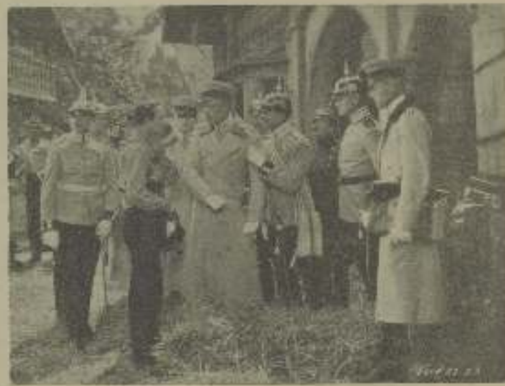
Una escena de "Los cuatro Hijos" que entristece