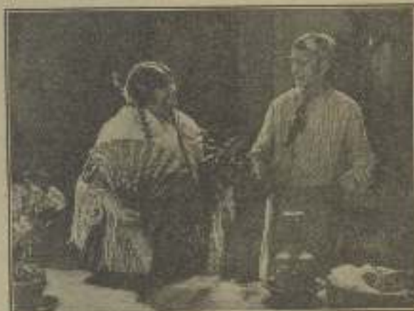
Una de frío y otra de caliente a la bucaventura de una gitana y la suscripción de un dandi en "El León de Sierra Morena"

de la raza hispana, y por lo tanto, a no ser por el ligero acento andaluz que moldea sus palabras, creyéndole el mejor observador hijo de la propia Andalucía.