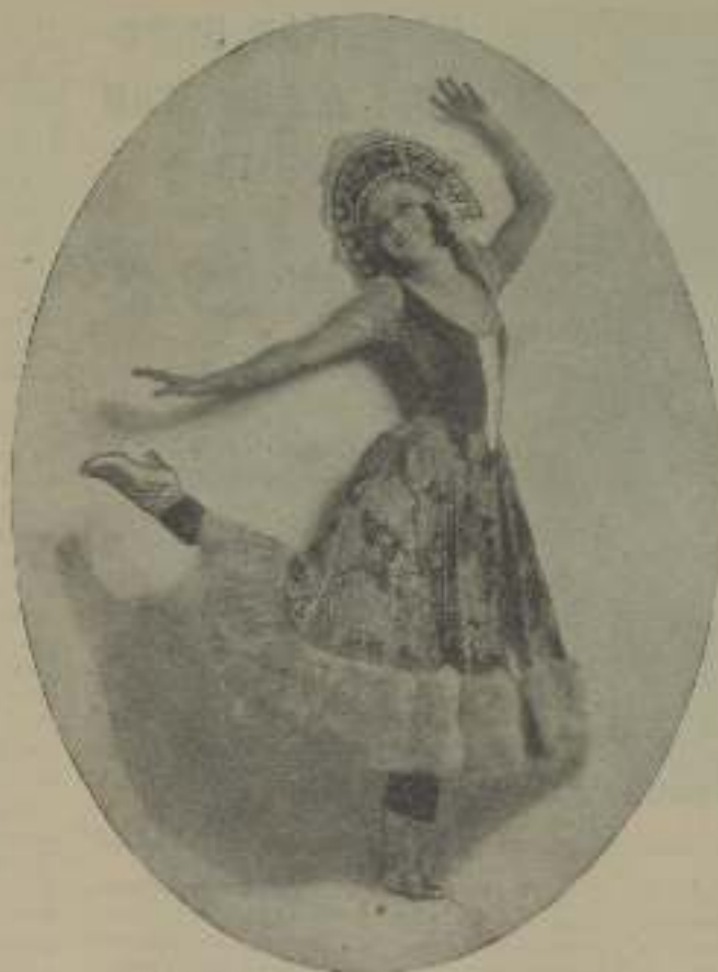
Acto. Hipocrita, danzadora y granista de Dama Dolores del Río a la gloria en la tierra.