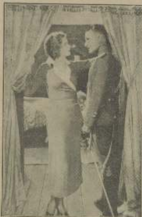
En un momento culminante de "Ara Karenina" es que Joan Gilbert se enfrenta pacíficamente con la bella "estrella" de su obra, la actriz Greta Garbo.

La fatalidad iba a separar a estos novios.