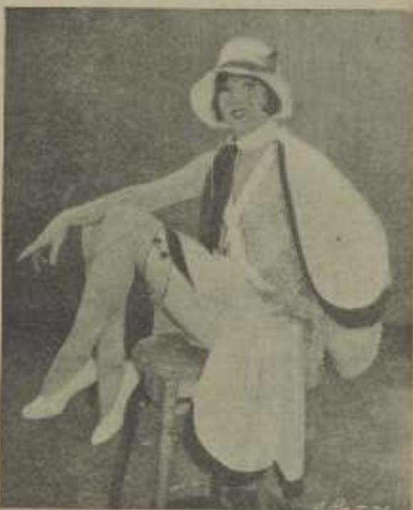
La peliada "estrella" Dolores del Río en un momento de descanso conversando con el ritmo de su caracterización en "Fuerza de vida".

Todas las semanas Peck está la distancia entre San Francisco Hollywood con su es-