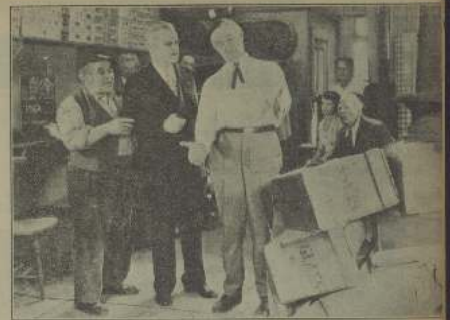
Una chispa sacra de "La mala pata" en que se advierte fácilmente que esta es dentro de una mujer que sostiene, tal vez, a Roubay en lugar de tentáculos para Barcelona.

de noviembre fueron a Tijuana (Méjico), numerosos artículos de Hollywood, con motivo de celebrar una partida de cartas, invitando a Carlos Myers.