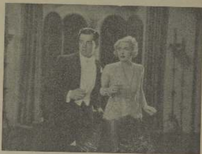
Un título de amor interrumpido en "Un cierto muchacho" por algún importante episodio de la dicha obra