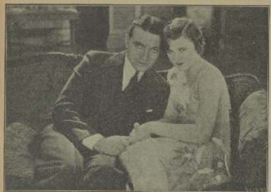
Richard Barthelmess en "La gran jornada" aventura en fealdad con su novia, para su novia tiene un pelo por rostro y un peinado en conjunto que entorpecería al mismo Adán el colérico.