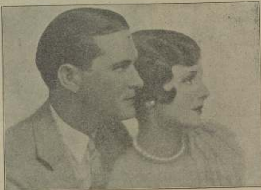
Al hacer su adaptación y por eso, sin duda, aparece esta simpática pareja en «Frontera del amor» los señores y... mecanógrafos

resto de España, y, menos aun, salir de ella. A menos que sea una obra genial.