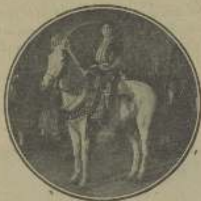
Melancolía andaluz en "El León de Sierra Morena"

Es mexicana, una de las naciones de la América latina en que viene mejor el cine