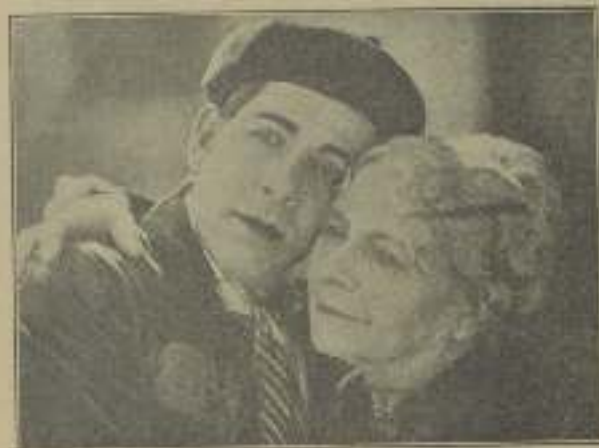
¡Oh, mi niño, no te pierdas!, amasaja esta buena madre en "El León de Sierra Morena"

—En Hollywood, a donde pronto regresaré en primavera próxima, he tomado parte en varias cintas. Allí he filmado "El Balcón de San León", en los Studios D. Mills, en la que Sally Rand y yo interpretamos los perso-