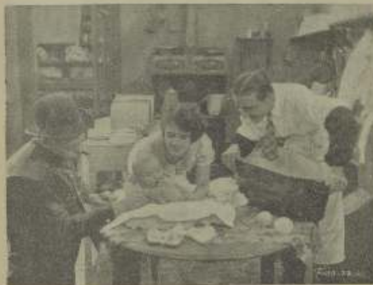
La paz y la alegría al momentáneo calor de la familia en "Los cuatro Hijos"