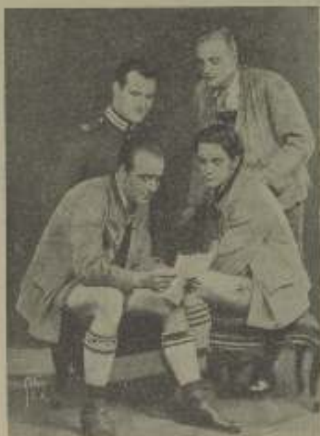
Una escena del «este espectáculo». Los cuatro hijos van a su querida madre que les bendice y abraza con el corazón!

cosa pudo hacer a un muchacho así? Después de pasar el «filme» los intérpretes fueron llamados al escenario. Después de Marguerit Mann, Jimmie fué el más con-