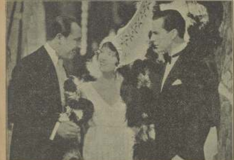
Job, la "impresora" cuando juega con el corazón del Anahíel... Ella se ha encendido los celos del que quiere expandiendo al divorcio en "La magia del baile".

Charles Farrell, está construyendo en el valle de San Fernando, muy cerca de Hollywood, una quinta estilo español,