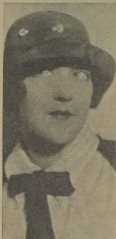
Bellos ojos claros, serenos, de cuando miran amable, son los que llevaban el nombre de Aileen Pringle.

« Hermosa mujer, estupefacta creación de Natura que dotó a tus ojos del ambiguo