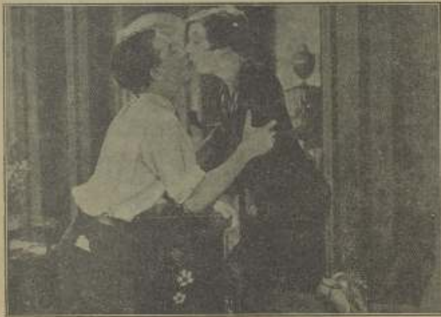
Anna Q. Nilsson y Jack Mulhall se han convencido de que después de un beso se puede decir que "Mio es el mundo".

de la cara ballada a golpes de bocha, el del americano entreciño, es, íntimamente un ser cordialísimo, tan agradable en su trato y tan bondadoso, que aquellos quienes lo conocen personalmente y lo tratan con amistad no seietan a explicarse—como nos sucedió á nosotros— como aquel ser, tan sencillo, tan bondadoso consigue un tal aspecto de irreductible firmeza de salvaje inasistibilidad cuando, dejando aparte su personalidad de simple ciudadano de los Estados Unidos pasa a convertirse—al enfrentarse a la cámara— en el artista dueño de la pantalla, en el cual cada interpretación es una muestra aparte de las anteriormente realizadas.