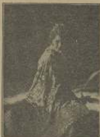
Pensando en su amado protagonista "El León de Sierra Morena"

—Efectivamente son muy lindas las escenas de las cinematográficas españolas que han de vencer dificultades grandísimas para dotar a España de la industria cinematográfica; pero vencerán ya lo verá usted. Tienen a su disposición el cielo y la tierra más bella del mundo, las más bellas mujeres, los ojos expresivos y facciones bellísimas, hombres primitivos del sexo. (¿Cómo no han de vencer?)