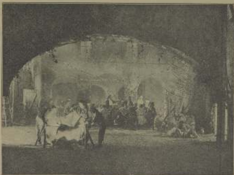
Gran escena piadosa que revive aquellos tiempos y aquellas costumbres de gentes como las de "El León de Sierra Morena"