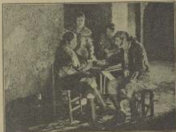
Una "cámbulo" del abate y el amor en pareja, sirven un trato que hace a poyure y distribuyéndose entre estas dos andanzas de la partida en "El León de Sierra Morena"

—Cuento en que será bien acogida. Los exteriores todos se han filmado