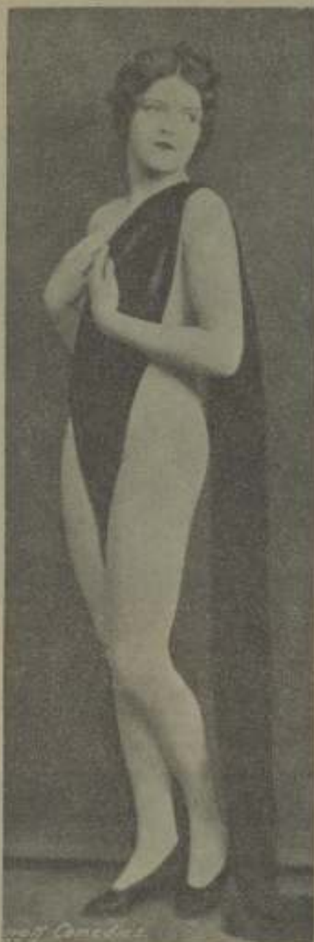
Una bella modernista del patíbulo hollywoodiano

una gran compañía en California, con muchos millones de dólares de capital, que por vez de vino a quien quiera tenerlo, sin llegar a infringir ninguna ley. ¿Cómo? La compañía entrega en las casas de sus clientes la cantidad de jugo de uva que le piden: