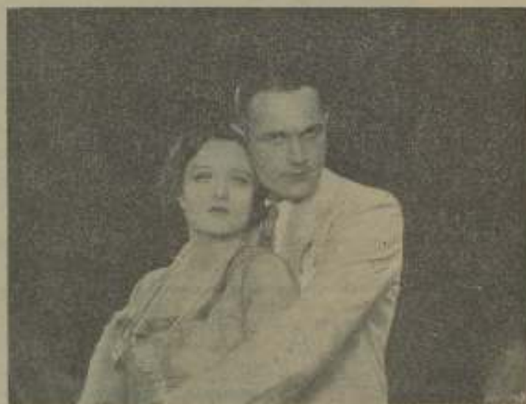
"Fiebre de primavera" de amor, es que los pensamientos florecen y la alegría dicta en las conversaciones, bella en la mirada de este postó pareja enamorado.

ción, siendo en la actualidad jinetes como unidos, radiador en primera, baxador esencial, saltarín, etc., al propio tiempo que galanteador empoderado.