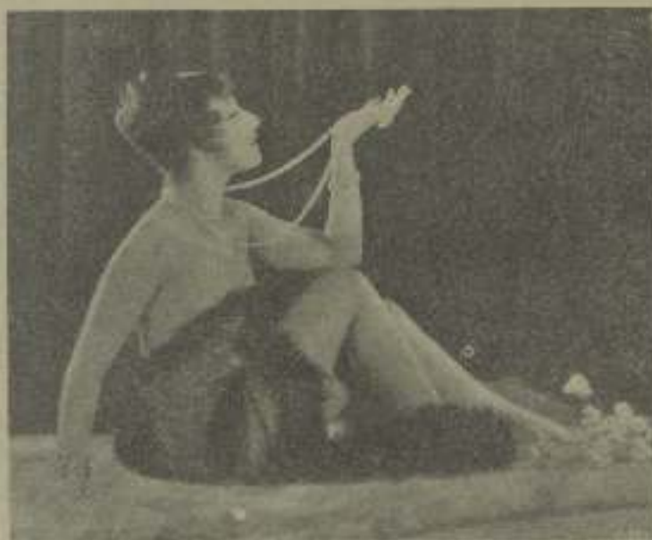
Preziosa posita que reflejáis el encanto de la mirada de esta bella y gentil estrella, ¿cómo osamos serosidad de la madre-puerta de sus labios!

sus cosas. El muchacho es muy simpático y se lo merece todo, pero eso de que le embriega a su lado y luego no sea capaz de decir nada... ¡qué desgracia, verdad!