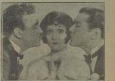
¿Aquí hay vida en pueblitos de la zona para evitar el clima húmedo que tienen estos "Pueblitos de Hollywood"?