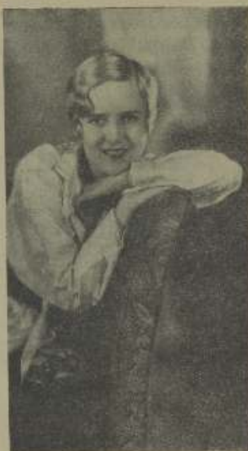
La bella y exótica «cabello» Greta Nissen