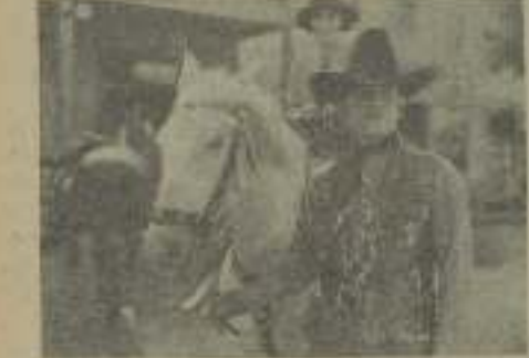
"La Rapa", escena catártica en que el héroe pasa triunfante a la montaña por haber salvado de una partida de ladrones un precioso baúl de los dos re...