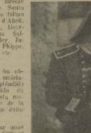
Lo simpático Stuart Haydon en "El papel de la vida"

Todos los sábados por la noche se ve concurrencia.