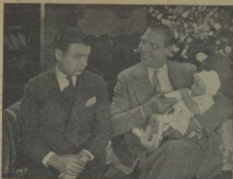
El maquinista en acción en una divertida escena de "A guisa Dios no de hijos..."