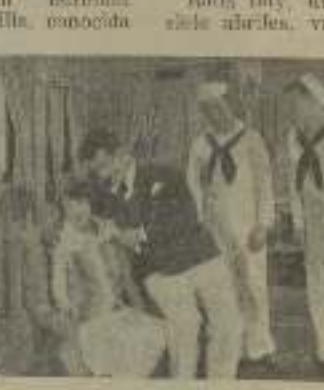
El amor es la compensación del peñero pasado en esta escena de "Puedes ser la vida de un hombre"

Una librería para vender libros a Arrowhead Springs, Gertrude Astor, William Powell, Ronald Colman y Nancy Carroll.