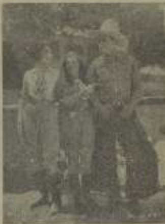
"El torbellino" es el amor cuando suegan al momento los acontecimientos.