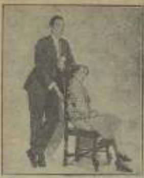
Amor de sol buscado en "Los maridos inventen"