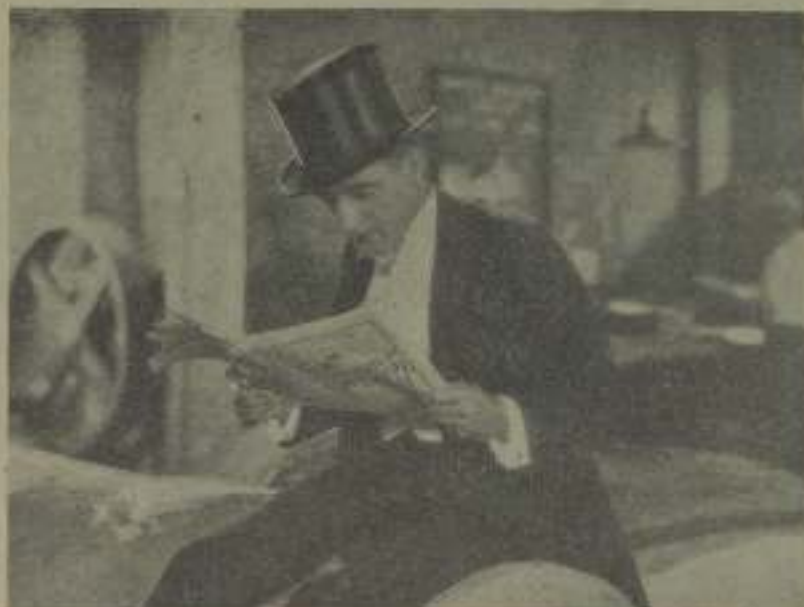
John Gilbert, obsesionado "Por una razón" lequiere en la Prensa si se encuentra entre las críticas de la crítica. ¿Puede la quiere!

su promesa hasta el fin de la primera semana de labor en la filmación de la obra. A la segunda semana el sujeto se había convertido en un tirón; a la tercera semana yo dejaba el trabajo. En menos de dos minutos de discusión le di a entender al leer a donde debía enviar a la "Vista" y a "Danilo".