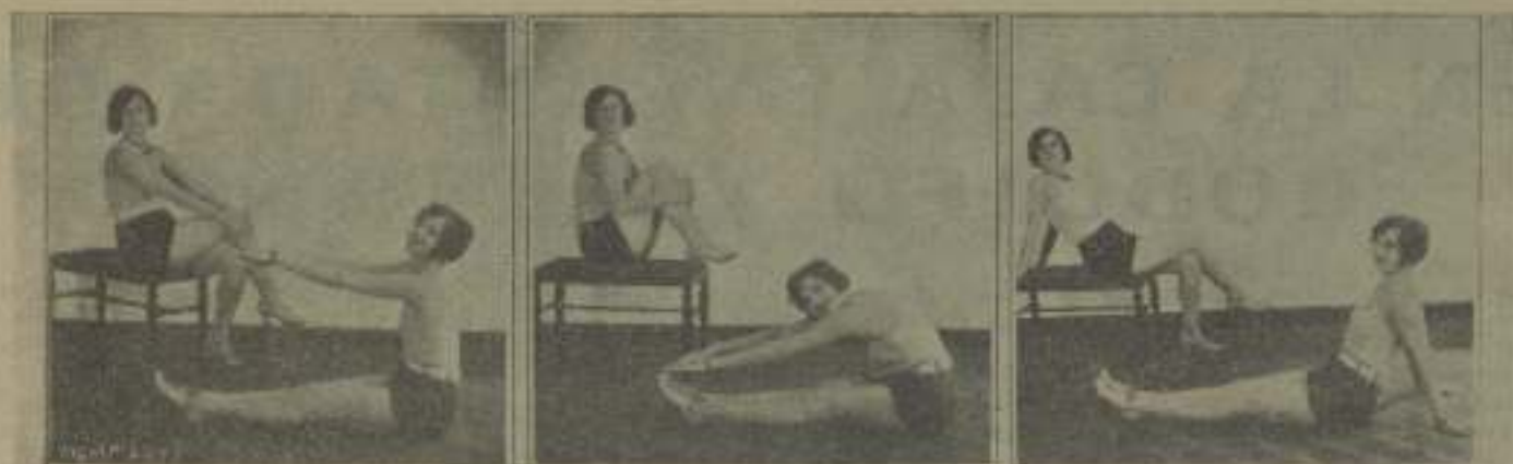
Algunos ejercicios corporales (estas son las primeras imágenes) del curso Hacer del Mar, que ayuda las "estrellas" que quieren conservar la línea escultural de sus bellos cuerpos.

La escógrafica: ¡Hola! compañero, te saludó con la mayor satisfacción. Triste como el nuestro, escribe, escribe siempre! Menos mal que en nuestra insignificancia, en nuestra pequeñez, nadie nos hace caso. ¡Pobrecillos! Ignoran que sólo nosotros poseemos las grandes verdades y secretos de la vida.