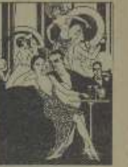
Escena de cabaret en "Marital Scam"