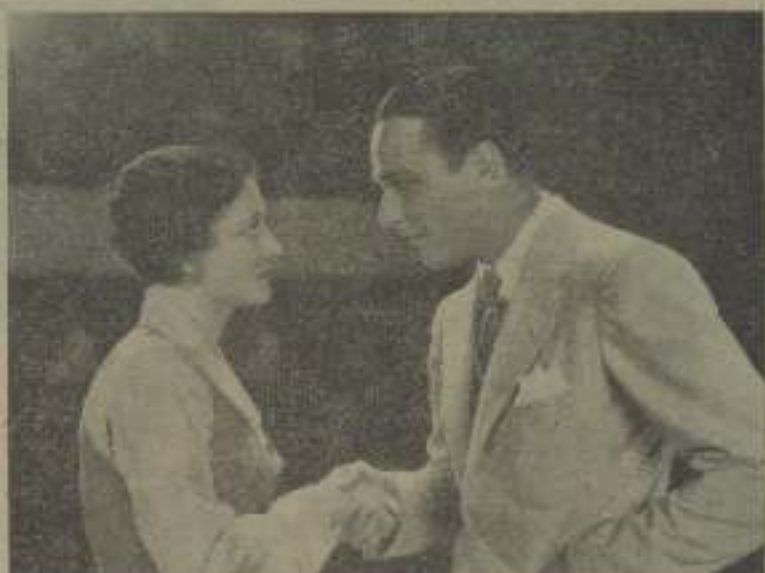
Aspirante al doctor Cupido con dulces palabras, firmes miradas, embobamiento, etc., sus señas características de "Piedra de inocencia" de amor.

El anarquista quedó en piedra, y el muchacho, un poco más por su poca dote,