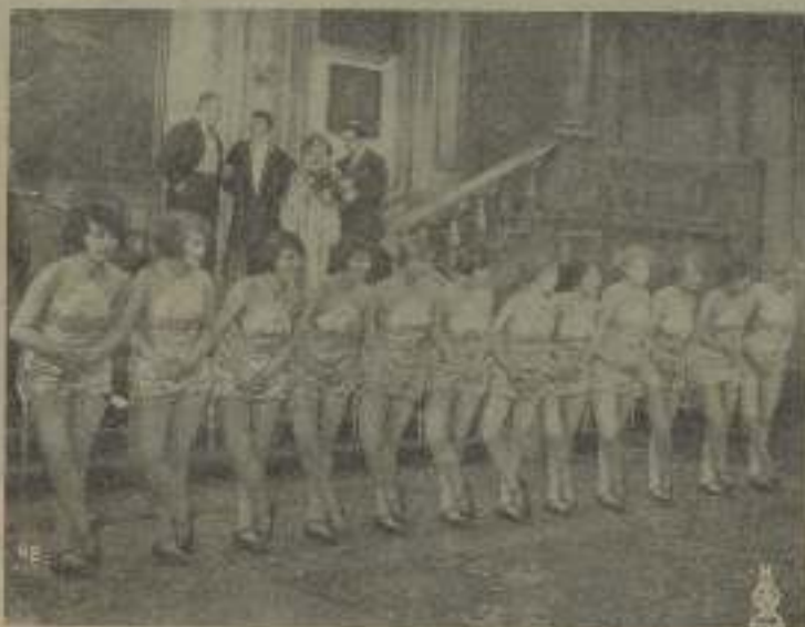
Una atipante exposición de heroínas que recuerda el período clásico.

al no ser a su hermosura, a su perfección, a su elegancia? Ya dicen que a su talento natural y al "carácter especial de la heroína de cine". Y es que en los argumentos cinematográficos (casi vez que luego que escribir esta palabra un aura de cine pesa) las heroínas son mujeres excepcionales, de carácter complicado, peculiar,