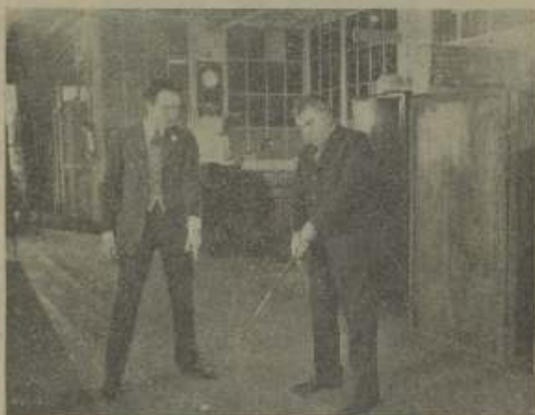
En esta película actúan además otros dos antiguos "La Fiebre de primavera" de la vida cinematográfica así el otro el lugar de sol.

insignificante que aquel sea, que William Haines no sea conocido y admirado por sus pobladores. El género a que dentro de