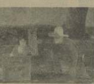
Una fiteca escondida y una situación difícil en "El valle de Plata"

George Bancroft marchó a vivir a Santa Mónica por el mismo motivo de Richard Dix.