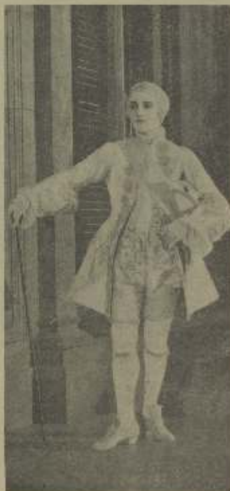
Ésta, es una caracterización de aristocrata, la más propia a su temperamento aquilino.

Hay más; un empleado de los bien surtidos estudios de Valentino se fué de la casa un atardecer sin tomar el tiempo necesario para recoger su ropa, por haber