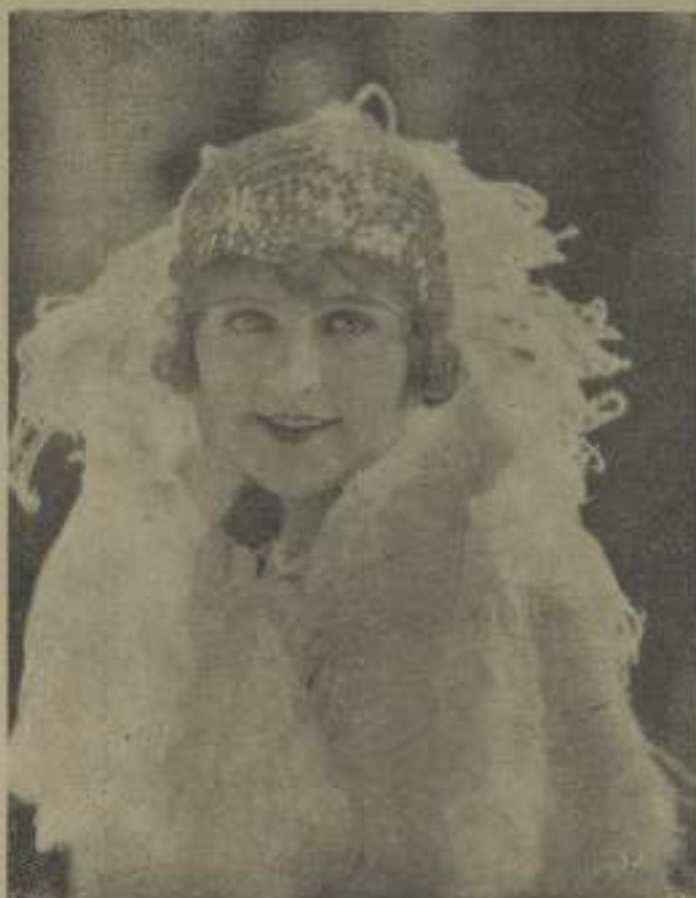
BETTY BALFOUR, la heroína de "Champagne, de la B. I. P., luce una boquita tentadora de besos sin fin