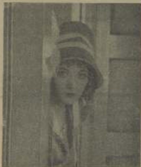
MARION DAVIES, al dar "La llamada del corazón", se apre- sura a abrirle la puerta

—En efecto, vox populi vox dei . La Cinematografía, que en su origen participa de desecularización, y en su progresiva per- fección técnica va constituyendo un invento