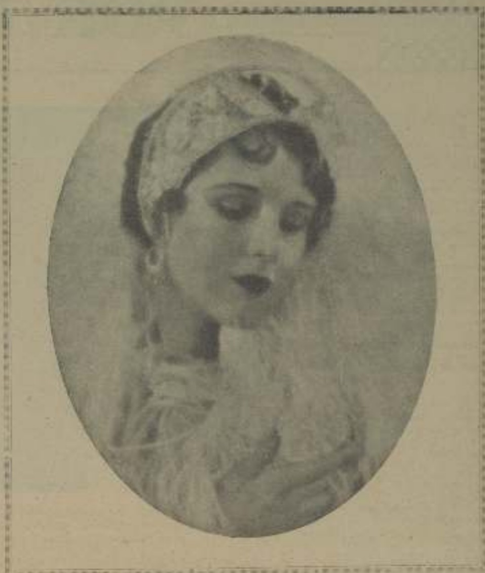
JUNE COLLYER ensimismada recordando sus éxitos, nos muestra todo el encanto de su belleza