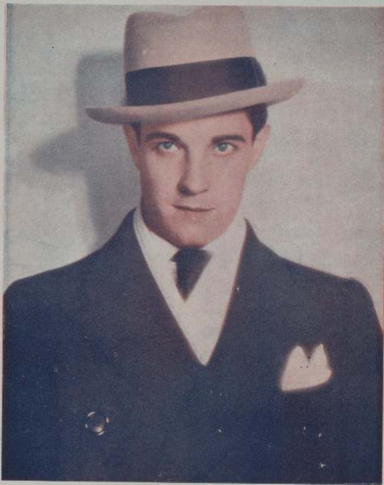
RAMON NOVARRO, protagonista de "El Príncipe Estudiante" de M.G.M.