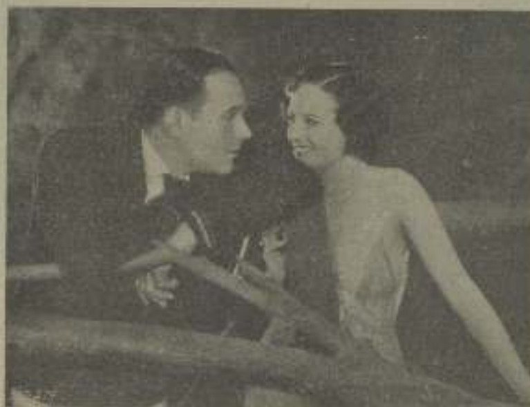
Simpática pareja, a fe, y atayante escena ésta que forman Joan Crawford y Williams Haines en "El código de Vest-Poin".

adaptado con propiedad a los diversos papeles que se le han confiado y M.-G.-M., que ha reconocido su trabajo, le ha elevado de categoría en la presente temporada.