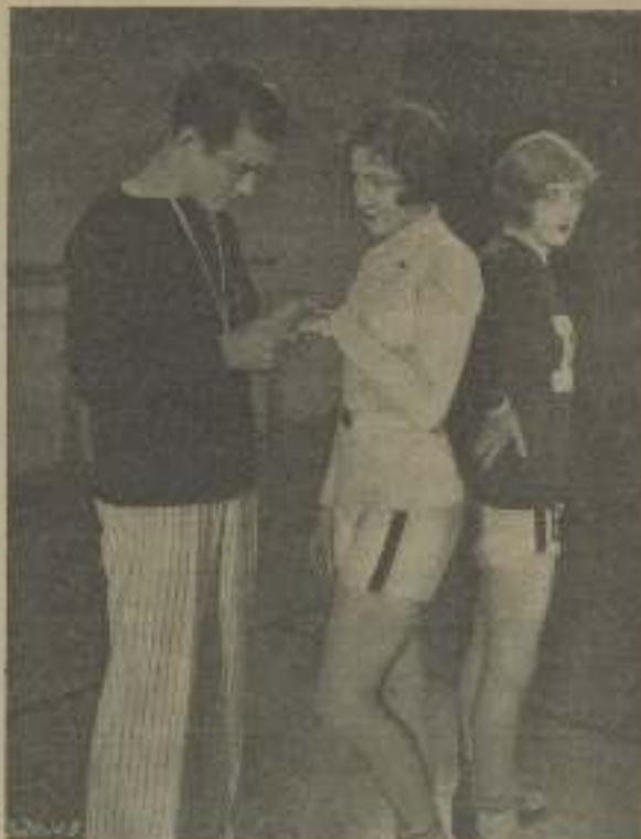
"La gloria del Colegio" y la maestra, quien lo duda

EL TEXTO DEL PRESENTE NUMERO HA SIDO VISADO POR LA CENSURA GUBERNATIVA