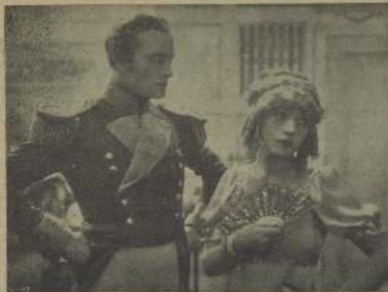
"La llamada del corazón" despierta el amor de la gentil pareja Marion Davies y Conrad Nagel