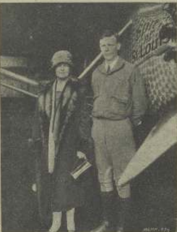
Después de haber volado "quince millos con Lindbergh" todo debe parecer pequeño

Mi dicho amigo pedeco, como un servidor de ustedes, de arrebuchos neurasténicos.