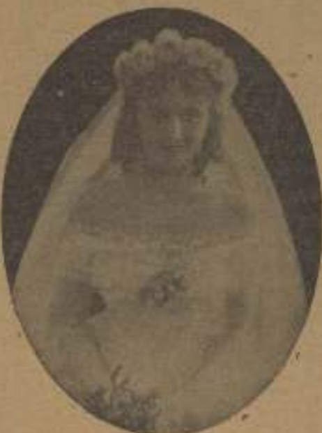
Un personaje femenino de la misma película

«El anuncio definitivo de las producciones que se harán para la primavera, hecho por la