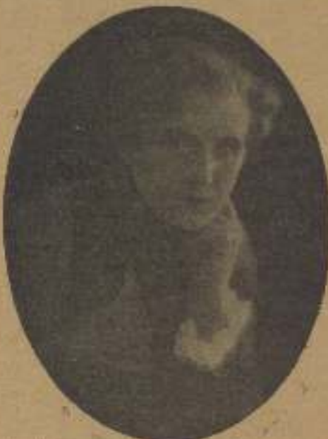
Una de las personajes más importantes de la hermosa película «Haurías a tu madre», adaptación de su novela de D. G. R.

6.ª De cada concursante que resulte elegido por la Comisión nombrada al efecto por la casa Gaumont, se impresionará gratuitamente