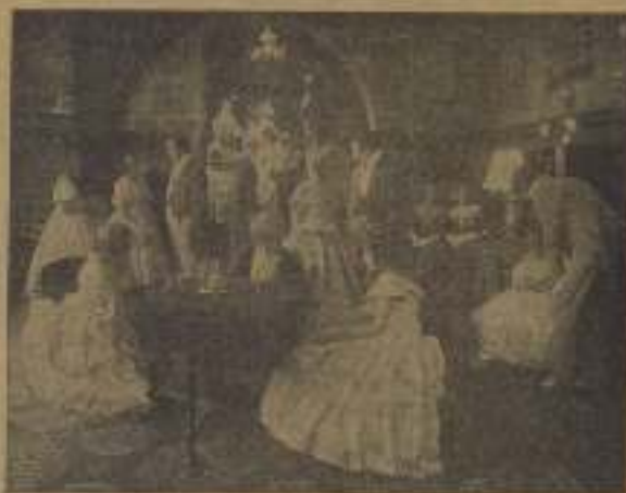
Una escena culminante de la célebre película