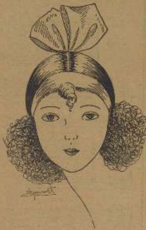
Otra vez las liras elegantes imponen la nueva moda entre las jovencitas

Solicitan madrina de guerra entre las lectoras de El Cine los siguientes sol- dados: