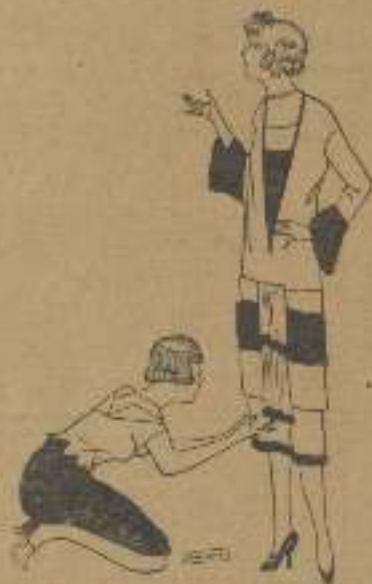
Elegante vestido con anagras color crema

nerse a perder la clientela y, ¿quién sabe!, hasta promover un cisma; porque estas devotas a la moda son rapaces de todo.