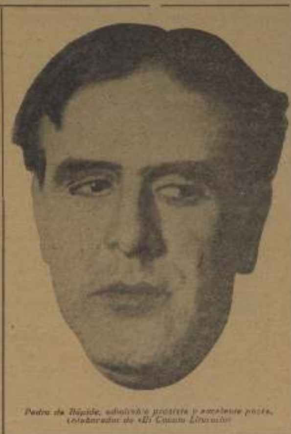
Pedro de Répide, autor de la prosa y excelente poeta. Celebración de «El Cincua Literario»

Y como poeta, Répide ha escrito una infinidad de versos tan magníficos como los que te ofrecemos en esta página, lector.