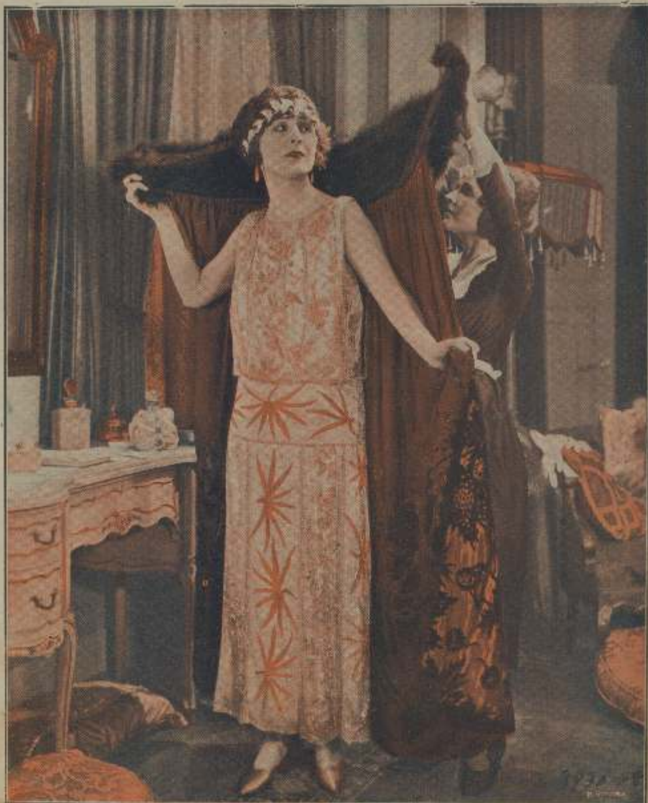
ETHEL GREY TERRY, gentil y famosa estrella de la "Universal", en una de sus últimas creaciones