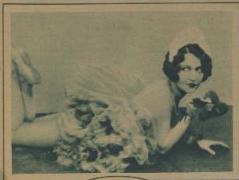
DOROTHY SEBASTIÁN, ESTRELLA DE LA SIRENA