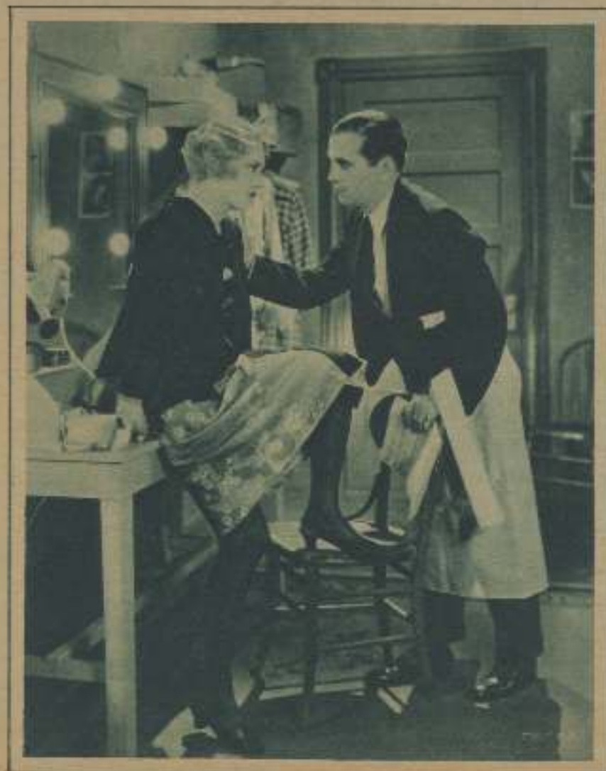
JOSEPHINE DUNN Y AL JOLSON, EN UNA ESCENA DE EL BOBO CANTOR