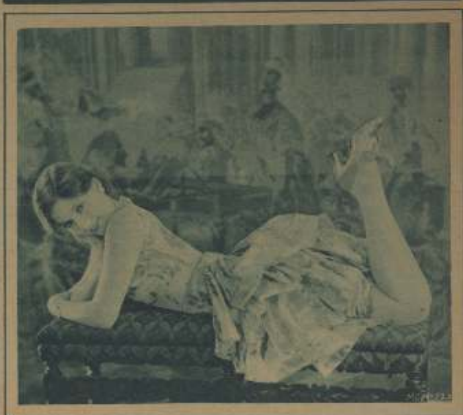
MARTA SLEEPER, ESTRELLA DE LAS COMEDIAS HAL ROACH