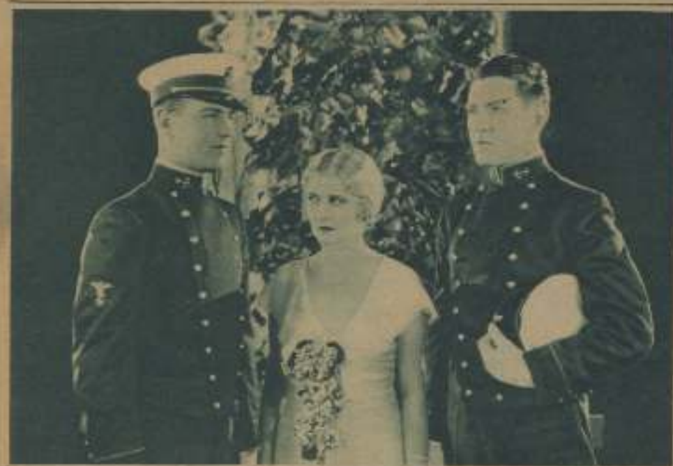
HUGH ALLAN, JEANNETTE LOFF Y JOHNNY MACK BROWN, EN «ANNAPO- LIS», CINTA DI- RIGIDA POR CHRISTY CA- BANE