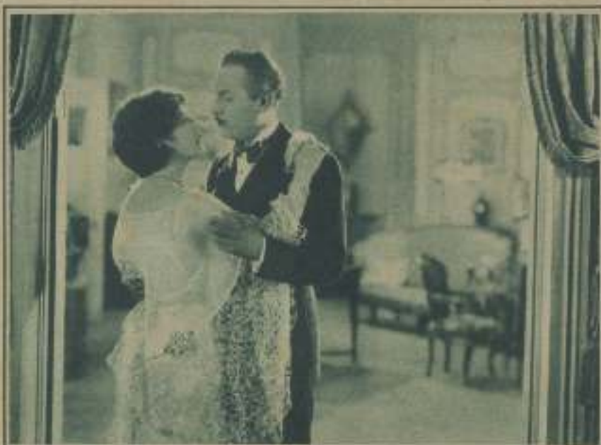
AILEEN PRINGLE Y LEW CODY EN UNA ESCENA DE «SADÁN Y KVAS»