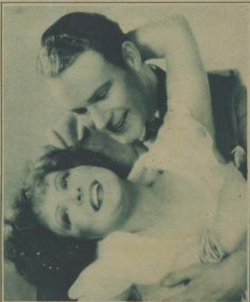
CLARA BOW Y LANE CHANDLER EN «LA PELEIRROJA»