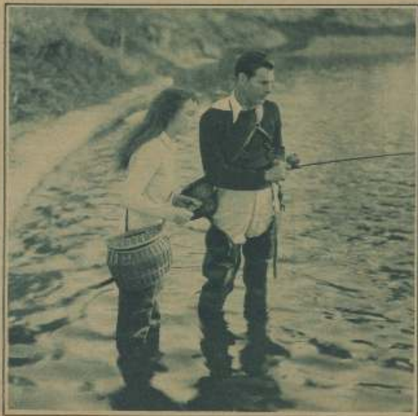
RICHARD ARLEN, EL SIMPÁTICO GALÁN DE SALAS, Y SU ESPOSA JOBYNA HAYDON, COMPAÑERA DE HAROLD EN SUS DIVERTIDAS PARASAS, SE DEDICAN A PENSAR COMO CAERÁN EN LAS HORAS DE DESCANSO

los fines principales del decreto de 11 de febrero de 1928 es el de convertir la producción francesa en una producción de calidad, aun en el caso en que ésta pudiera ser obtenida en detrimento de la cantidad."