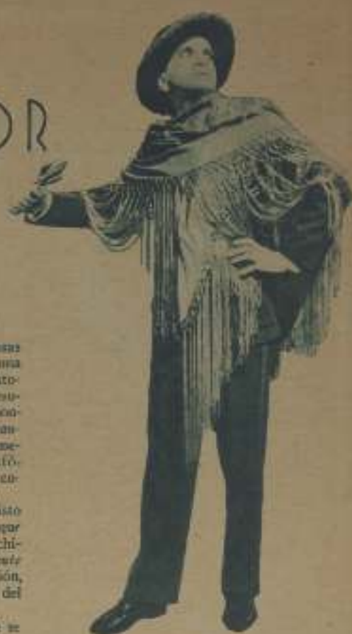
AL JOLSON EN UNA PARODIA DE CANCIÓN ESPAÑOLA EN EL BOBO CANTOR

Lo importante en esas cintas fue que había en ellas algunos actores que logra-