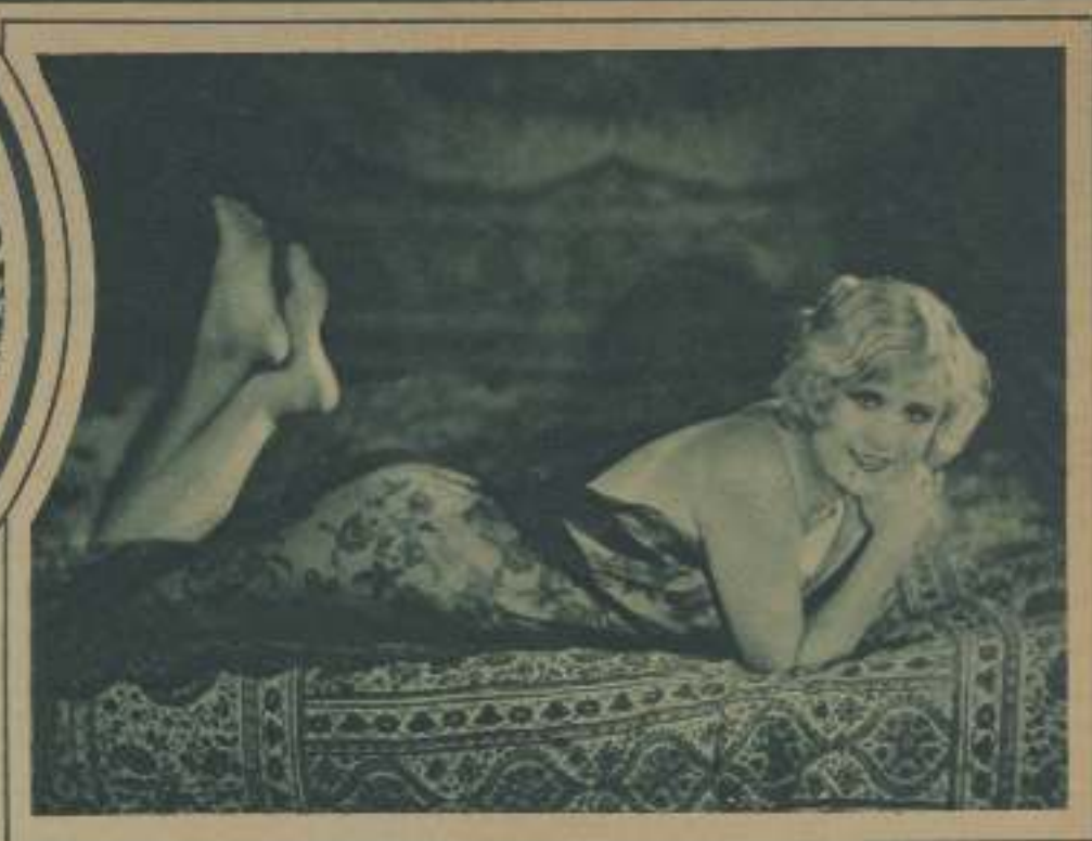
VIRGINIA VANE, ESTRELLA DE PATHÉ