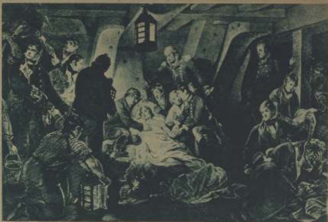
LA MUERTE DE LORD NELSON, REPRESENTADA EN EL SIGLO XVI POR EL MAESTRO ROBLAIS EN UNO DE SUS CUADROS MÁS FAMOSOS