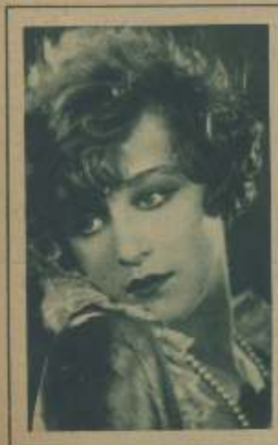
CLARA BOW, LA ESCANDALOSA RUBIA, PROTAGONISTA DE LA PELÍCULA DEL PRÍNCIPE PAJILA

Madame Glyn, máxima autoridad hollywoodense en estos asuntos, decretó que Clara Bow es la quintaesencia del "Ello", es decir, de la atracción y la gracia irresistible, y, de acuerdo con su opinión, le prepara argumentos a su imagen y semejanza, en los que a la traviesa Clarita le basta con ser ella misma para triunfar plenamente. Procedimiento fácil y seguro que encierra un grave peligro: el de agotar rápidamente a una artista, por la monotonía inevitable de sus actuaciones.