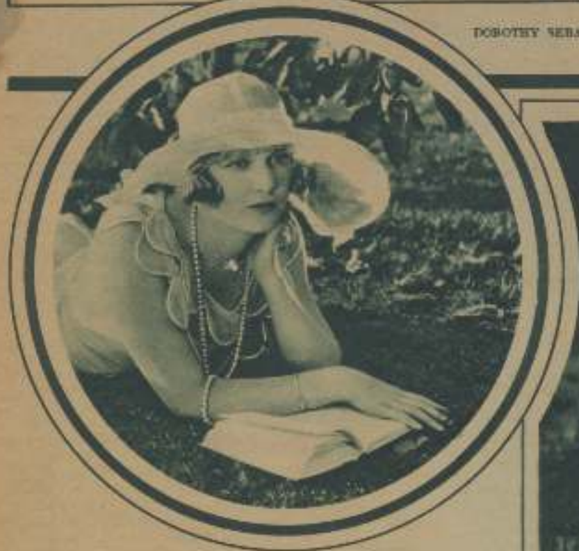
ESTHER RALSTON, LA BELLÍSIMA ESTRELLA DE LA PARAMOUNT