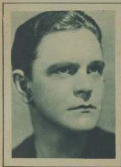
GLENN TRYON, PROTAGONISTA DE «EN ALAS DEL AMOR»