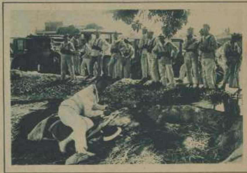
DOS ESCENAS DEL ROYALTY DE EL OCCIDENTE, PRODUCCIÓN DE LA CINEMAMANS-FILMS DE FRANCIA, QUE HA SIDO EL PRIMER ESTRENO SENSACIONAL DE ESTA SEMANA EN EL BOULEVARD

DESCANSO DE LOS ARTISTAS DURANTE LA FILMACIÓN DE LA PELÍCULA