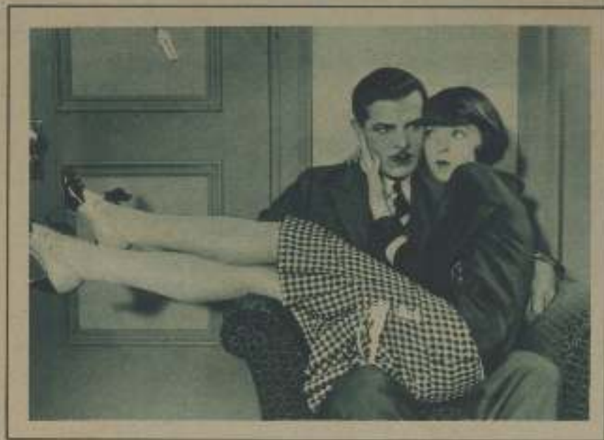
COLLEEN MOORE CON ANTONIO MORENO, EN LA NUEVA PELÍCULA "SYNTHETIC SINS"