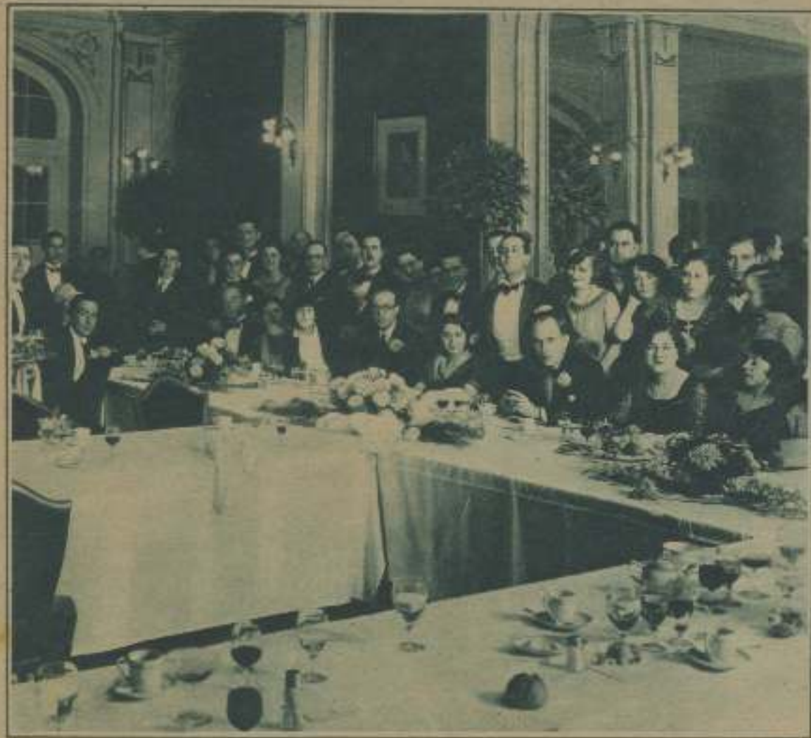
LA MESA PRESIDENCIAL, AL TERMINAR EL BANQUETE, ES ABANDONADA POR LOS COMENSALLES, DESBOSOS DE RECIBIR SUS FELICITACIONES ENCOMIENDAS AL FESTEJADO.