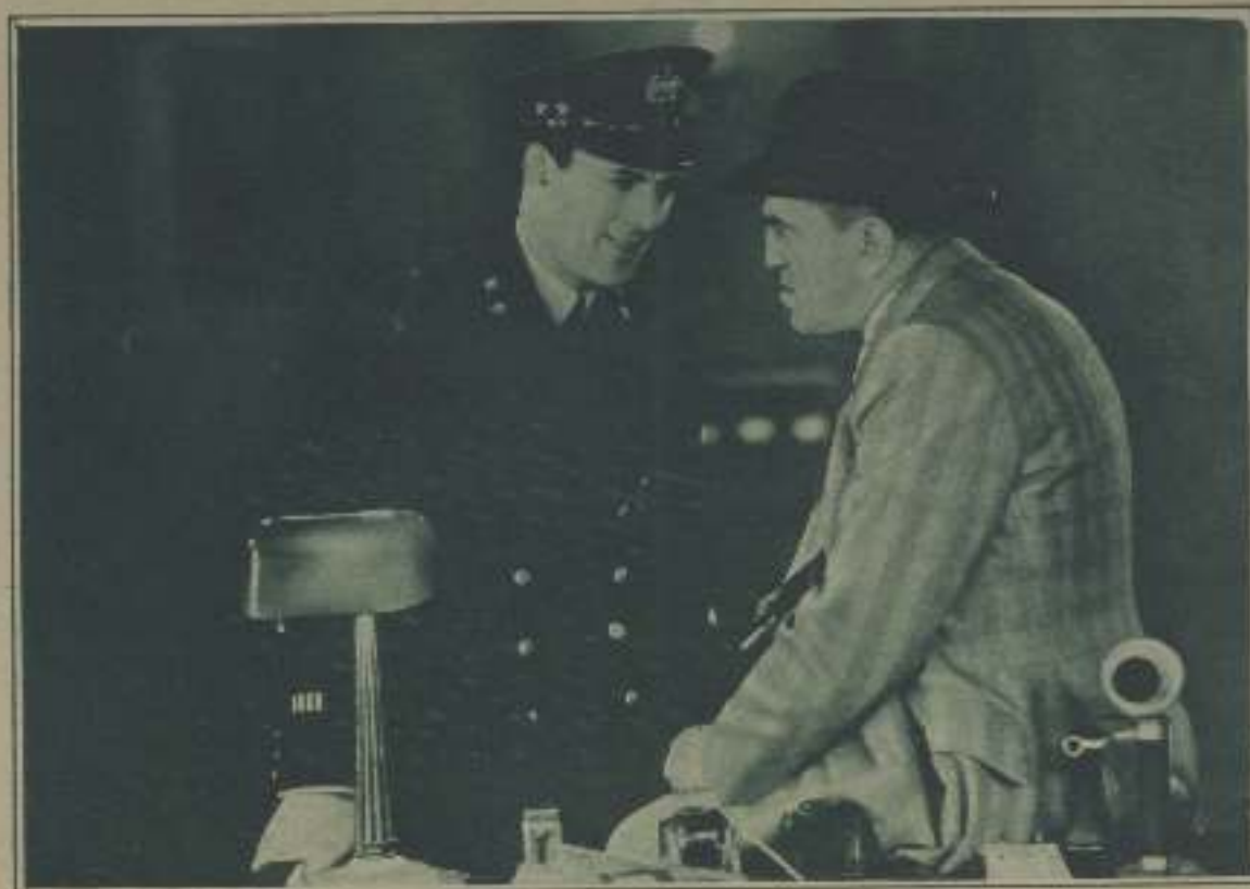
LOUIS WOLHEIM, EL ACTOR MÁS FEO DE LA PANTALLA, CON THOMAS MEIGHAN EN UNA ESCENA DE LA PELÍCULA POLICIACA "THE RACKETY".

Wolheim se desvió de su carrera científica gracias a una de sus frecuentes visitas a los bur-ros, en la época