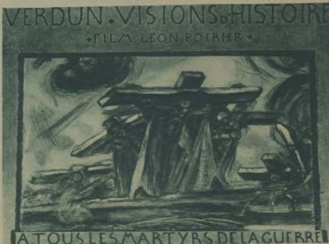
CARTEL ANUNCIADOR DE «VERDUN: VISIONES DE HISTORIA», POR GEORGES DESVALLIÈRES