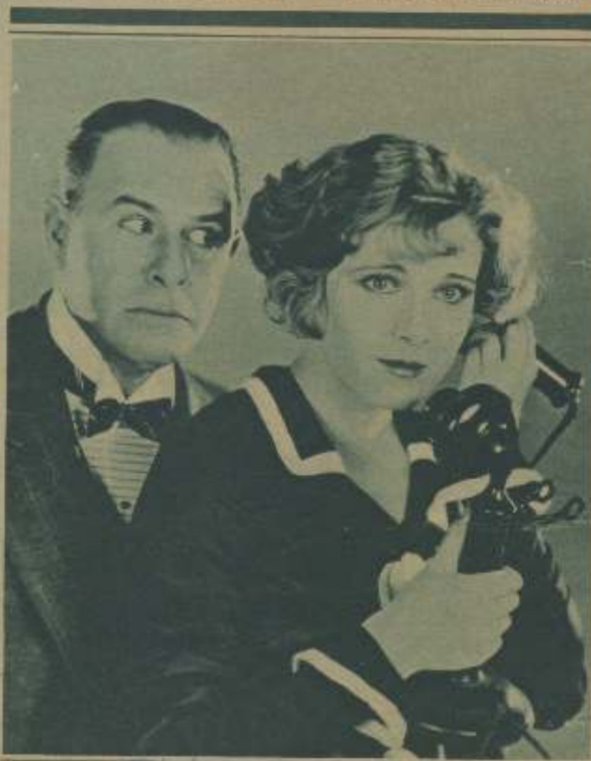
LA DESAGRADABLE ESCENA QUEDÓ CORTADA POR UNA PROVIDENCIAL LLAMADA DEL TELÉFONO

Lo primero que hizo Roberto fué instalarse en su nueva casa, y lo segundo,