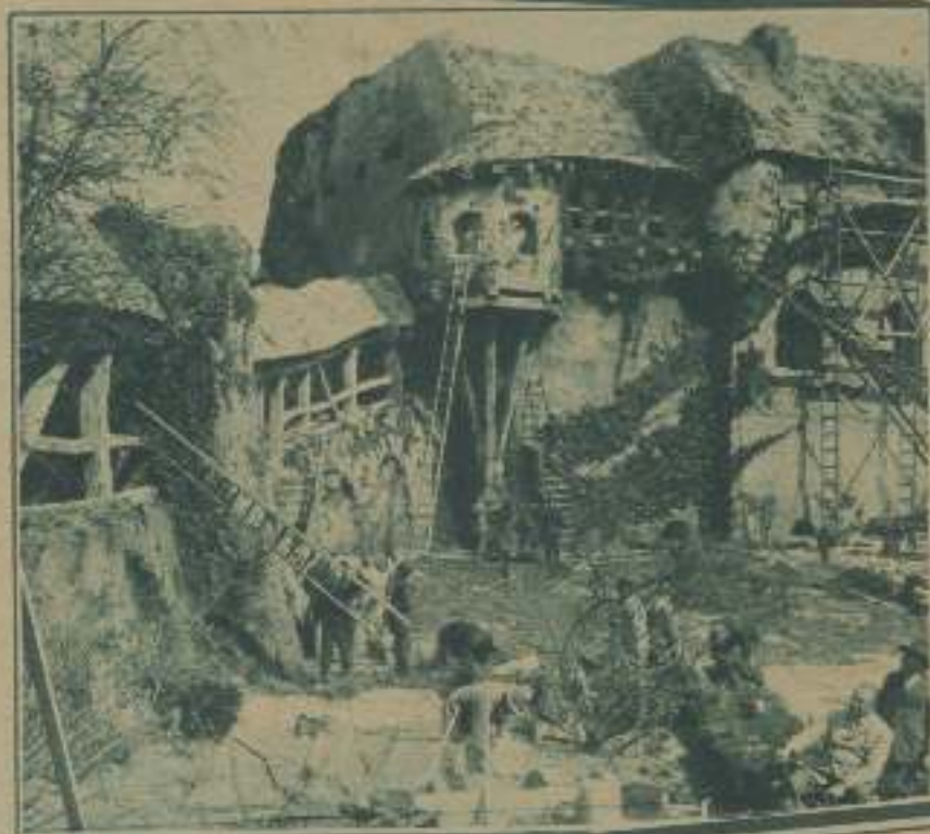
IMPRESIÓN DE UN EXTERIOR EN LOS ESTUDIOS EUROPEOS DE NEUBAU-BRISNACH

Esta es una de las causas primordiales de que ya no se encuentre una dirección concienzuda en la reproducción de un "interior". La fachada, el jardín o la calle son también llevados a los estudios.