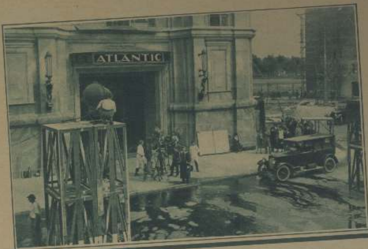
EL HOTEL ATLANTIC VISTO POR SU FRENTE Y SU REVERSO (QUE CON- TRASTE)