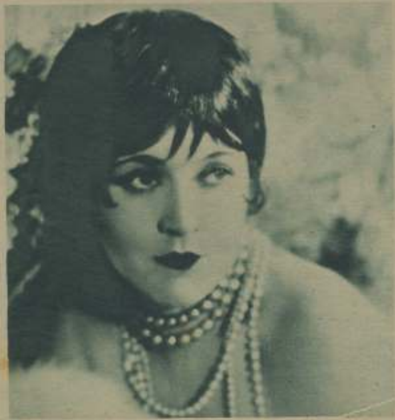
MARIE PRÉVOST, PROTAGONISTA DE "CEBO PARA HOMBRES"