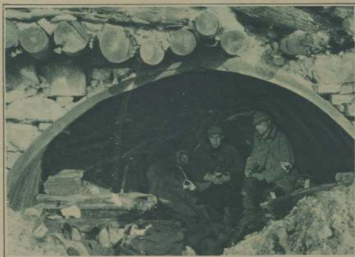
FUESTO DE SOCORRO DURANTE EL COMBATE, SEGÚN LO EVOKA EL FILM DE GUERRA HISTÓRICO RECENTEMENTE EN LA ÓPERA DE PARÍS