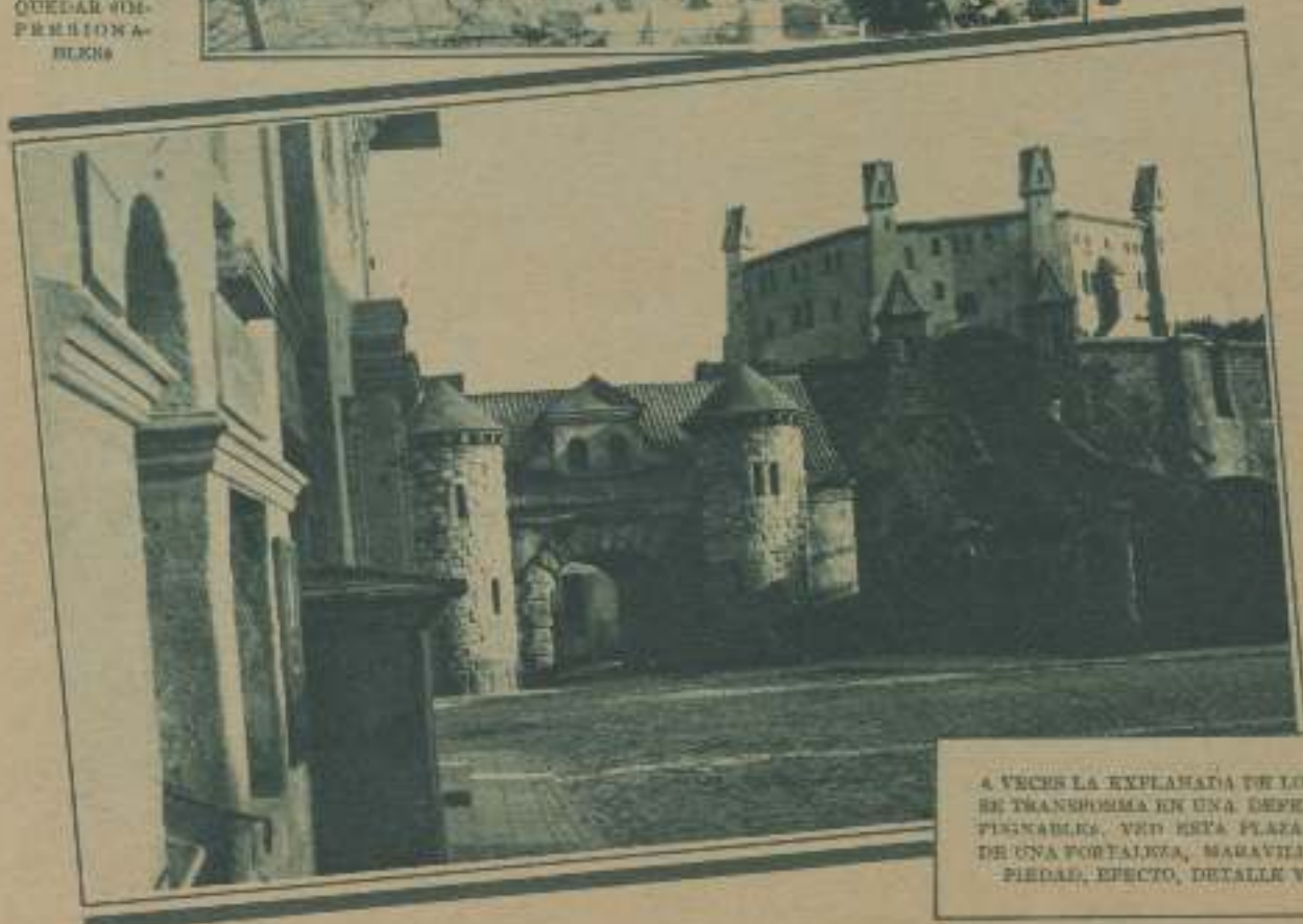
A VECES LA EXPLANADA DE LOS ESTUDIOS SE TRANSFORMA EN UNA DEFENSA CINCEPISINABLE. VEO ESTA PLAZA DE ARMAS DE UNA FORTALEZA, MARAVILLA DE PROPIEDAD, EFECTO, DETALLE Y SOLIDEZ