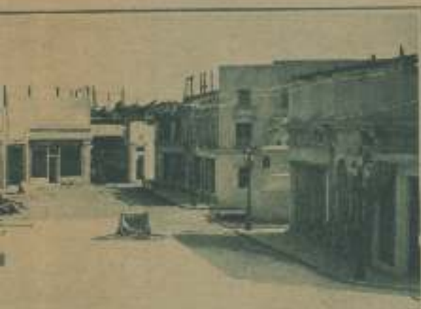
CALLE ESPAÑOLA. SOBRE LAS PUNTERAS DE LOS COMERCIO APARECEN LAS MUESTRAS DE CANTINERIAS, CANTINERIAS, CANTINERIAS DE COCHAS, CANTINERIAS Y PUNTERAS, EN EL MÁS PURO CASTELLANO