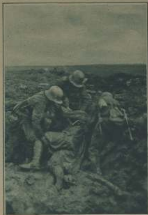
UNA ESCENA DE EVERETT , DONDE DOS SOLDADOS AUXILIAN A OTRO QUE SE HA HUNDIDO EN EL BARRIO

"Las Alas Rotas", sociedad de ayuda mutua de los aviadores militares heridos en el servicio aéreo, prepara, con propósito de allegar recursos a su caja de socorros.