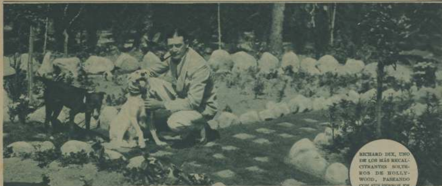
RICHARD DIX, UNO DE LOS MÁS RECALCITRANTES HOLLYWOOD, PASEANDO CON SUS PERROS EN EL JARDÍN DE SU CASA

—Con el título de El barba rojo , el célebre dramaturgo francés Henry Bernstein ha escrito un escenario que le había pedido la Fox y que animará Hurman.