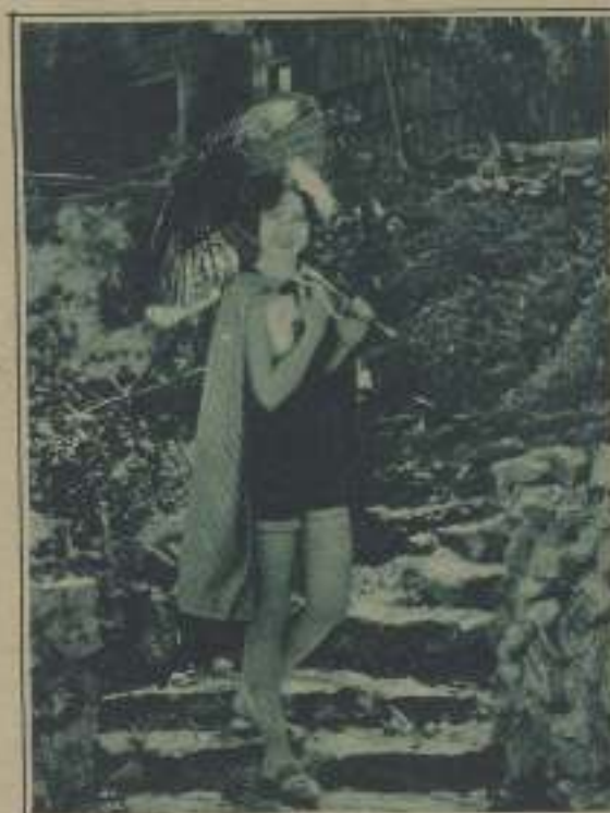
NANCY CARROLL, SIMPLE BAÑISTA HASTA HACE POCO, ACABA DE SER ASCENDIDA A PRIMERA DAMA Y HA IMPUESTO EN LA PLAYA, ESTE VERANO, LA MODA DE LAS CAPAS IRREVOCABLES, COMO ESTA QUE LUCE EN LA FOTOGRAFÍA, DE SEDA RAYADA POR UNA DE SUS CARAS...