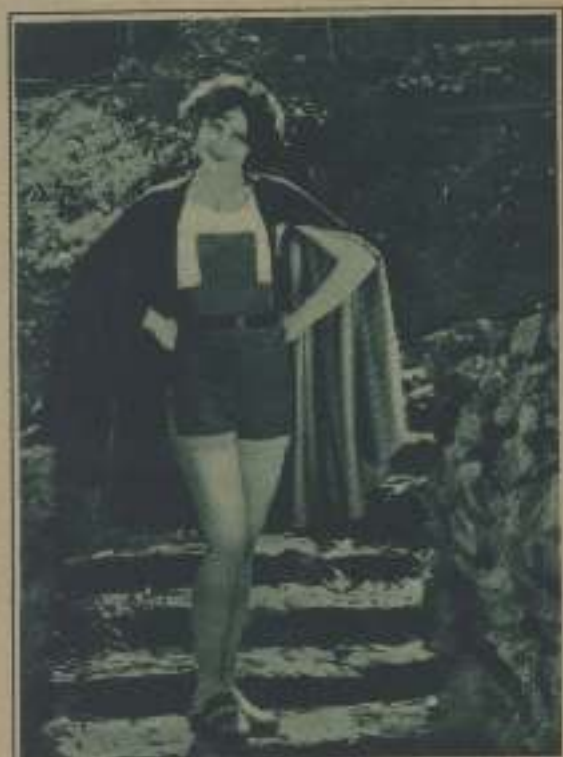
...Y DE SEDA EN UN TONO LISO POR LA OTRA, IMPERMEABILIZADA Y MUY FLEXIBLE. EL MAILLOT ES DE PUNTO, COMBINADO EN LOS DOS TONOS, Y LAS SANDALIAS, DE CUERO SUAVE.

Hace aún poco tiempo en una de las más lindas playas de Hollywood, se llevó a cabo un concurso muy original... Consistía en un desfile de trajes de baño, en el cual, más que la forma de los trajes, había de servir de pauta al Jurado para otorgar sus premios los colores y la calidad del vestido... El concurso se realizó, y con tan fantástico aspecto, que resultaría tarea casi imposible el descri-