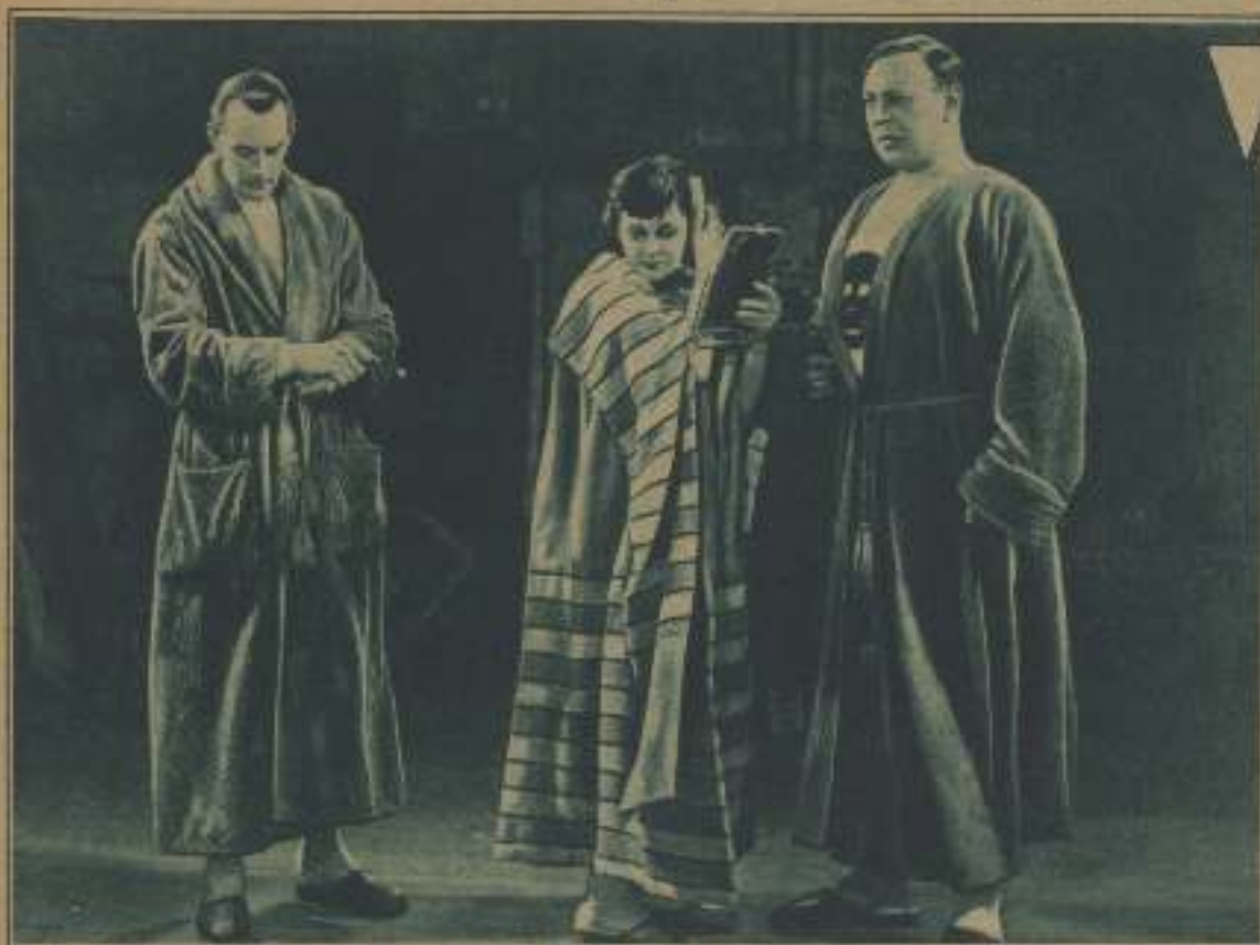
OTRA ESCENA DE LA PELÍCULA EUROPEA «VARIÉTÉ», EL ETERNO TRIUNFO PERSONIFICADO AQUÍ ADMIRABLEMENTE, POR WARWICK WARD, LYA DE PUTTI Y EMIL JANNINGS, EL ORO DE LA CINEMA TOGRAFIA MODERNA

mil dólares semanales. Era mucha tentación; pero a la larga me convenía más quedarme aquí. Por ahora no he pensado en hacer el viaje.