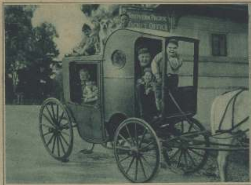
LOS HEREDEROS DE «LA PANTALLA», TRAVESOS Y GRACIOSOS, TAMBIÉN SON UN BUEN EJEMPLO PARA LOS PEQUEÑOS ASPIRANTES AL PREMIO CONCEDIDO AL NIÑO TERRIBLE.