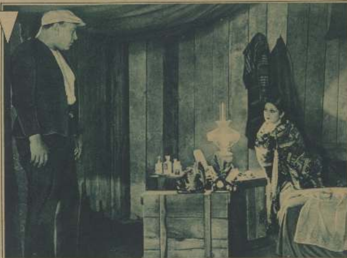
CON LA LLEGADA DE MERTA MARÍA A LA BARACA DE BOMBES SE INICIA LA TRACEDIA QUE, BAJO EL TÍTULO DE AVARIETTES, HABÍA DE HACER FAMOSOS EN EL MUNDO LOS NOMBRES DE LYA DE PUTTI Y RUEL JANNINGS

—A ver, póngase de pie, dé unos pasos hacia atrás. ¿Qué altura tiene usted? ¿Qué peso? (La entrevista se ha vuelto del revés.) Tiene usted los ojos y la frente como Valentino, pero en mejor; lo menos valen otro millón.