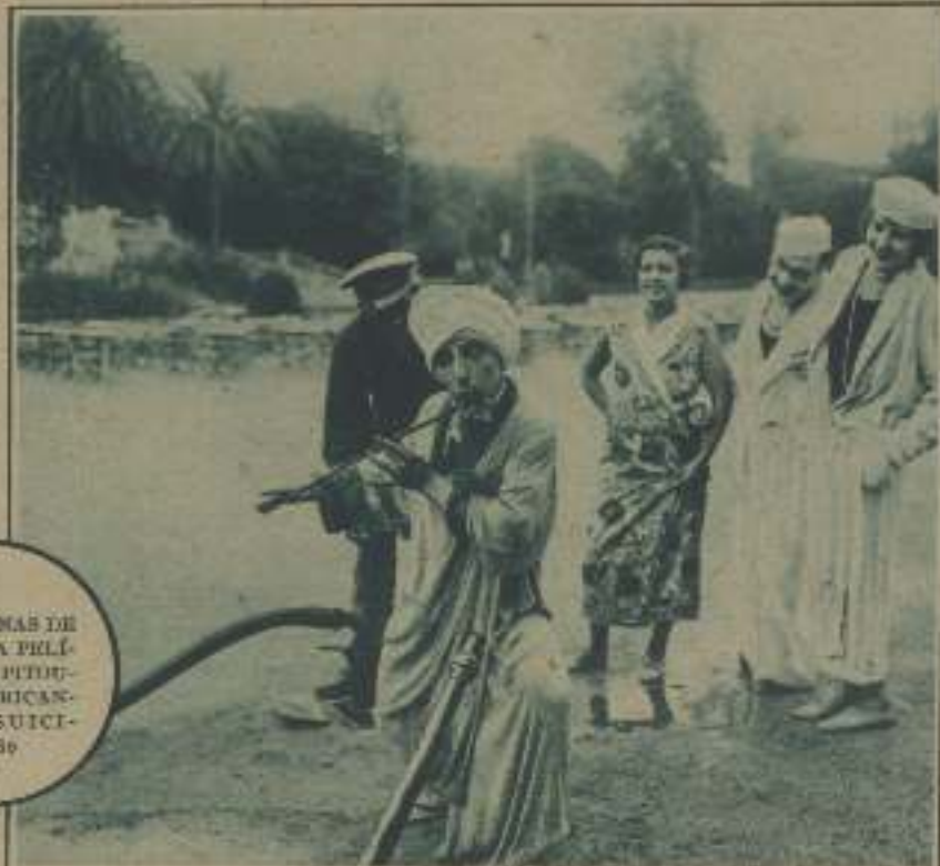
DOS ESCENAS DE LA NUEVA PELÍCULA DE PITONTO, FABRICANTE DE SUICIDIOS .