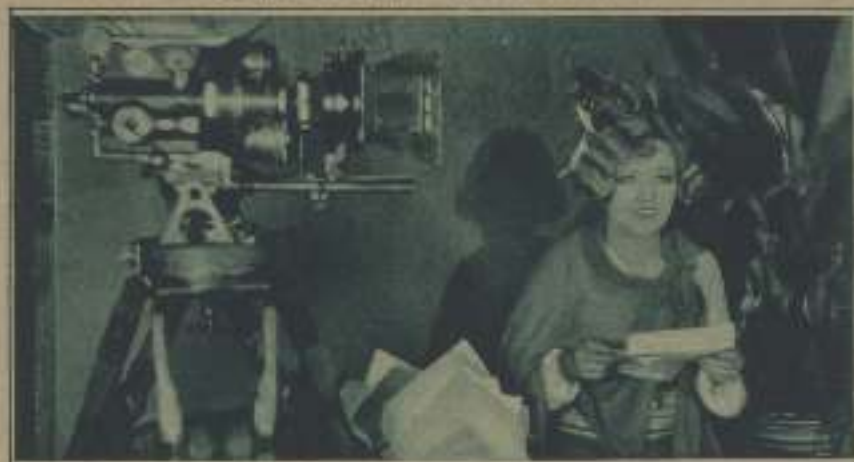
MARION DAVIES, PROTOTIPO DE LA TRAVESURA Y EL DINAMISMO DE LA MUJER AMERICANA, PODRÍA SERVIR FÁCILMENTE DE MODELO PARA LAS DAMITAS ESPAÑOLAS QUE QUIERAN TOMAR PARTE EN EL CONCURSO DE LA EVA MODERNA.

Todas las jóvenes que aspiren a encarnar el tipo de La mujer moderna y todos los muchachos que se sientan empujados de "Chiquillín", pueden enviarnos sus retratos a nuestras oficinas a partir de la publicación de este número, y de entre las fotos recibidas, un Jurado seleccionador elegirá las muchachas y los niños a quienes el Congreso otorgará las pruebas cinematográficas totalmente. Las pruebas gratuitas de los así elegidos entrarán en concurso con los mismos derechos que las de todo concursante.