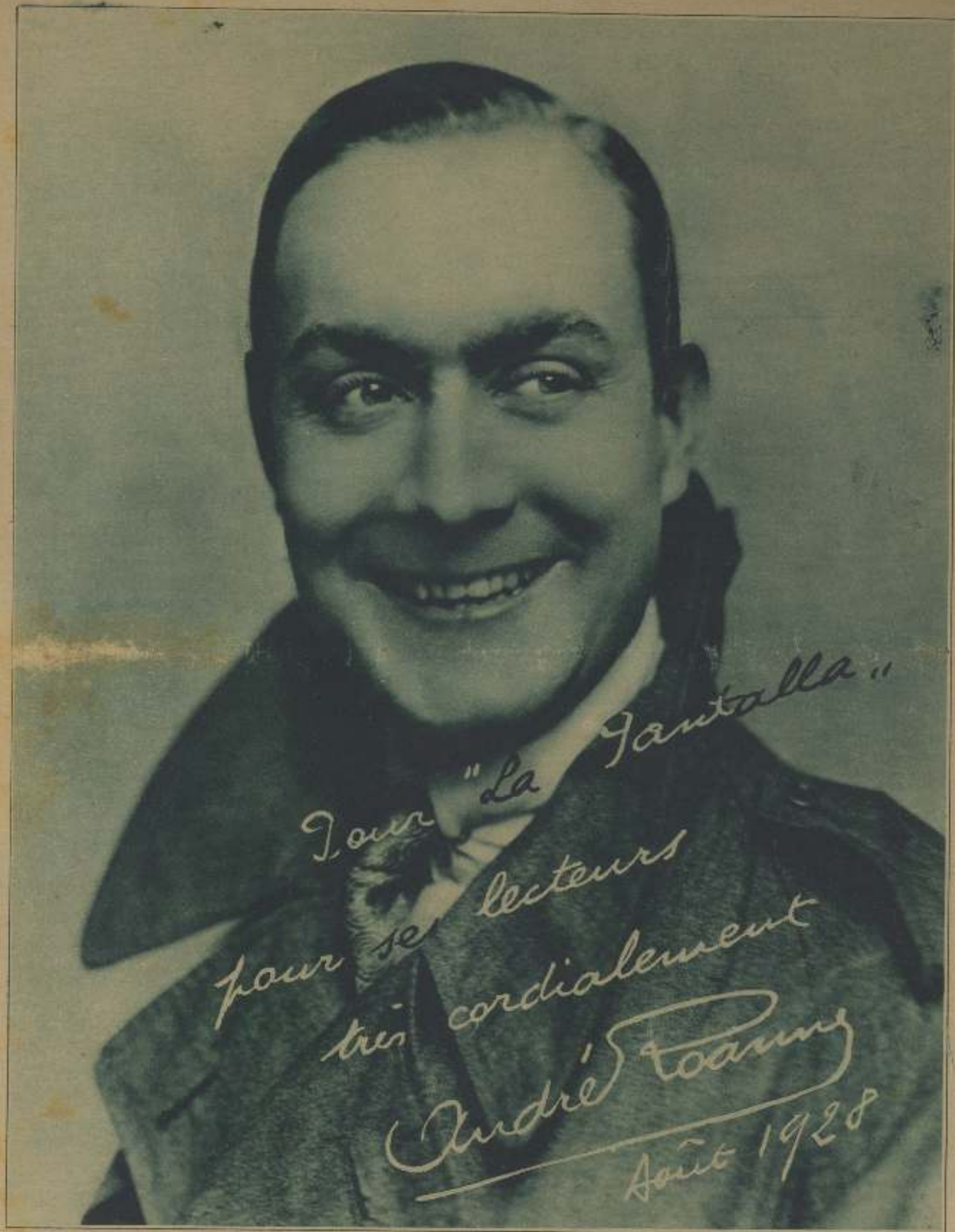
ANDRÉ ROUART, UNO DE LOS MÁS JÓVENES Y SIMPÁTICOS GALANES DE LA PANTALLA FRANCESA. NACIÓ EN PARÍS EL 24 DE SEPTIEMBRE DE 1906. Y, EMULANDO EN ESTO A LOS «STARS» AMERICANOS, HA SIDO VA PROTAGONISTA DE DOS AVENTURAS MATRIMONIALES TERMINADAS EN EL INEVITABLE DIVORCIO. DESTACAN ENTRE SUS CRIACIONES VA NUMEROSAS, LAS DE «DESEMPEÑADO EN SEGUROS», «LA ATLÁNTIDA», «LA TIERRA PROMETIDA», «LA CHOCOLATERÍA», «LA RUTAS NÚMERO 47», «LA DUCHESA DEL POLLEN-BERRIERES», «LA SOMBRA OSCURECIDA», «AMBIENTOS INESISTIBLES» Y «EL BAILARÍN DESCONOCIDO».