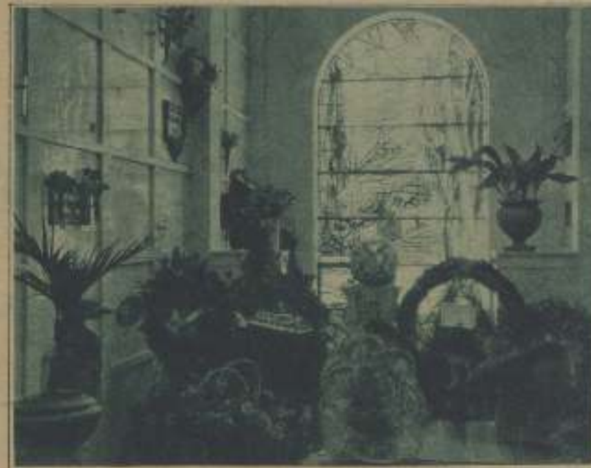
EN RINCÓN DEL PANTERÓN DONDE REPOSA DEFINITIVAMENTE RODOLFO VALENTINO