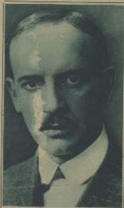
NICOLÁS RIMSKY, GRAN ACTOR TRAGICÓMICO DEL CINEMA FRANCÉS, CUYAS ASOMBROSAS CREACIONES EN LA MEDIA NOCHE EN LA PLAZA PIGALLE Y DE TRES MUCHACHAS DESNUDAS, LE CLASIFICAN ENTRE LOS PRIMEROS ASSES DE LA PANTALLA

Des creaciones recientes del admirable actor— A media noche en la plaza Pigalle y Tres muchachas desnudas , que uno no conoce el público—han asombrado a la crítica francesa y asombrarán a la del mundo entero en cuanto se propaguen. No desvirtúan, sin embargo, nada más que espontaneidad, nada menos que honradez. Rimsky encarna efectivamente un personaje, y dentro de su nueva piel, obra como obraría el personaje en cualquier otra de cueros, por ejemplo, se mueve y se disloca una muñeca o un muñeco con frecuencia; si ha de llorar, llora de veras, y si ha de mostrarse ridículo, a fuerza de ridículo, se muestra al fin sublime.