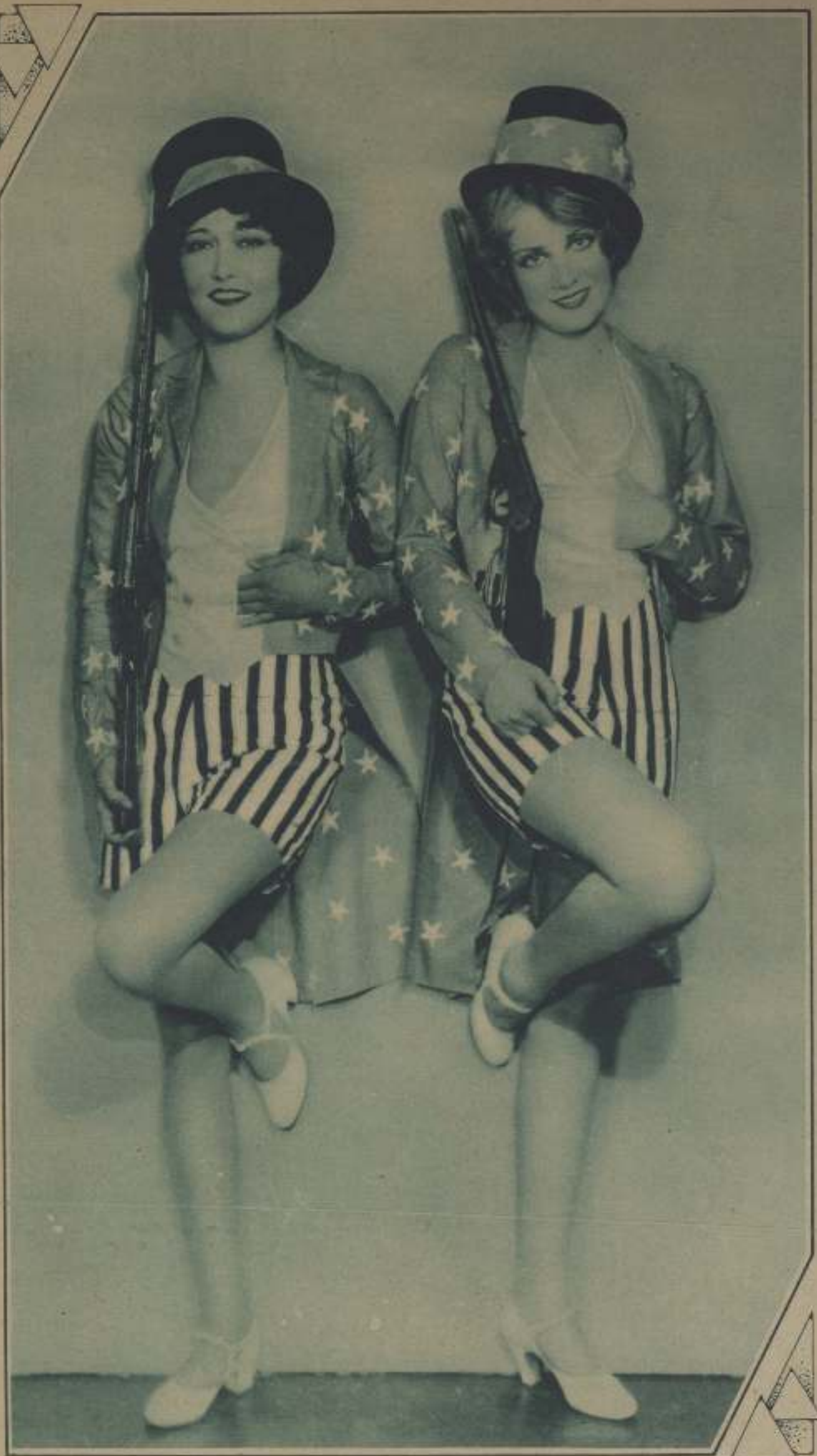
DOROTHY SEBASTIAN Y ANITA PAGE, CONVENIENTEMENTE EQUIPADAS PARA CELEBRAR EL ANIVERSARIO DE LA INDEPENDENCIA NORTEAMERICANA.