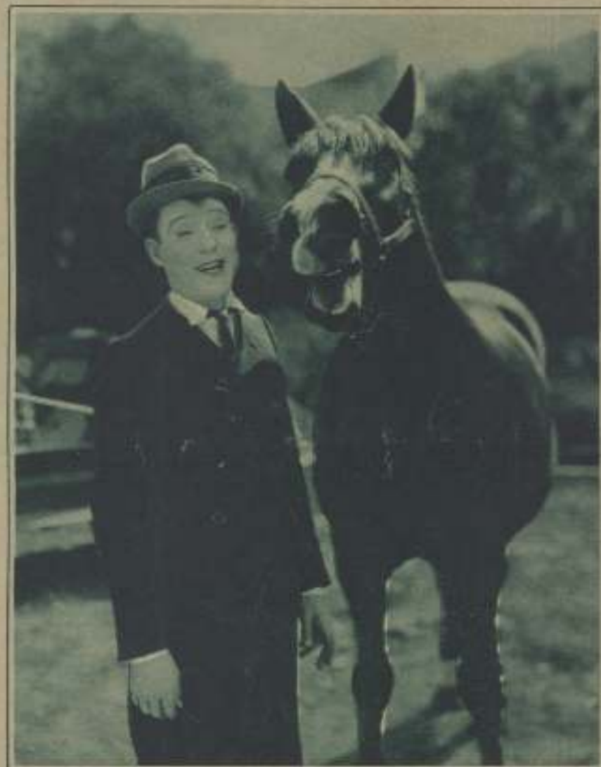
—AHORA CUENTAME OTRO— DICE HARRY LANGDON—, PERO SÓLO CONSIGUE UNA CARCAJADA DE CABALLO. PEQUENA ESCENA ÍNTIMA DE WILKAT TROUBLES, PRÓXIMA SUPERCOMEDIA DE LA FIRST NATIONAL.