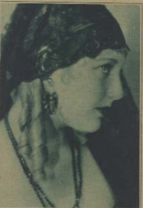
THELMA TODD, ALUMNA DE LA ESCUELA PARAMOUNT, HIZO SU PRIMER ENSAYO CINEMATOGRAFICO EN «RADIANTE JUVENTUD» Y ESTÁ ADQUIRIENDO MÉRITOS PARA EL «RYTHMILATON» EN LOS ESTUDIOS «FIRST NATIONAL»

Por todo ello, y acaso especialmente por ese inestimable favor que le hizo la muerte al llevarlo en el apogeo de su éxito, evitándole ese triste caso cinematográfico en que tarde o temprano se hunden todas las figuras que