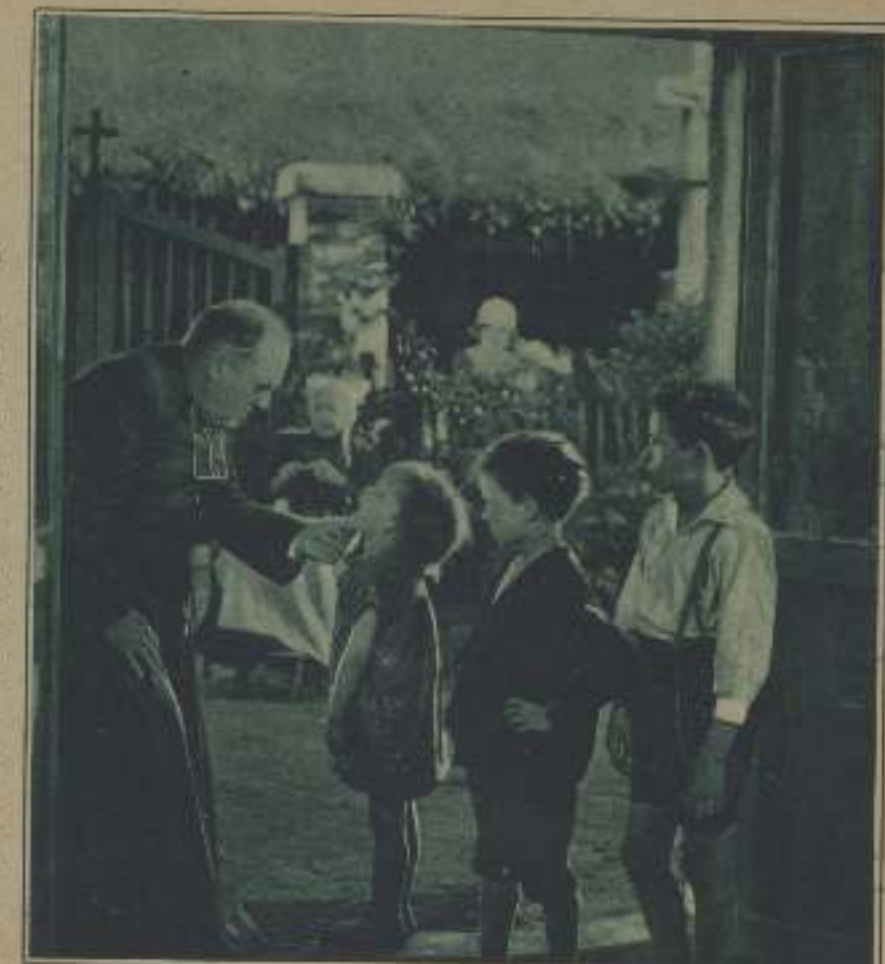
UNA SINTÉTICA ESCENA DE 'LA TRAVERSÉE DIVINE', EL FILM DE QUE ES AUTOR Y REALIZADOR JULIEN DUVIVIER, Y QUE ESTÁ EN VÍAS DE EJECUCIÓN ACTUALMENTE