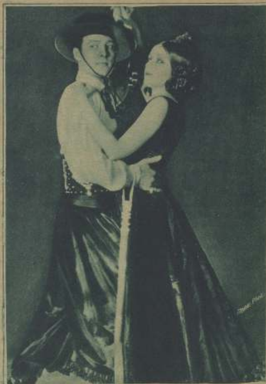
EN «LOS CUATRO JUEVES DEL APOCALIPSIS», SU PRIMER ÉXITO

Los años transcurrieron desde su muerte y el mundo todavía le recuerda y le adora como si no hubiera dejado de existir. Constantemente, en todos los cineas del mundo, se exhiben las cintas del "astro" que no halló, hasta ahora, rival ni sucesor, y a ellos acuden sus enamoradas de todas las razas para rendir a su ídolo—ante el milagro de la pantalla que desucita a las muertas y nos las pone frente a la imaginación vivos y palpantes de realidad—al homenaje ferviente de su impercible admiración. Jamás existió un hombre tan universalmente