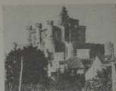
El Castillo de Tordesillas

La verdadera película española, esa película que aún nos falta por hacer, no lo será precisamente porque tiene un argumento ricamente español; a tal efecto el asunto no importa