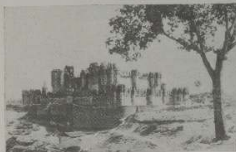
Castillo de Compe

Todo cuanto decimos de los panoramas y de estos motivos de riqueza arquitectónica y monumental, lo podemos afirmar igualmente de nuestra música, de nuestras costumbres, de todo cuanto renueva nuestra personalidad tan ricamente definida y afirmada en nuestro suelo.