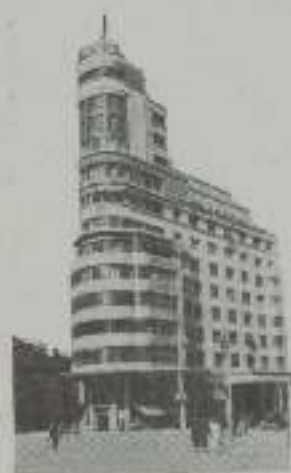
testamentaria su gratitud al realizador de este edificio.

En mérito al esfuerzo que ha significado el haber construido en la Gran Vía el sumptuoso edificio, que, como bien dice el Comité mencionado, para organizar el comercio cinematográfico en sus propietarios, don Enrique Carrión, "constituye un legítimo orgullo para la capital de España, y en la casa, sala de honor nacional del cineasta", tendrá lugar el próximo domingo el trecenta y tres festival en que el pueblo de Madrid