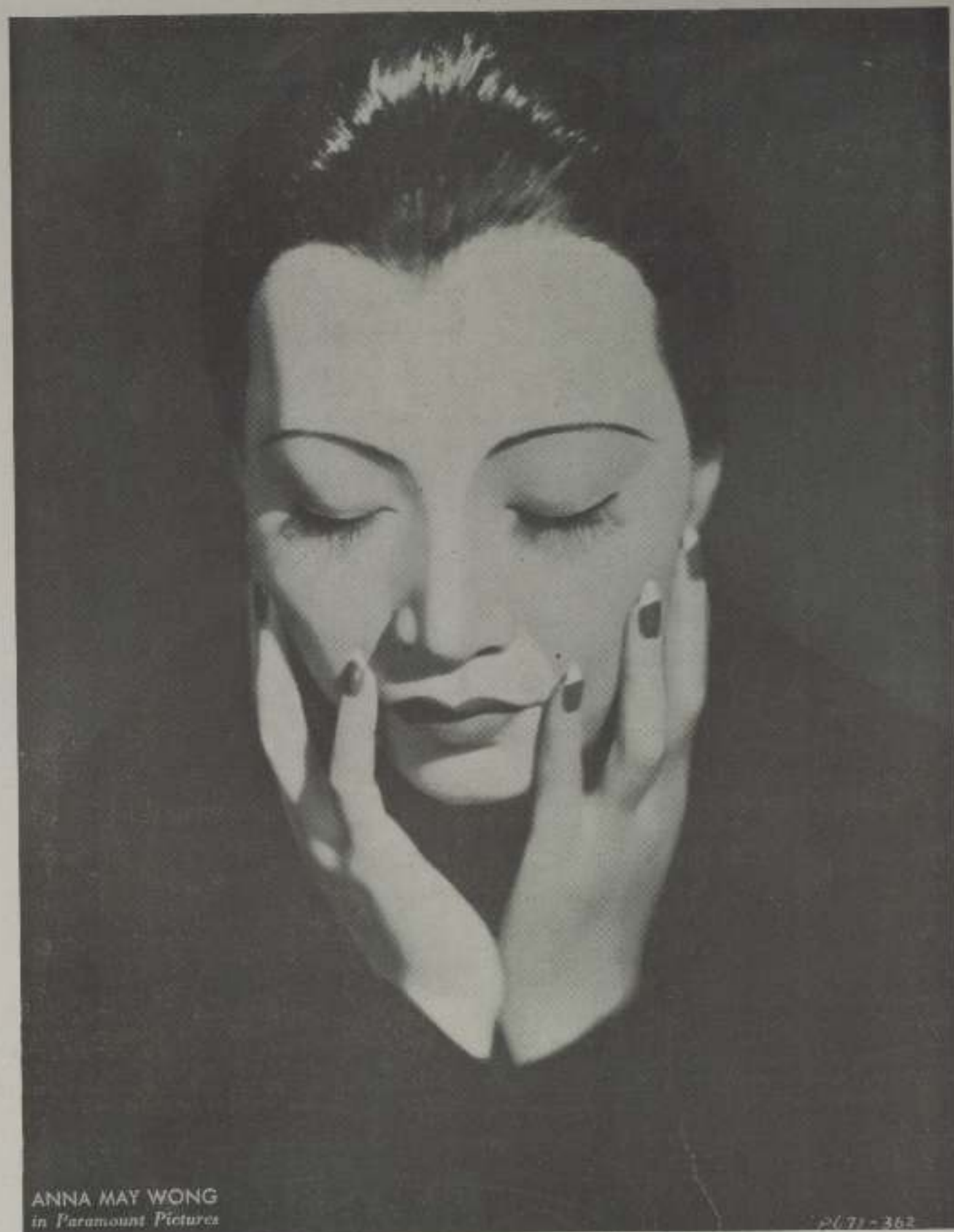
ANNA MAY WONG in Paramount Pictures