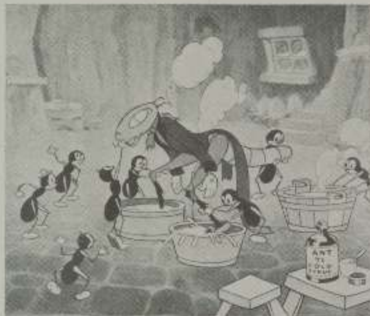
"La cigarrera y la hormiga"

cierto número de "estrellas", cuya presencia quedó relegada luego ocultándola tras impenetrables maderas. Un fracaso rotundo fue el salto de esta misma experiencia don de se pasó de maderas al desconocimiento de toda clase de público, ya que a ninguno, estuviere consti-