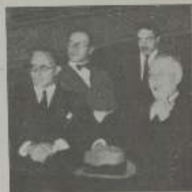
Aquí la película donde se está pensando una acción política de dibujos, el ilustre cinematógrafo se da con la legítima satisfacción de su vida.

—Qué, en vista, la literatura... Un gran poema.