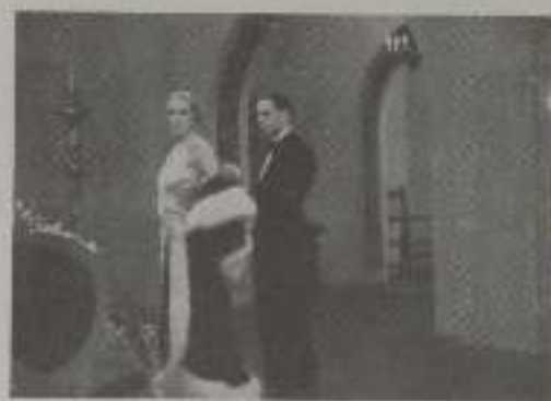
Una de las escenas de esta producción española que próximamente presentará "Atlantic Film"

La cinta está impresionada en los estudios Orpheus.