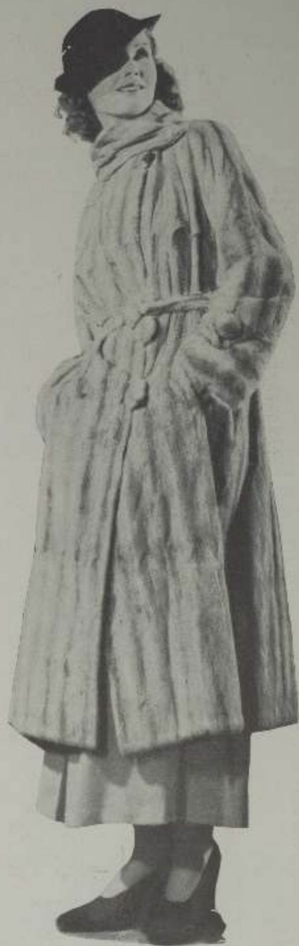
Elizabeth Allen, la elegantísima y bella "estrella" de Metro-Goldwyn-Mayer, luce un magnífico abrigo de piel, cuyo cuello, que se abraza en forma caprichosa, resguarda amablemente contra los rigores del frío.

El cine ha penetrado en todos los rincones de la tierra con su atractivo dramático de carácter universal. En nuestra vida moderna, compleja e intensa, la diversión que nos aporta el cine es ya indispensable. Conviene, pues, que unamos nuestros esfuerzos para que la pantalla no refleje sino verdaderos valores sociales y morales.