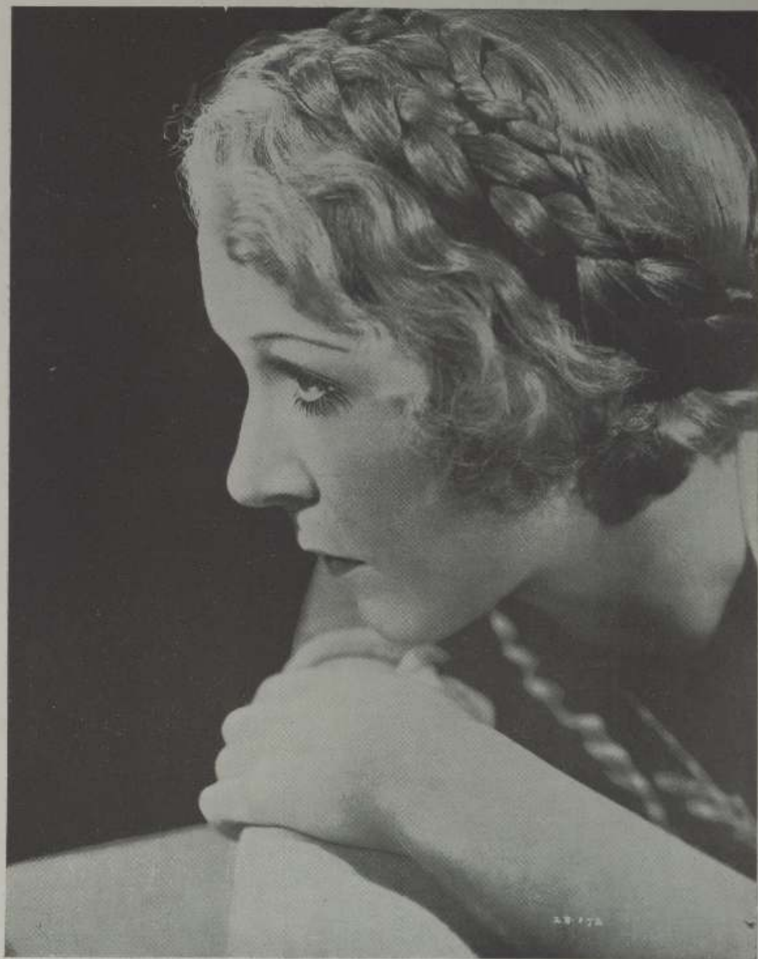
V ERA Cornell, una de las más bellas estrellas "bob" de la Gammont-British