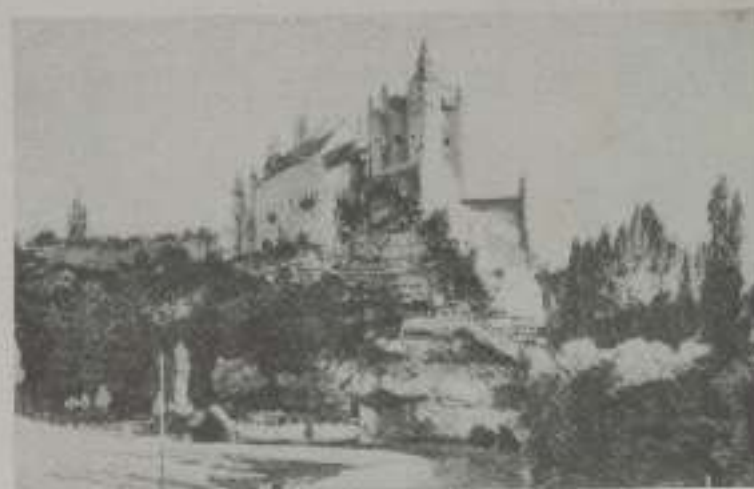
El Alcazar de Segovia

go, tales castillos constituyen en protección un alarde de vir-