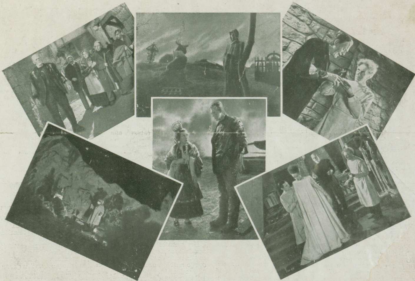
Diversas escenas del último éxito de KARLOFF: "LA NOVIA DE FRANKENSTEIN" que en su tercera semana ha abarrotado nuestro Cinema Capitol de Barcelona.

Al final de la representación el público aplaudió dicha película. Es de esperar, pues, que el cinema Cataluña se vea concurrido. El film lo merece y es digno de figurar largo tiempo en el cartel.