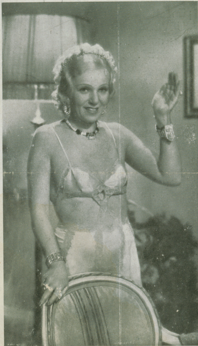
GITTA ALPAR, la incomparable estrella de "EL BAILE DEL SAVOY" uno de los éxitos mayores del año.

dad, traicionado dos veces por un político sin escrúpulos. Un grito pacifista lírico y práctico. El film, como obra de tesis, que ha de ahondar en los pensamientos, y por su carácter de narración, ofrece a cada paso un bello pensamiento, matiz o detalle digno de tenerse en cuenta, que prende en el ánimo del espectador. Esta trama, fijada casi del principio al fin en una confesión, ha encontrado en el director Edward Ludwig un animador dotado de la suficiente perspicacia cinematográfica para ir escenificando la acción explicada, dando forma plástica a las palabras a través de decorados diversos y planos continuados, que le sirven para reflejar con pristina claridad el alma y sentimientos de los personajes. Hay algunas escenas como el asesinato del político, enfocadas con una originalidad y valentía técnica que llevan la emoción al paroxismo. En esta emoción de