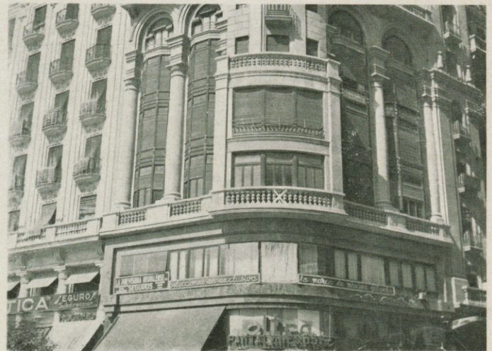
En el piso principal de este edificio, se han instalado nuestras Oficinas de Valencia, calle Cotanda, 4, en la misma esquina recayente a la Plaza de Emilio Castelar

Cabe destacar que los colores no, son iguales que los utilizados por Walt Disney. Mientras éste usa un colorido a manera de cromó, de estampa, y hace jugar mucho el amarillo, los dibujantes de la Columbia emplean unos tonos más vivos, más destacados, con la ausencia absoluta del color amarillo.