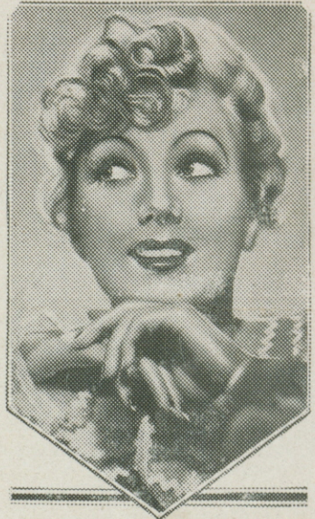
Nuestra excelsa estrella Grace Moore protagonista de "UNA NOCHE DE AMOR"