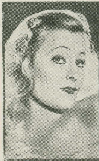
La notable estrella Lilian Harvey protagonista de nuestra excelente producción "VIVAMOS ESTA NOCHE"

No anotamos este dato en son de censura sino que lo aprovechamos para hacer resaltar el valor que concede la competencia a Grace Moore. Ello también entraña explícitamente el reconocimiento del éxito obtenido por Columbia en "Una Noche de Amor" y "Quiéreme Siempre".