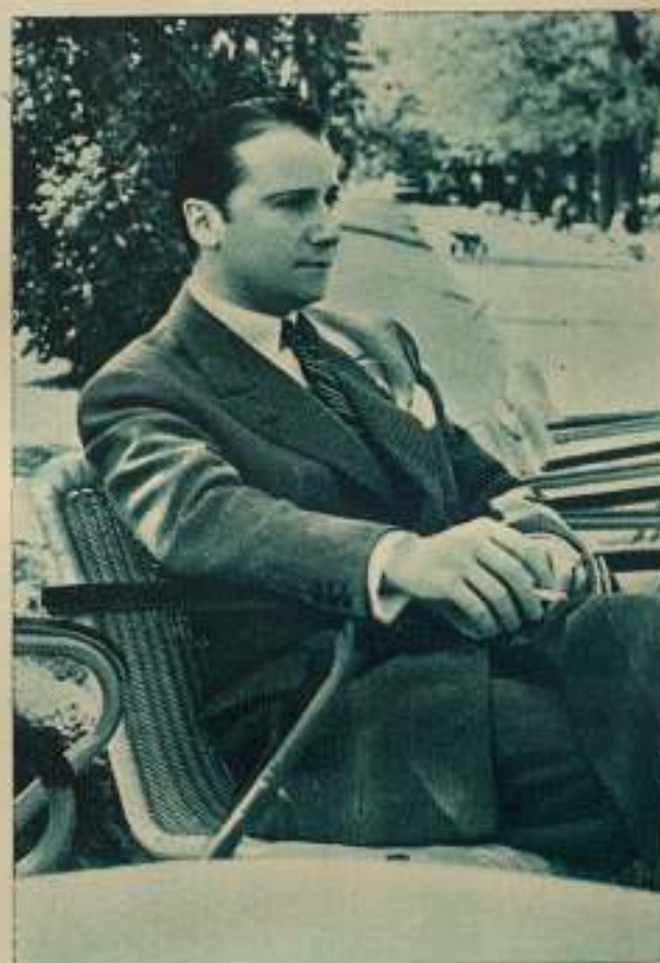
3 Qué bien se está al sol, lejos de admiradores oportunos...

—Ser marino de guerra. Pero mi familia me quería ingeniero. Estudié el Bachillerato e ingresé en la Escuela de Ingenieros de Caminos. Pero ni mis padres ni yo logramos nuestros propósitos.