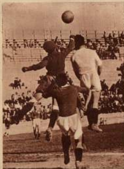
Una jugada del partido celebrado en Mestalla entre el CIFESA C. D. y el Valencia.

Como anunciamos a nuestros lectores, a principios de temporada se constituyó el «Cifesa Club Deportivo», sobre la base del desaparecido «Informaciones», Club de primera categoría regional que nos había cedido sus derechos y jugadores.