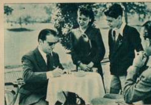
4 ...si éstos no llegaron a solicitar el inevitable autógrafo.

—¿Y... contento de lo que llevas ya rodado?