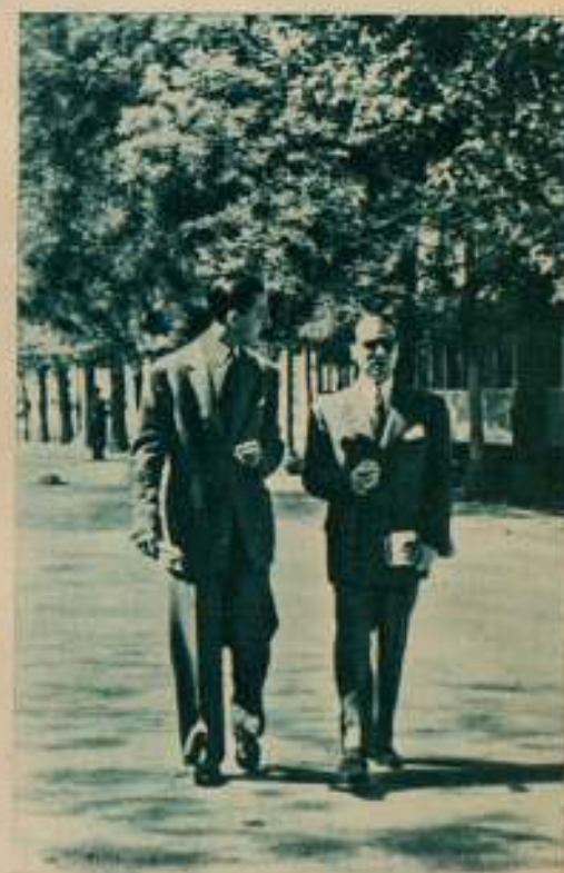
5 Vuelta para el hotel, enfusado en la conversación, con las gafas coladas en un "camouflage" imperfecto.