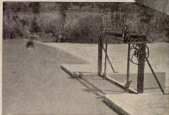
«Aguas potables», por Almela y Vives