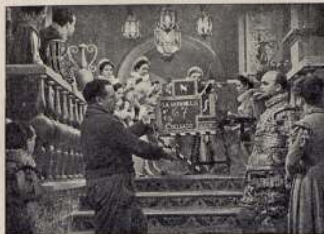
Con la ayuda del «playback» se toma esta escena para «La Gitanilla».

Se hace un detenidísimo estudio del ambiente; se eligen las canciones y bailes que más encajen con la situación y momentos de la película. Con el mismo cuidado hay que proceder para la elección de artistas y voces de los mismos, labor que suele dar hecha la Dirección, y una vez todos los elementos reunidos, se emplean los ensayos, para dar lugar, más tarde, a la toma de sonido, conocida