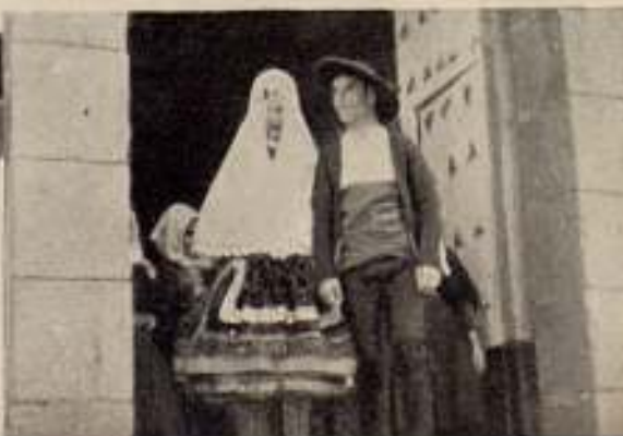
«Boda en el pueblo», por Emilio J. Villén