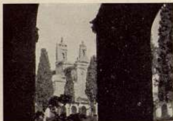
«Jerez, joya de Andalucía», por Manuel Viola