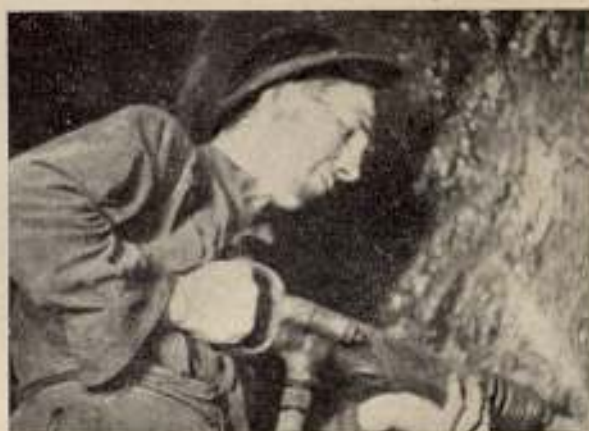
«Minas y mineros», por Ruiz-Castillo