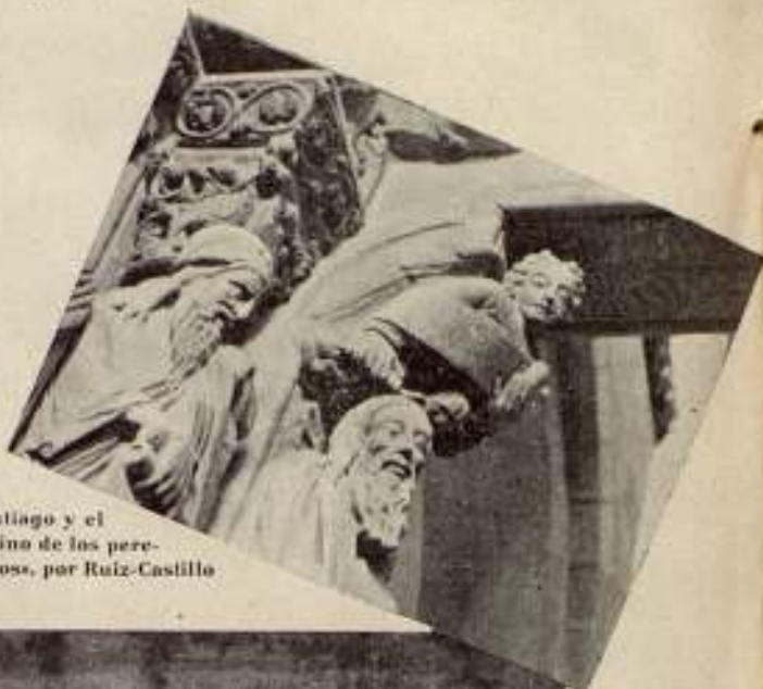
«Santiago y el camino de los peregrinos», por Ruiz-Castillo