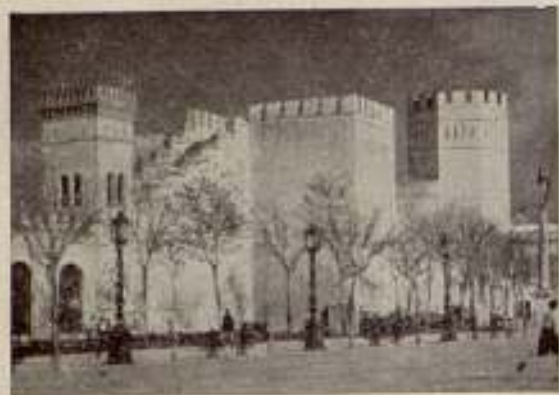
«Jerez, joya de Andalucía», por Manuel Viola