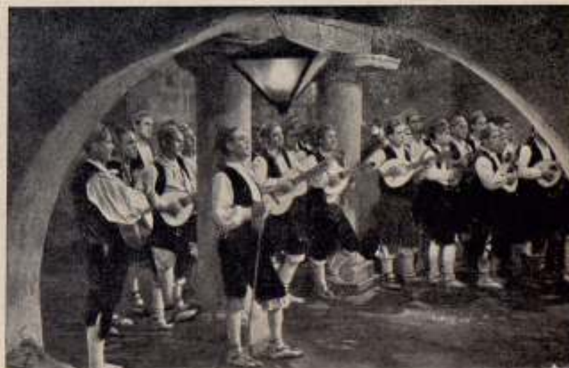
La rondalla, después de bien ensayada, impresiona la música directamente al momento de rodar la imagen.

—Mire usted —nos responden nuestros artistas—, los incidentes, cómicos, por fortuna, se suceden con tal abundancia que se puede decir que durante nuestro trabajo vivimos en un continuado chascarrillo. Le contaremos lo más reciente. Hace unos momentos habrá usted visto salir de este despacho a una señora acompañando a un niño de unos diez años, que hace un rato parecía que le estábamos maltratando. Pues bien; esa criatura es el último vástago de una lírica familia, cuyos miembros han desfilado en su totalidad por aquí. A todos ha habido que probarles la voz. Primero fueron los papás; luego la hermanita mayor; a continuación otro hermano, ya crecido, y el último ha sido el que acaba de marchar. El amigo que nos recomendó únicamente al padre, nos ha dicho que ya no quedan más individuos de esa honorable célula social con aficiones al canto. Hemos respirado, aunque todavía les esperamos con el canario, que será, a no dudarlo, el único de la casa que tenga condiciones.