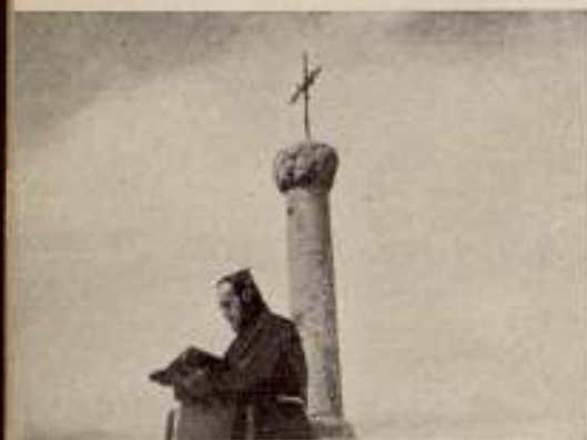
«Guadalupe», por Emilio J. Villén