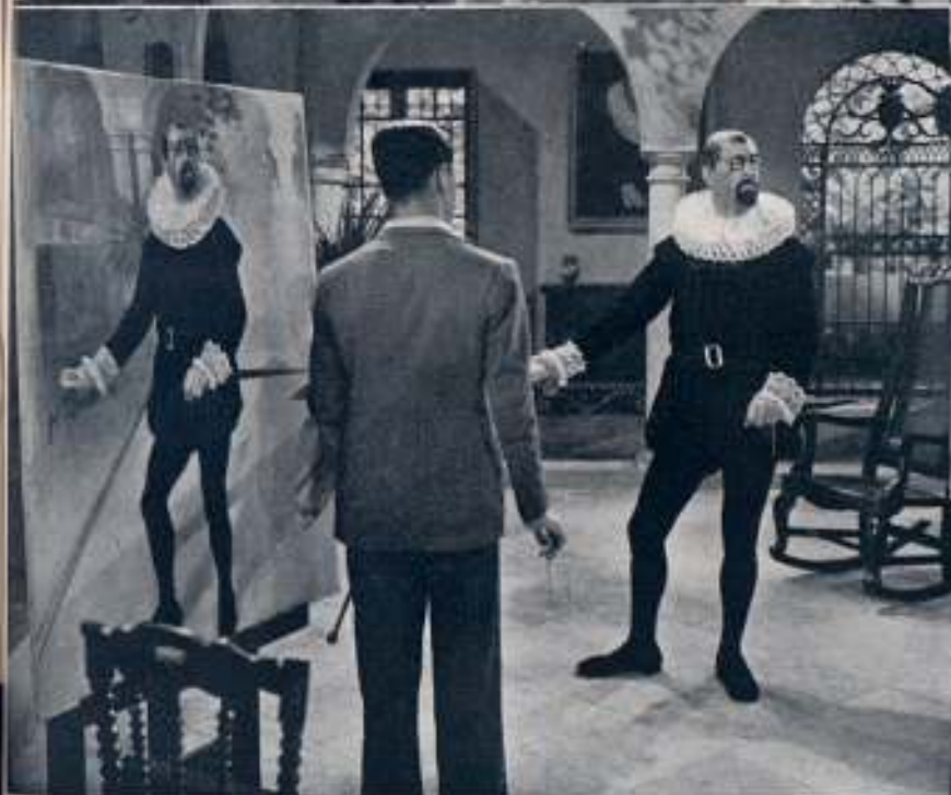
«Poses» de antiguo caballero amante del tradicional sentir y vestir junto al sonreír y vivir moderno que pone en el rostro la alegría de una vida más fácil...