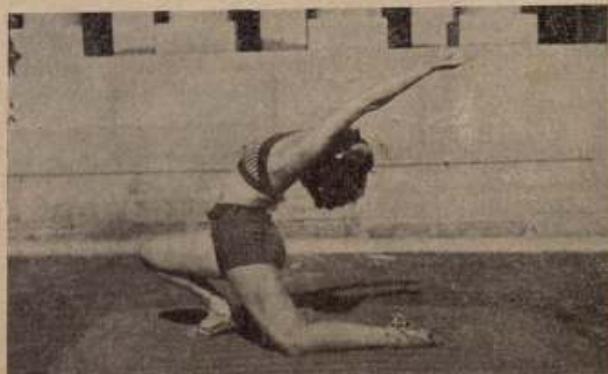
ADELGAZAR SIN DEBILITARSE