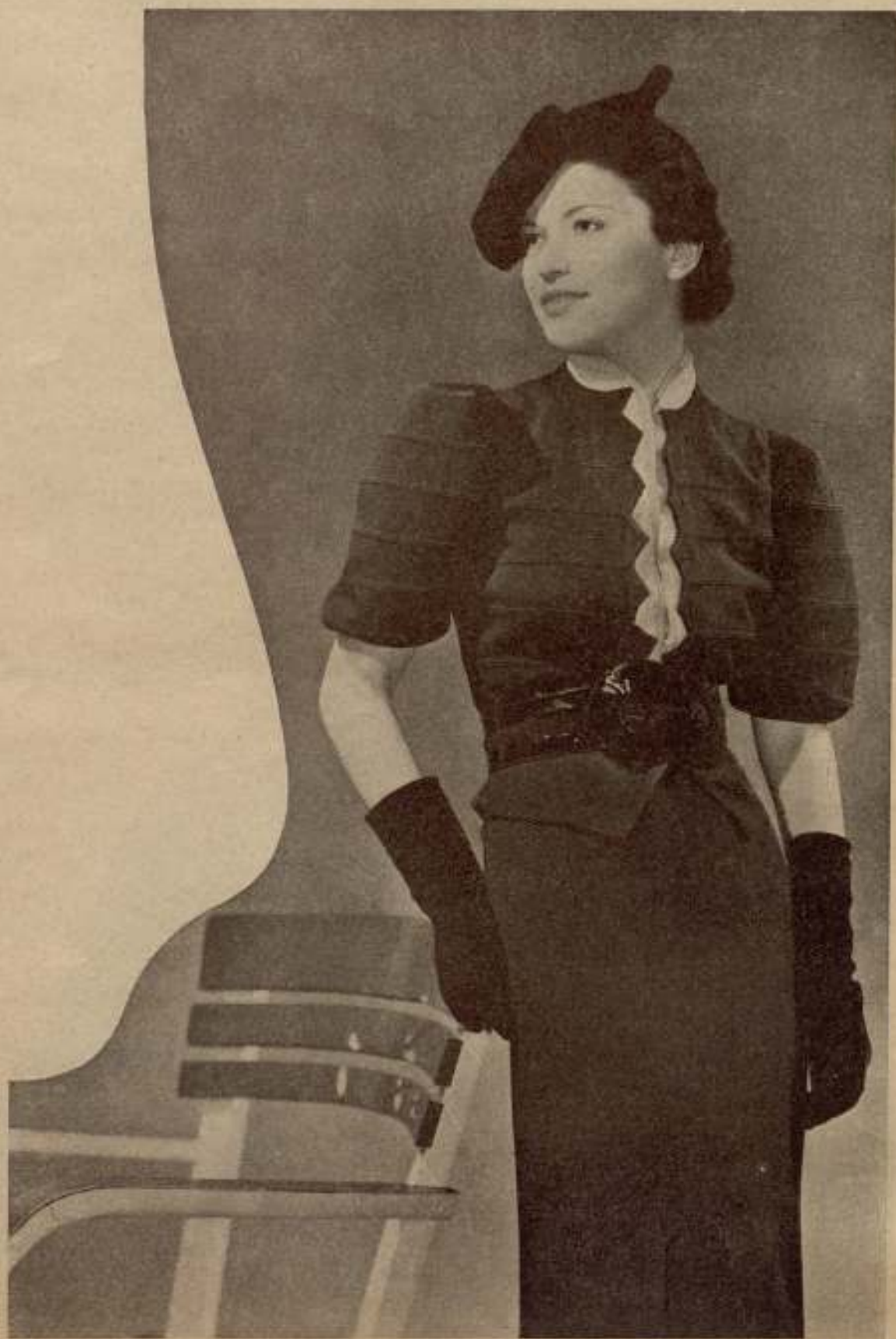
MODELO HEIM. — Conjunto de tarde de lana-marrón. Blusa plisada