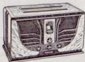
T. S. H.