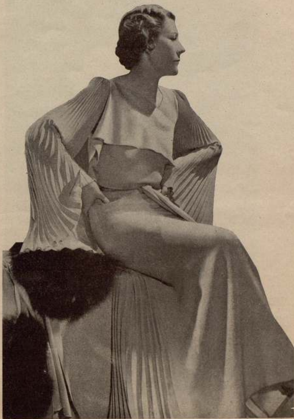
MODELO CALLOT. — Vestido de noche, de satén de dos caras, blanco, mangas y pieza de detrás totalmente plisadas