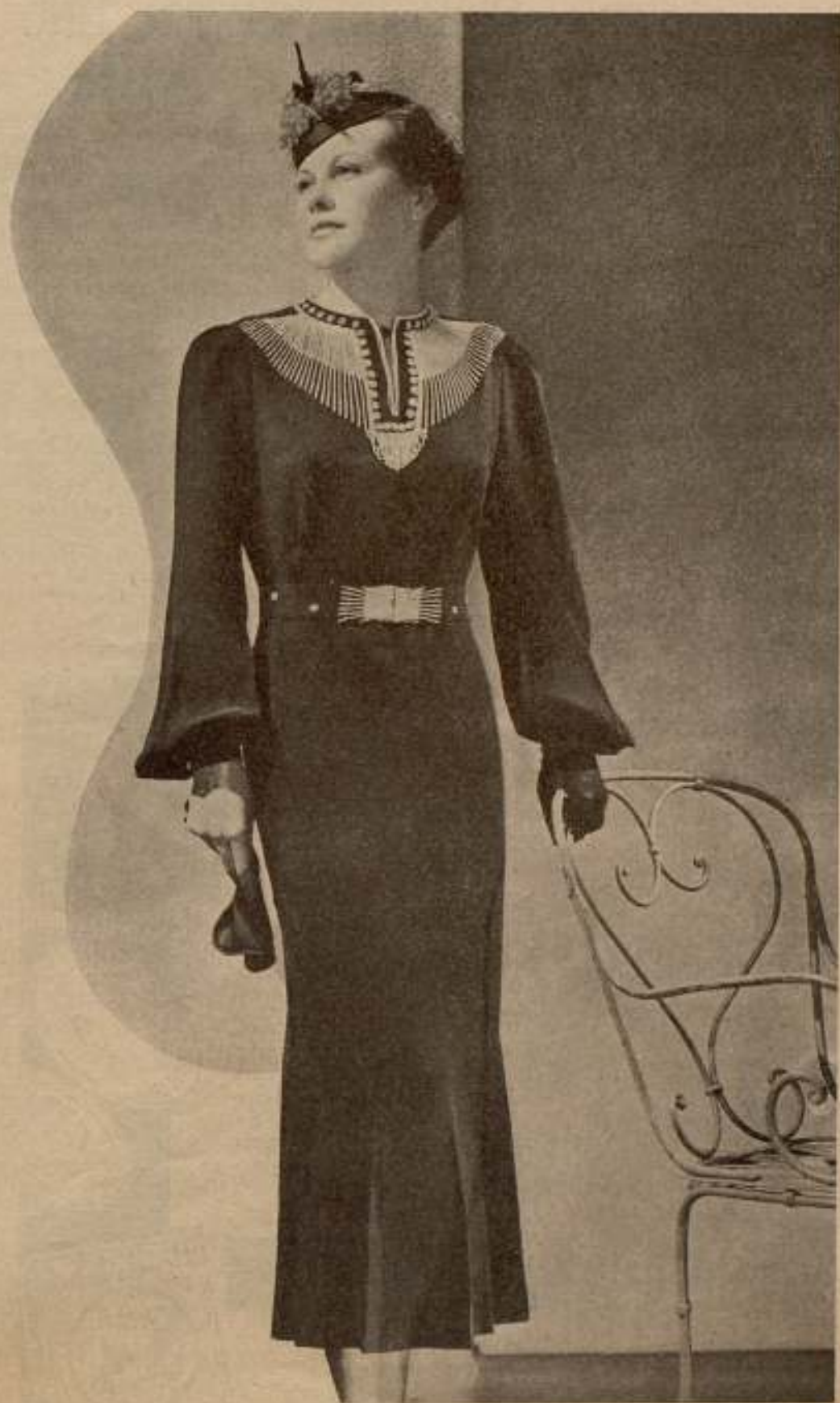
MODELO PATOU. — Vestido de tarde, de seda negra, adornado e m soutache blanco