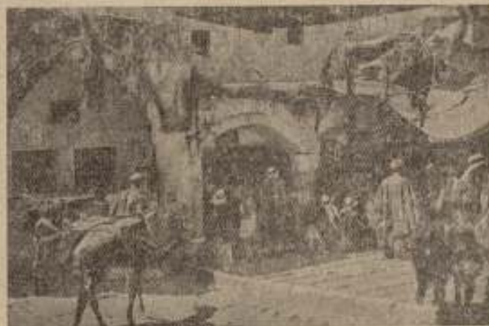
Una calle de Jerusalén

Por la tarde excursión a Belén, la ciudad