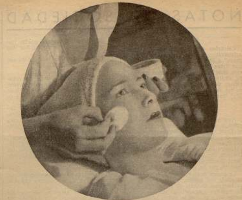
Salón de Belleza Antoine de París en Barcelona Perfumería Ordóñez, Rambla Cataluña, 103

La fábrica de Aubervilliers produce 1.500 artículos diferentes. La maquinaria de la jabonería tiene una capacidad de producción de 65 toneladas de jabones. Los talleres para polvos entregan cada día, en ocho horas de trabajo, 10 to-