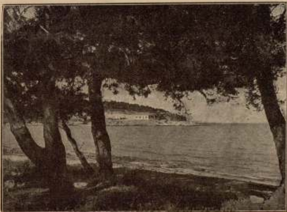
Vista panorámica de la nueva urbanización PALMA-NOVA

Es de todos sabida la admiración que las más destacadas figuras del Arte y de la Literatura mundiales, han sentido por Mallorca. Por citar de ellas sólo algunas, recordemos al exquisito Musset, al maravilloso Chopin, a la distinguida George Sand, a nuestro llorado Rusiñol.