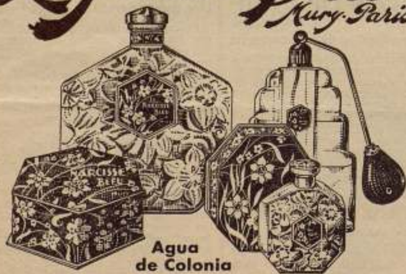
Agua de Colonia

Extracto - Polvos - Loción (frasco con vaporizador móvil, novedad)