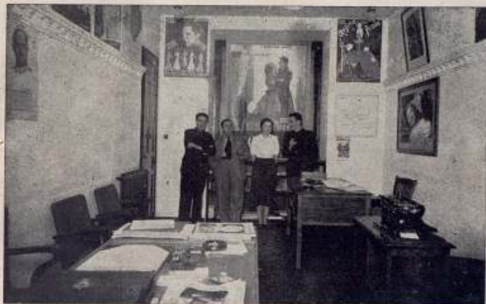
Una de las dependencias de nuestra Sucursal en Sevilla, Federico de Castro n.º 11.

Esta labor es actualmente mucho más meritoria, teniendo en cuenta que en razón de las circunstancias presentes, figuran provisionalmente adscritas a la Zona Andalucía, grandes fragmentos de la Región Centro, siendo por consiguiente abrumador el trabajo, y las atenciones que debe cumplimentar esta Sucursal. Es digno de todo elogio, el apoyo prestado por la Empresa del Pathé Cinema de Sevilla, en cuyo magnifico teatro se han estrenado ya casi todas las producciones que componen el Primer lote de las exclusivas Balet y Blay, siempre con éxito creciente.