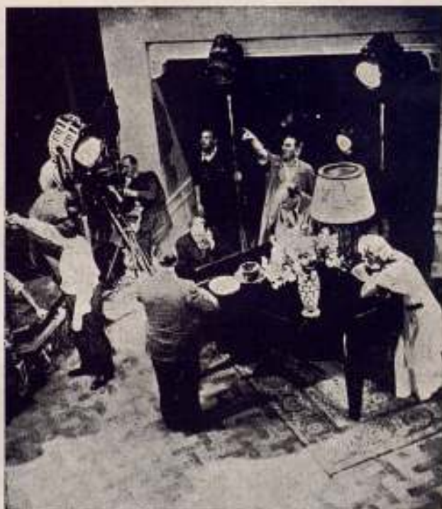
Escenas obtenidas durante la filmación de la gran producción «La Estrella del Mar» de Imperator Film.