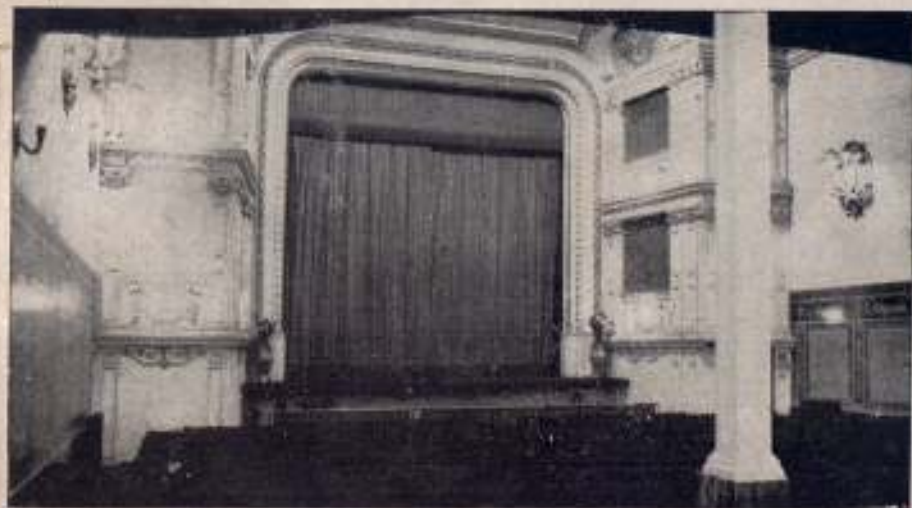
El suntuoso teatro «Pathé Cinema» en Sevilla que retiene las exclusivas Balet y Blay.