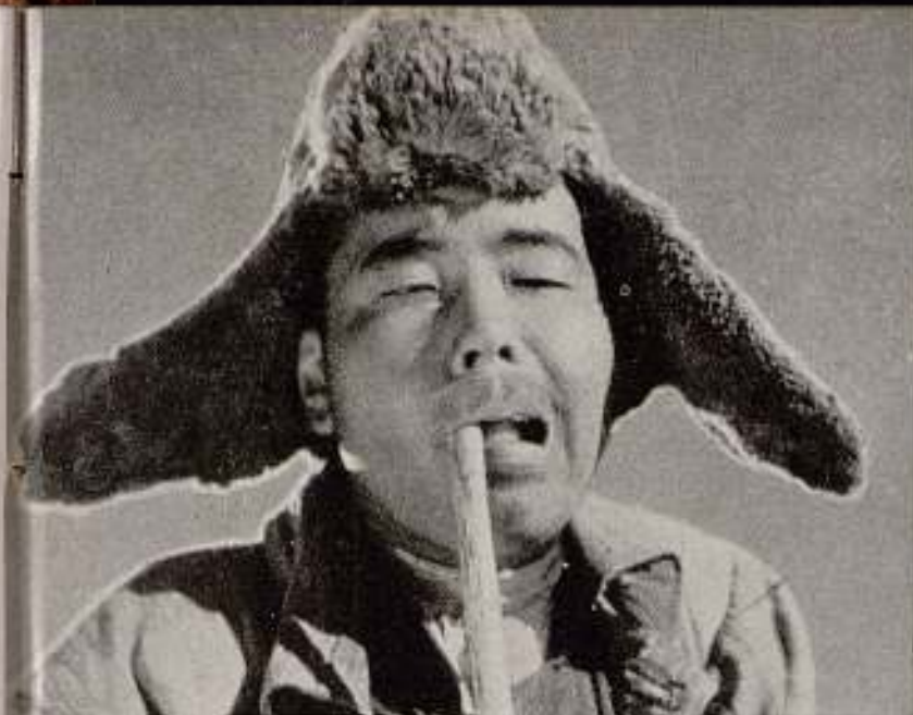
«Komsomol», de Joris Ivens.

cha como final de su obra. Sin embargo, no hay banquetes ni discursos inútiles. Por la noche, se celebra una gran manifestación y un gran mitin, en el que participan todos los trabajadores. Esto fue todo. Y, no obstante, cuando, unos meses más tarde, los komsomols de Moscú pudieron comprobar a través del film de Ivens el esfuerzo de sus camaradas, exclamaron unánimemente: «También nosotros queremos ir a trabajar a Magnitogorsk».