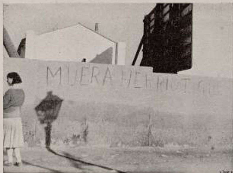
Actualidades españolas no vistas en el cinema. Algo distinto a lo que nos ofrecieron las actualidades cinematográficas durante la visita de Herriot a España.

contemporánea, todo cuanto el despierto cerebro del hombre se acapara asimismo y se encuentra desde sus principios en el sangrante del capitalismo, y, ¿cómo no habría de hallarse en las ciencias, el arte llamado «séptimo» con que se encabeza y a las líneas? Pero he aquí un inciso necesario y propio acerca.