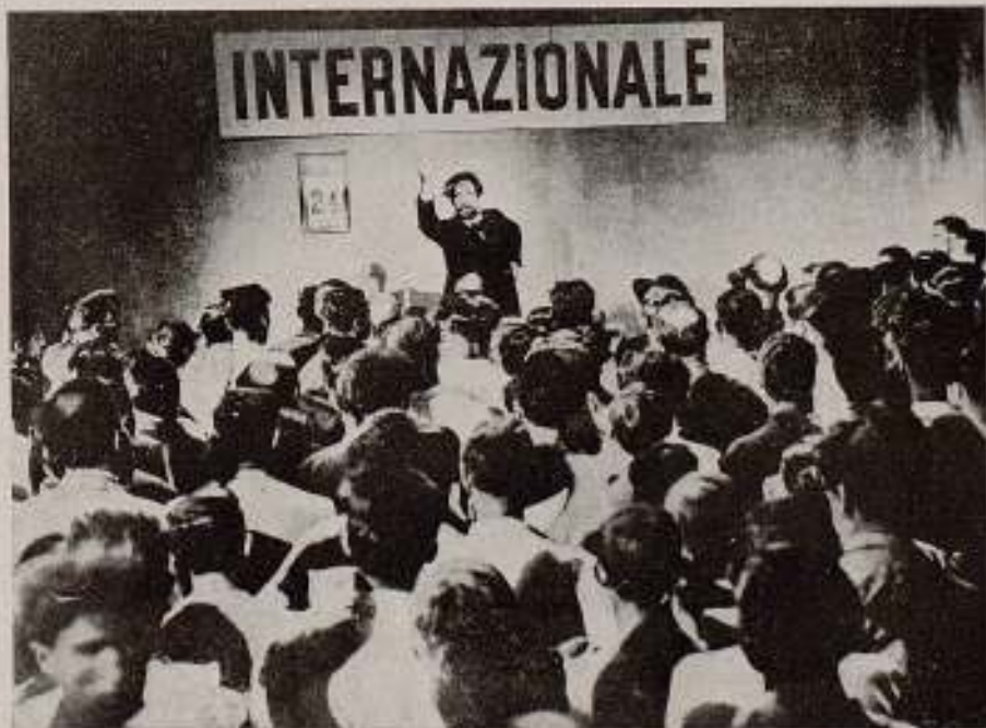
«Camicia Nera», film fascista de G. Forzano.

(*) Esto no impide que nuestro joven fascista González Ruano, escriba en el A B C una de sus crónicas berlinesas y, demostrando su gran desconocimiento (o su lacayunismo jesuítico) de la historia y del cinema, diga que Camicia Nera es un film superior a El Acorazado Potemkin . Otros periódicos fascizantes ( L'Intransigeant , Le Temps , Comœdia , Paris-Sport , L'Aube y algunos corporativos) han elogiado también este film fascista, sin olvidar la prensa italiana. Sin embargo, nos interesa destacar el hecho de que un periódico de tipo «independiente de vanguardia» como Filmliga , de Holanda, publique un artículo firmado por A. N. Zadoks-Josephus Jitta, auténticamente inoble. (Nota de la Redacción.)