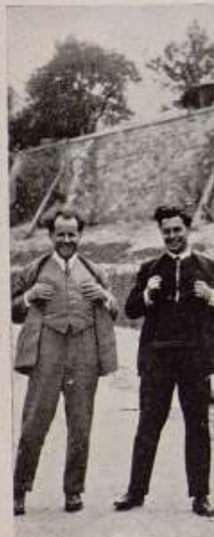
S. M. Eisenstein y Joris Ivens en U. R. S. S.

Por consiguiente, ellos comenzaron a hacer avances a las Compañías productoras de Hollywood, y trataron por todos los medios de vender en trozos las vis-