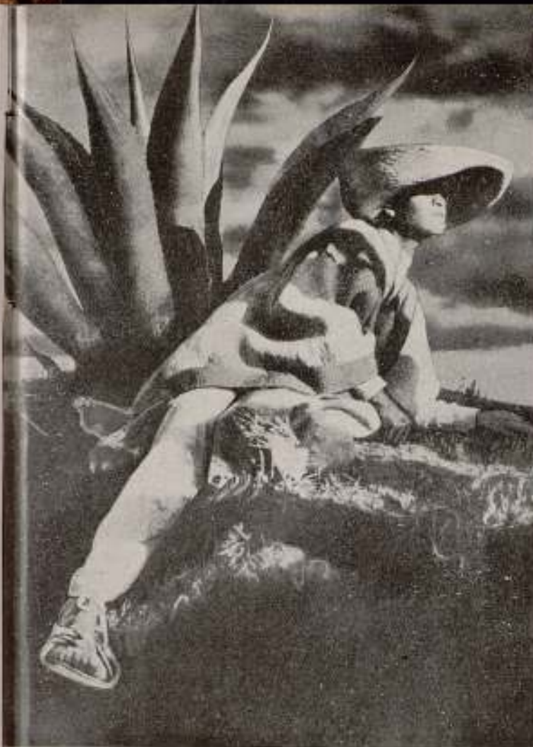
«¡Viva México!», de S. M. Eisenstein

situación económica puede justificar ese crimen de lesa Estética.» (Waldo Frank en una carta a «Experimental Cinema».)