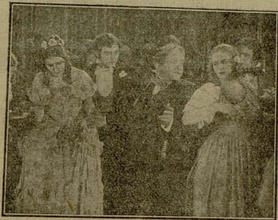
Barbemuche, al hacer un movimiento brusco....

El Vizconde presentaba, ufano, á la bella codiciada, á sus amistades en general, y por