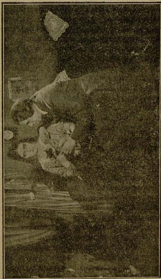
...deleitándose en el roce, hábilmente producido por él...

A la mañana siguiente, Colline y Schaunard tuvieron un terrible despertar después de un sueño más atroz todavía, pues el portero se encargó de despertarlos: