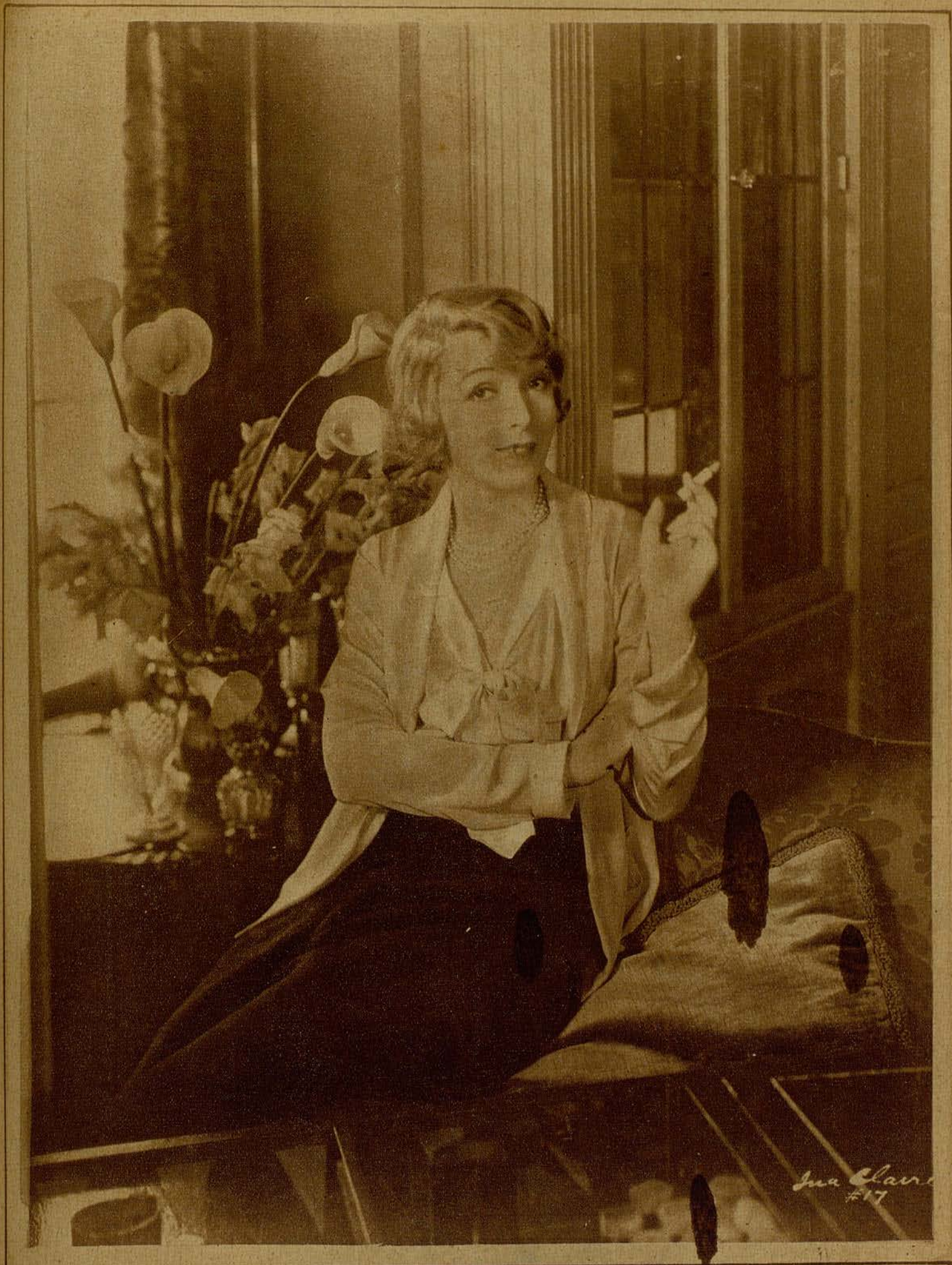
Ina Claire, esposa de John Gilbert, que ha ingresado en los Estudios de los Artistas Asociados