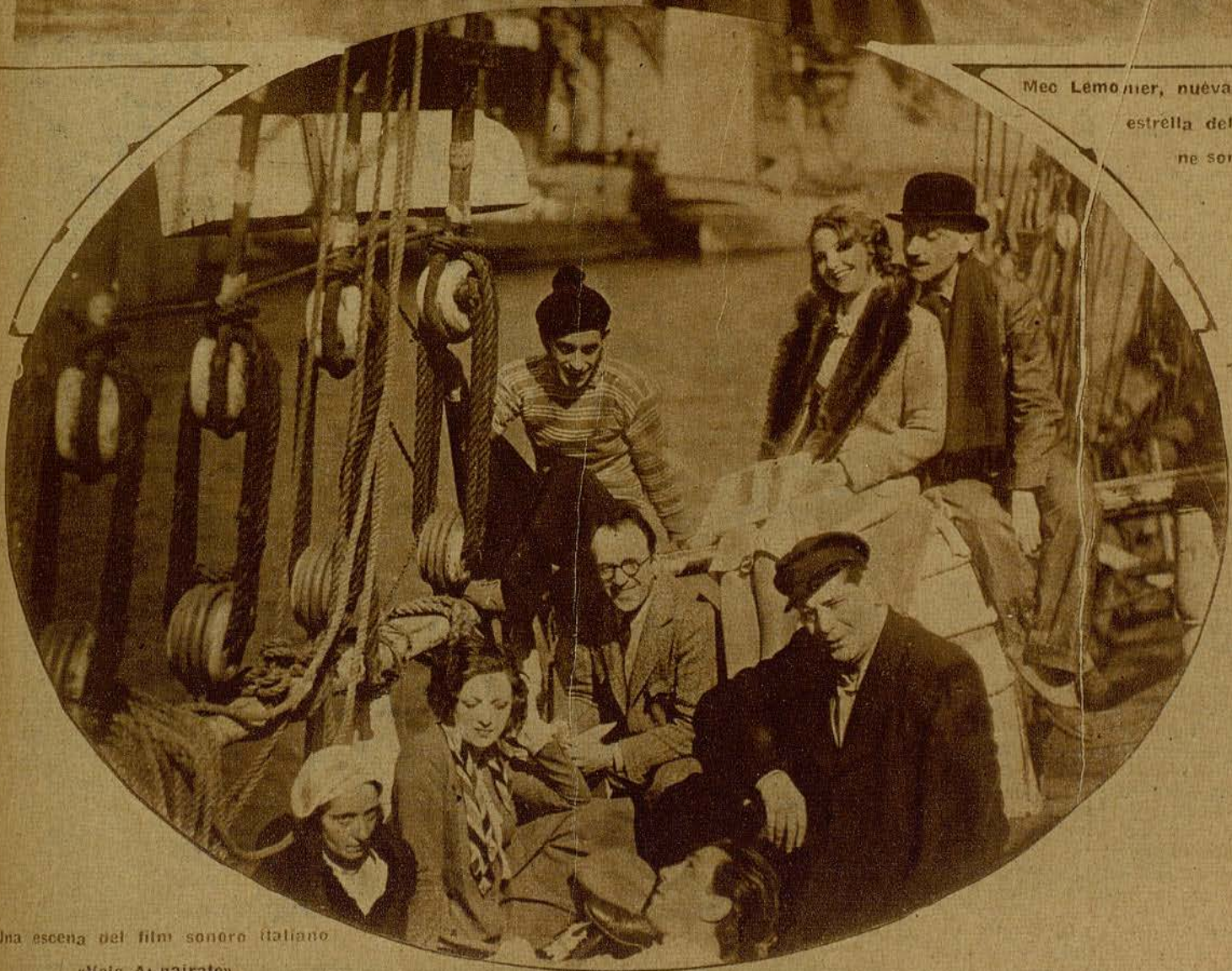
Una escena del film sonoro italiano «Vele ALnairate»