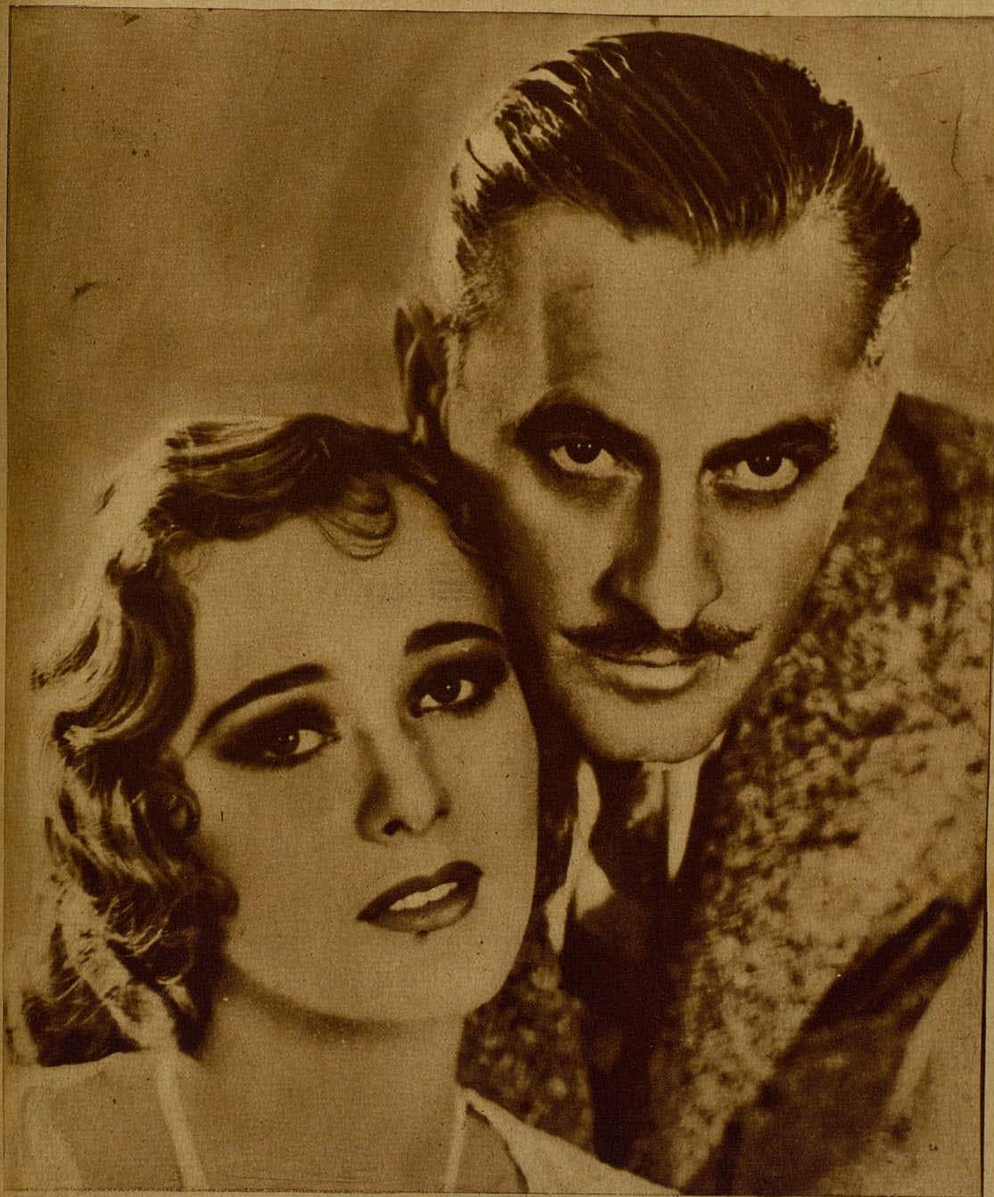
Dolores Costello y John Barrymore, que después de dos años alejados del arte cinematográfico, ingresan de nuevo en el mundo de la pantalla