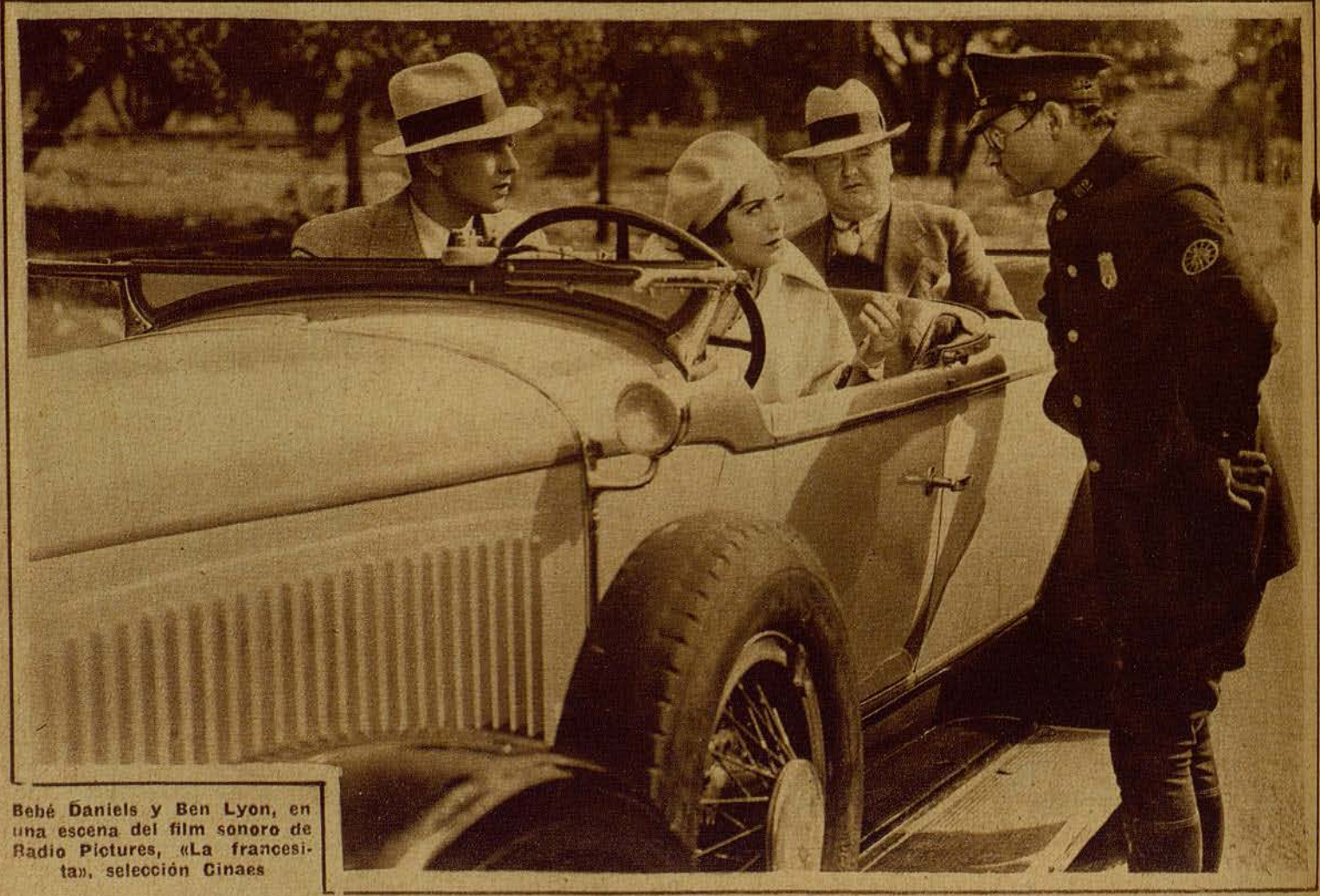
Bebé Daniels y Ben Lyon, en una escena del film sonoro de Radio Pictures, «La francesita», selección Gineas

Si sá Maxu para n ictores la cine ni agri le ha le para raza he primer fuerza llegado que en quiera ya se s designa Recien su inte la gran go de muy p hecho t la enca dera, q asombro enocien facultad clase de se pud realmen Natur que el por tod de la o que ya subito y semanas Paris. E ha hec que, por na de lectores. Antes racter d Maxudia leatro f ce años ble de en cuya cargo d rrió el triumfo, geles du ron a le -Por Maxudia con alg No habi existir gustaba aquellos terrenos vez ofre irrisorio ver en so en bu ra esta peculaci estaba Angeles cuerdo haberme dichosos «Oier maestra nos ape rear el meras, piada Luego jes cons Meca de praron cos por biese se corredor oco me