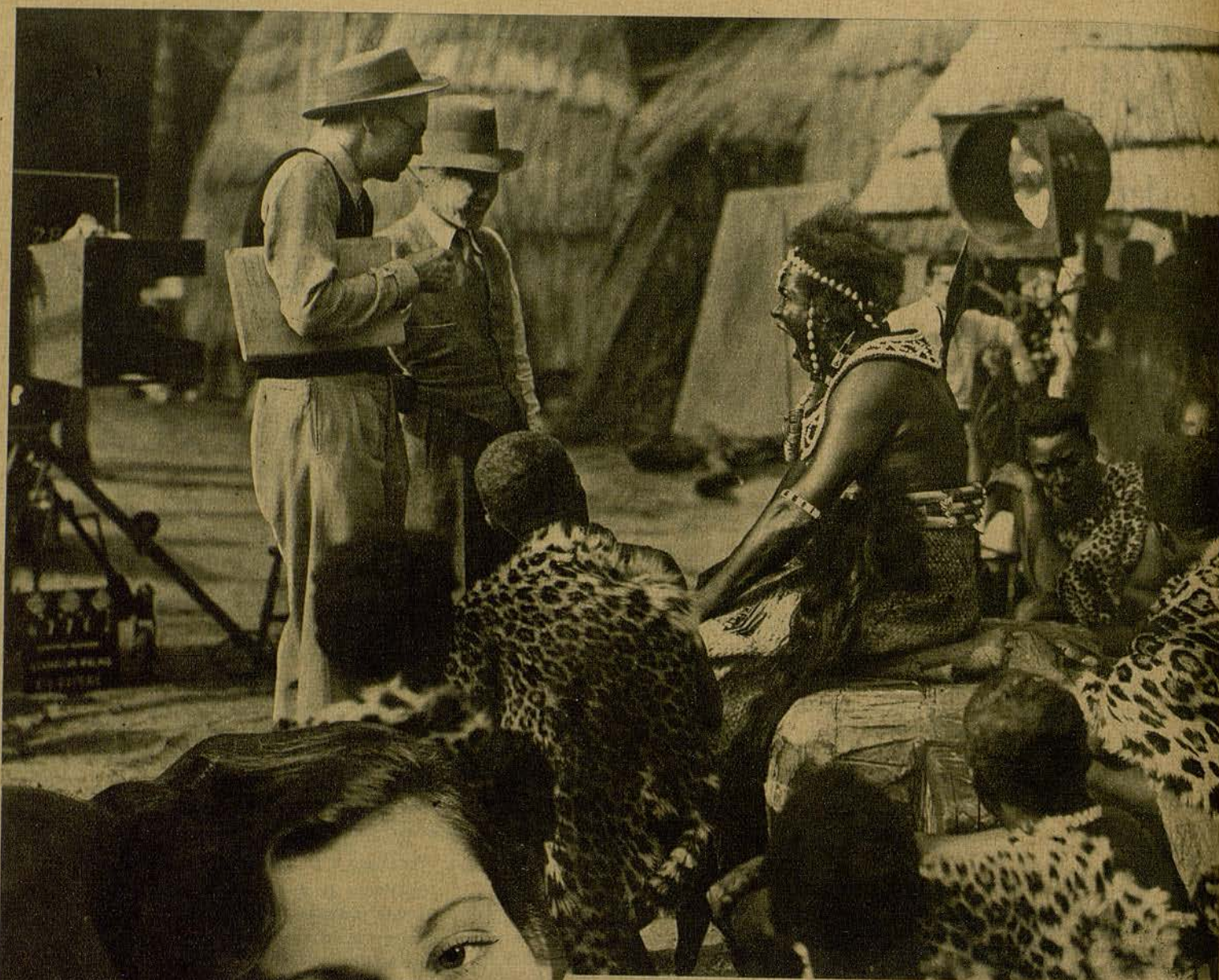
UN DESCANSO EN LA FILMACION DE LA PELICULA "BOZAMBO". EL PRIDER PLANO, ES FRANCES DEE, LA DELICADA ESTRELLA DE LA RADIO