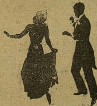
GINGER ROGERS Y FRED ASTAIRE, BAILANDO

escandaloso charleston. Son el alma del país del dólar, y doquier se presentan matizan el ambiente de un marcado acento de modernismo y simpatía, conquistando adeptos insospechados que se sienten subyugados por el dinamismo y la gracia que se desprende del léxico interpretativo de estos dos verdaderos valores del cinema yanqui.