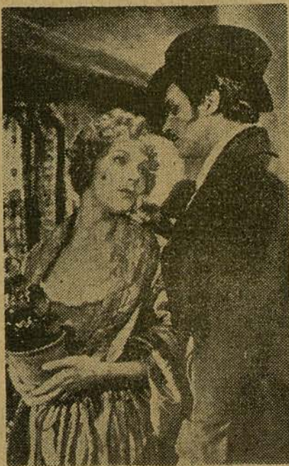
Gertrude Lawrence y Douglas, en una escena de la "Bohème"

Cuando ya la opinión mundial ha acallado su exclamación de asombro ante el divorcio de Joan Crawford y Douglas Fairbanks Jr., el voluble Doug se enamora y se promete en matrimonio con la estrella in-