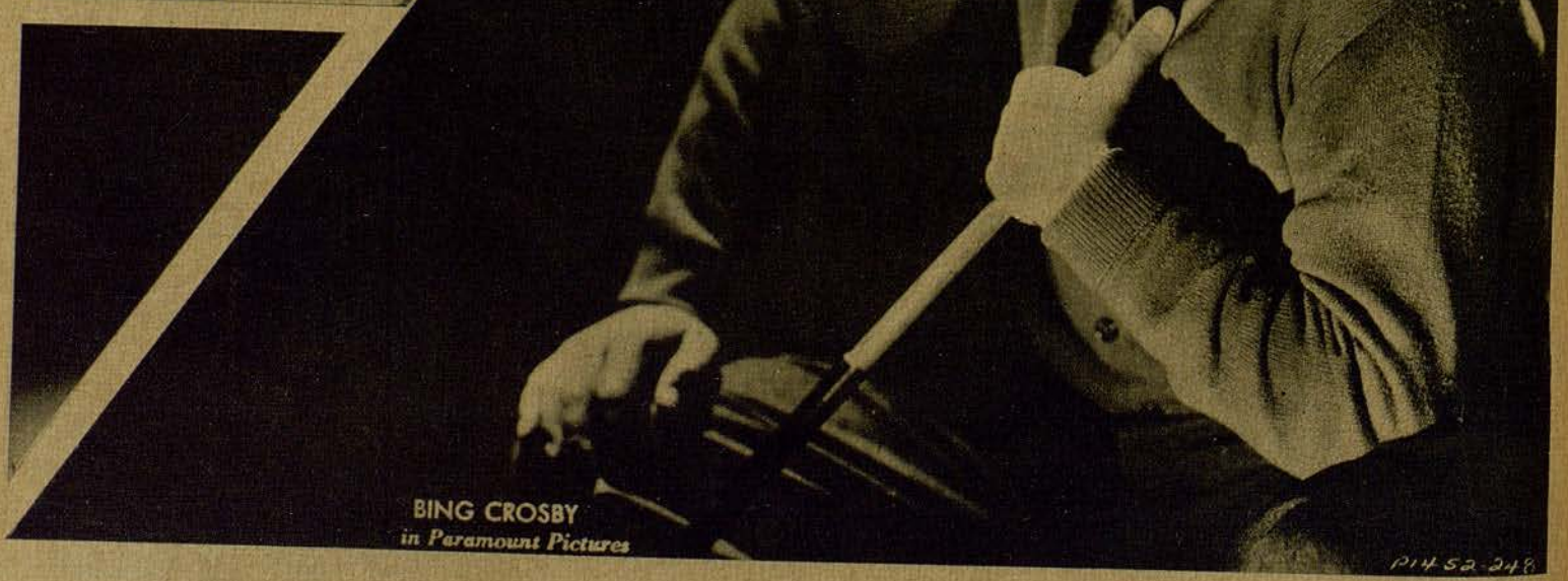
BING CROSBY in Paramount Pictures