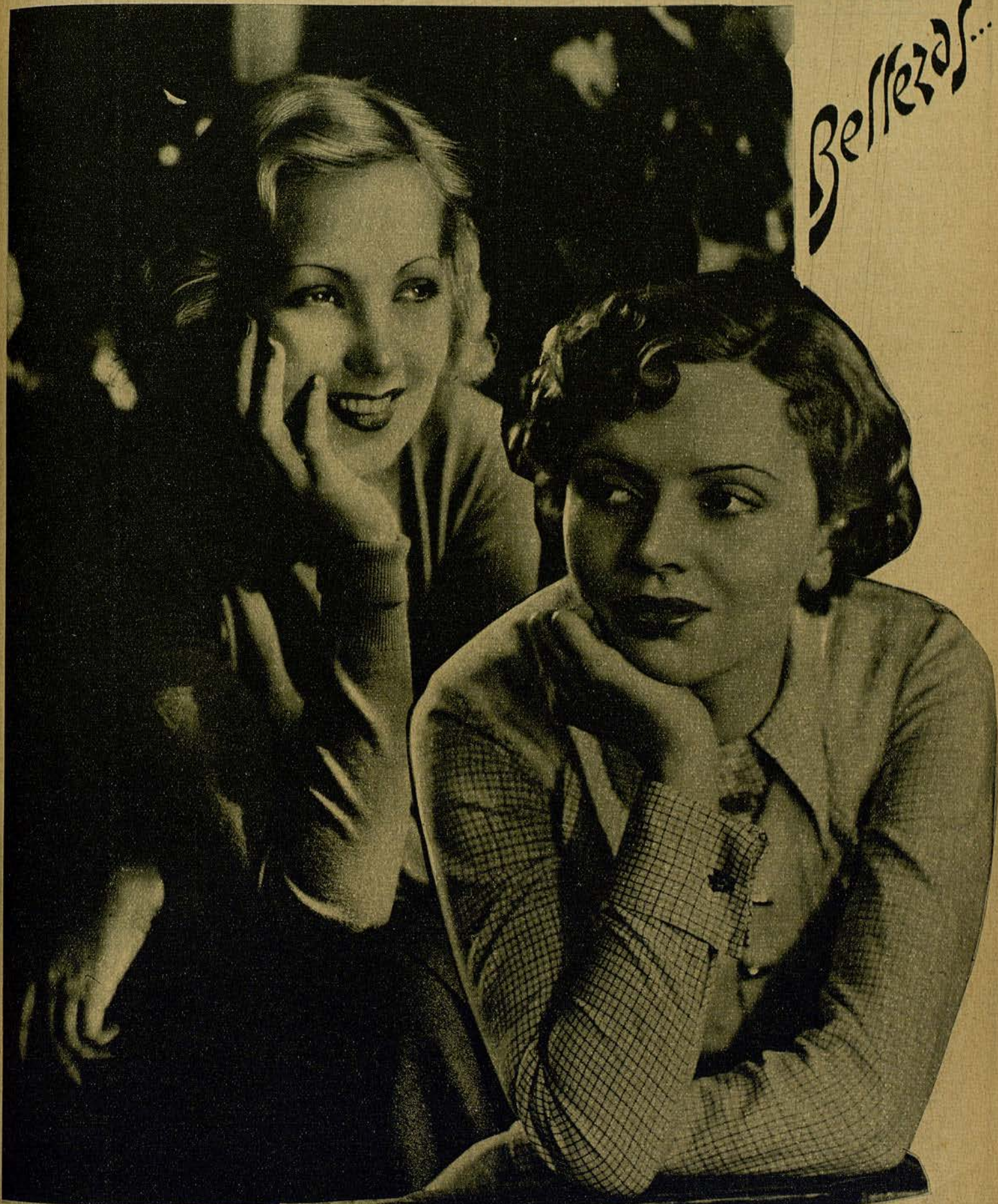
ANN SOTHERN, la exquisita rubia que se reveló en «Es hora de amarnos»