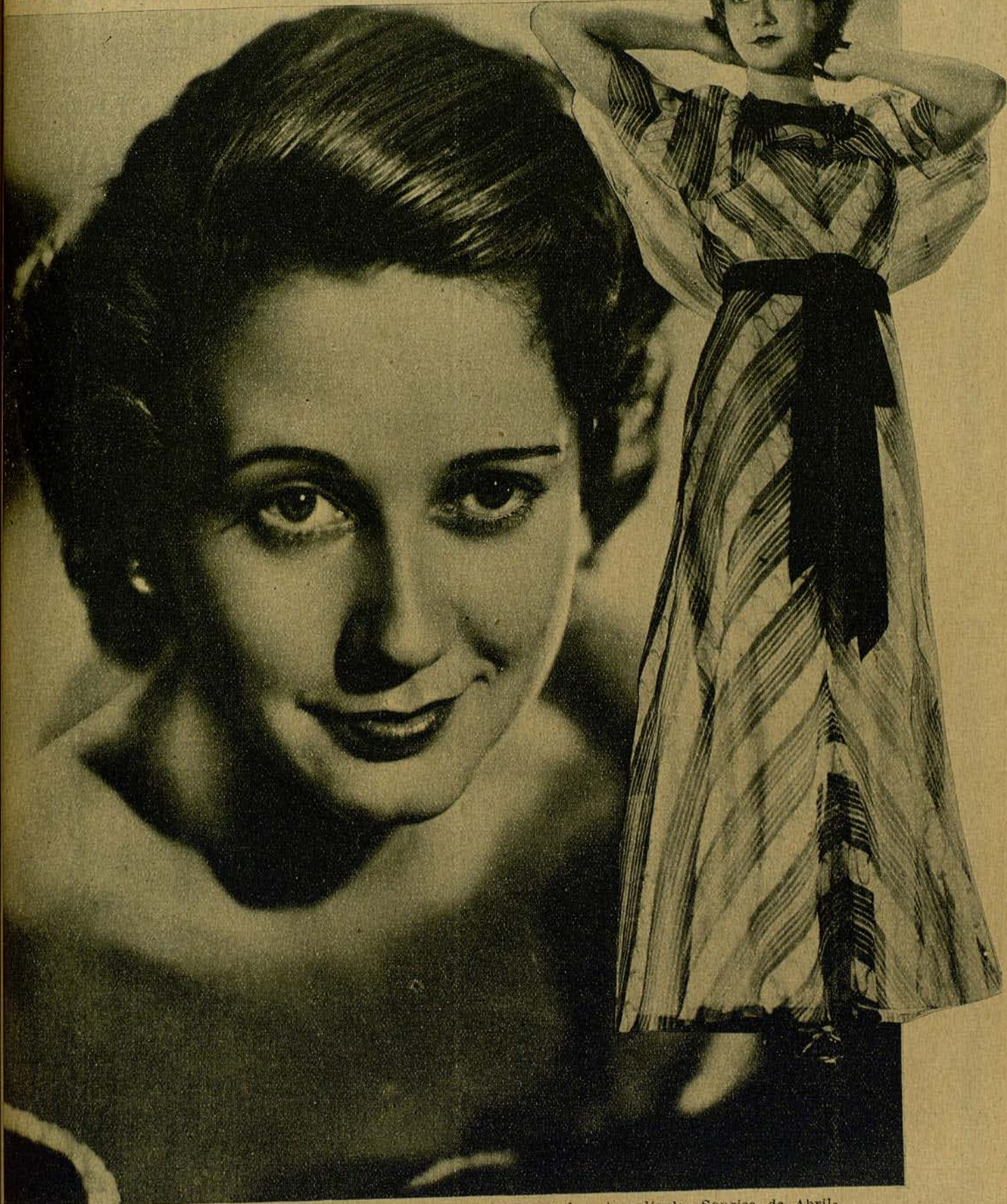
JANE BAXTER, actriz que interpreta un importante papel en la película «Sonrisa de Abril», y una de las mujeres más hermosas del cinema americano