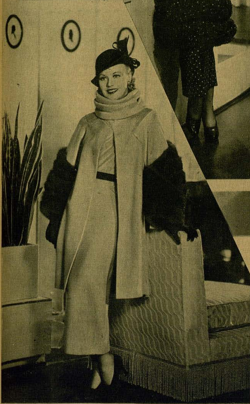
TRES CREACIONES ATREVIDISIMAS, EXHIBIDAS POR LA DELICIOSA GINGER ROGERS, INTERPRETE DEL FILM «ROBERTA»