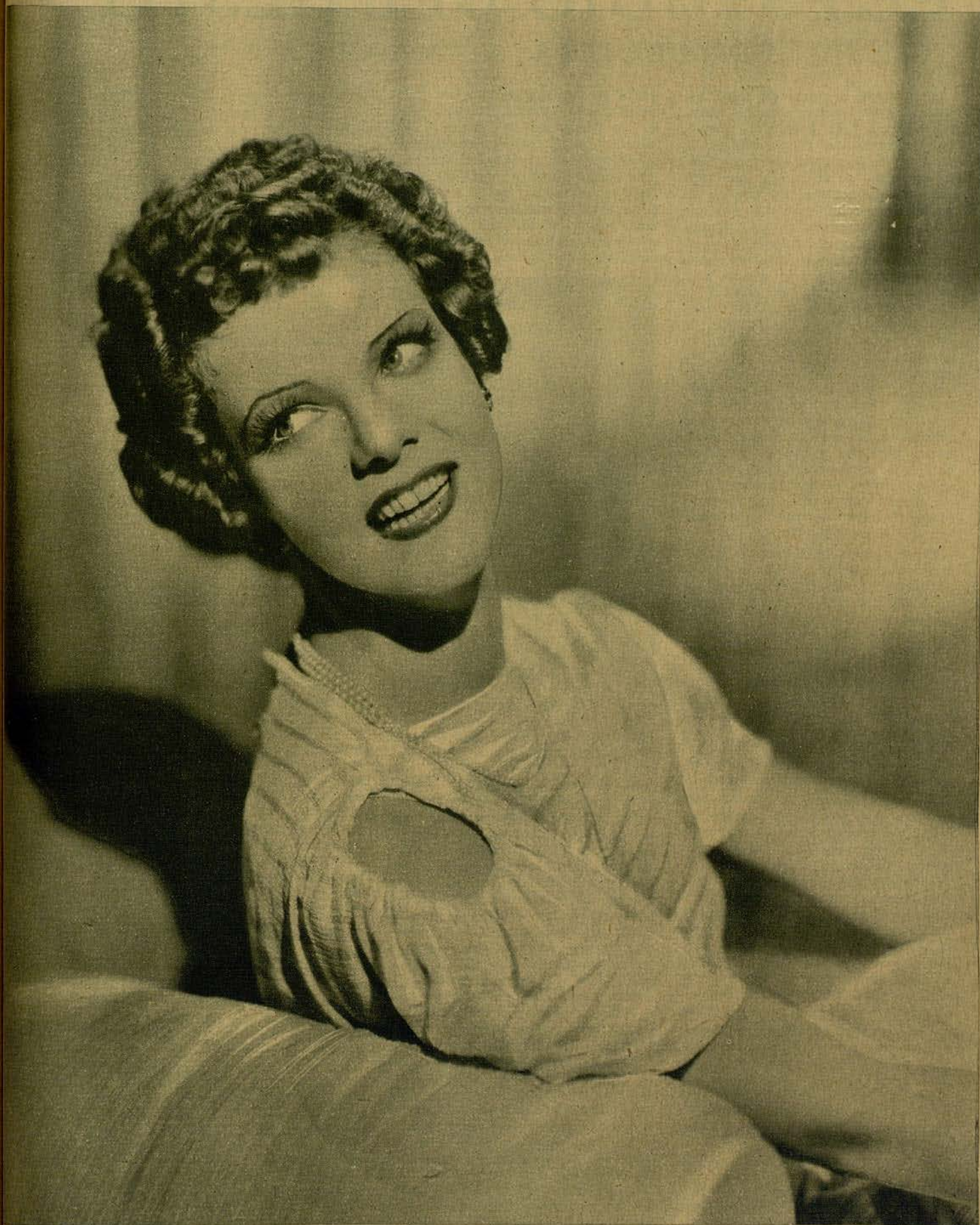
UNA DE LAS FOTOS MAS RECIENTES DE ELISSA LANDI, LA INOLVIDABLE MERCELA DE «EL SIGNO DE LA CRUZ»