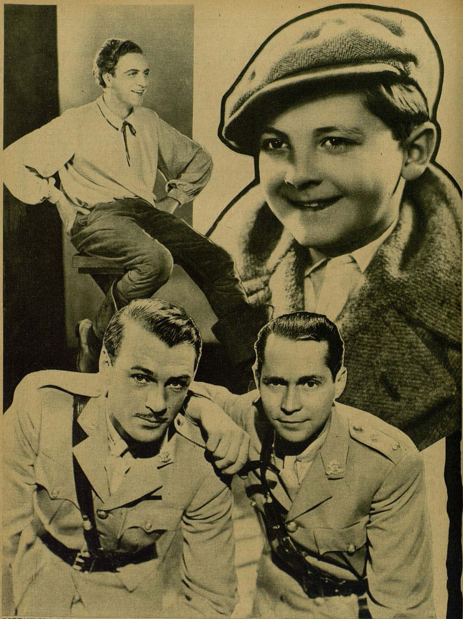
CODEANDOSE CON LOS ASTROS INTERNACIONALES, JULITO GARRIGÓS, PROTAGONISTA INFANTIL DE «20.000 DUROS», SONRIE MUY SATISFECHO. — WILLY FRITZ, EN UNA ESCENA DE «TURANDOT», Y GARY COOPER, CON FRANCHOT TONE, EN UN MOMENTO DEL FILM «LA VIDA DE UN LANCERO BENGALI»