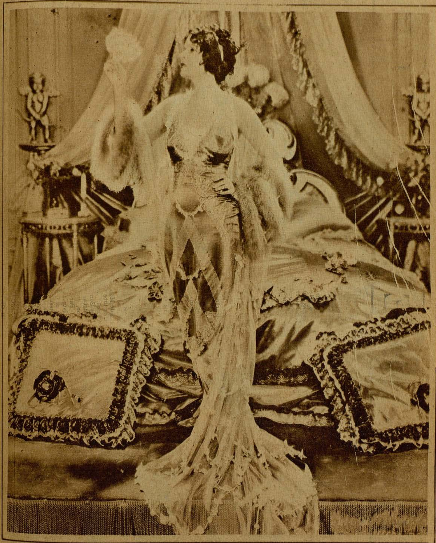
La gentil Norma Talmadge, protagonista de la película de gran espectáculo «Dubarry»