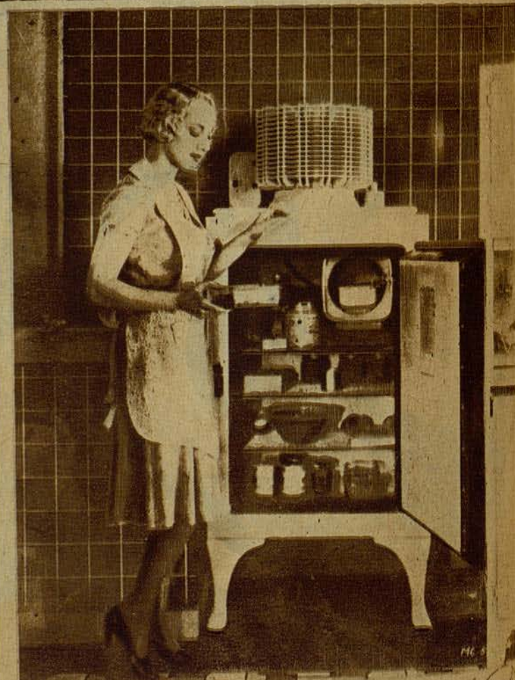
Lella Hyams, la bellísima actriz de la Metro-Goldwyn-Mayer, tiene una verdadera pasión por su nevera eléctrica General Electric Refrigerator, Coma, Llorens y Bufill, Ltda., Diputación, 234, Barcelona