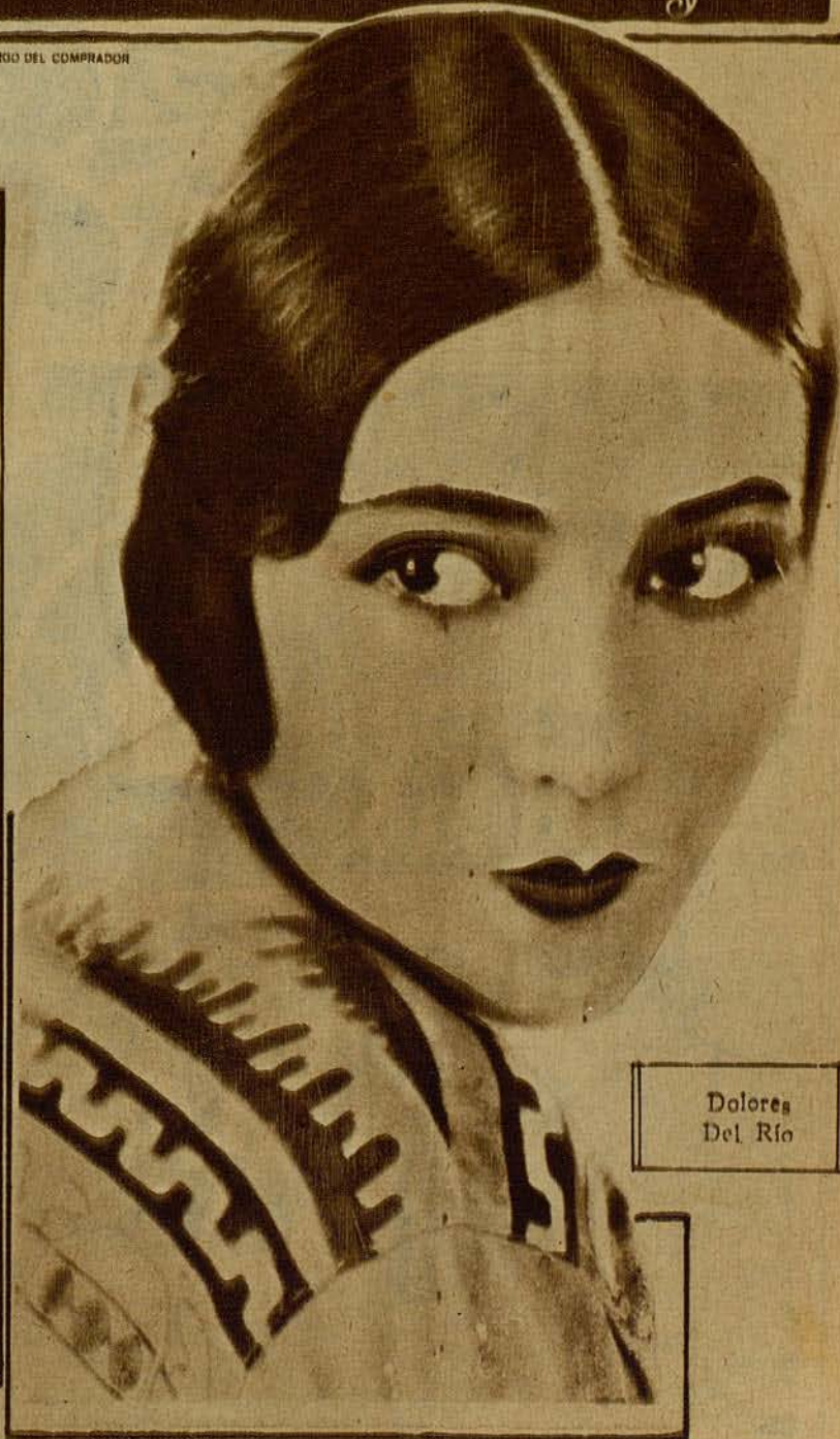
Dolores Del Río