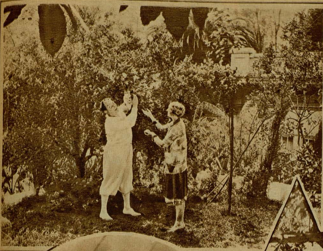
EMIL JAN- NINGS, SIEM- PRE EN LA PANTALLA, CON UNA DRA- MATICA GRA- VEDAD, APA- RECE EN ESTA FOTOGRAFIA AL LADO DE SU MUJER, ARRANGANDO NARANJAS EN SU JARDIN, COMO EN UNA ESCENA ME- DIO DE MADRI- GAL MEDIO DE GEORGICA

damente para al- ble que sus ojos era tar- le lleno una ar- comple- "Hells a toda- la ver- da, co- role de d sueta. cine so- pelcula tado di- e nuevo exclusi- es Greta s cortas con un o perm- como te- artistas low fué el direc- ra? En No sabe- n amba- aria Jean estrella e impor- No será mericanis recio ha- nuestra cabeza al Vega-