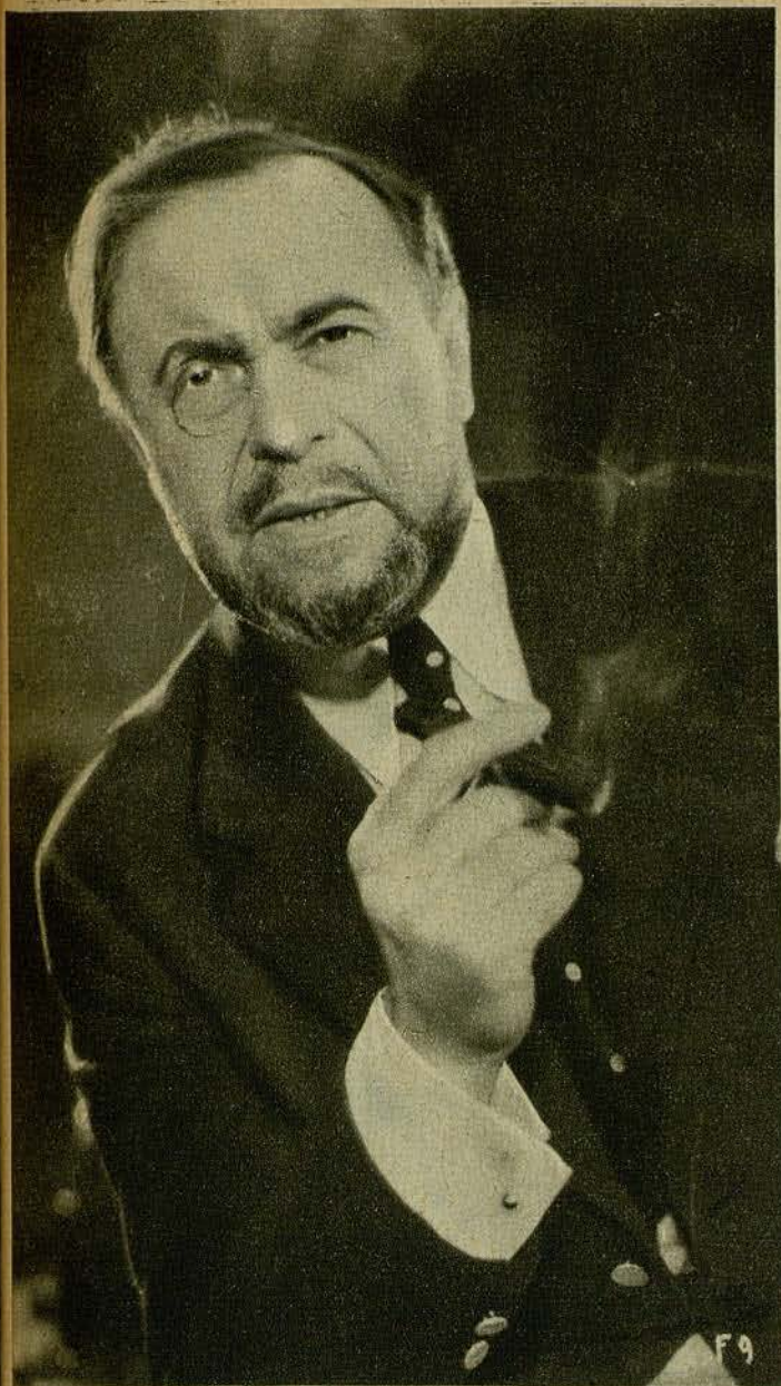
ROGER KARL el gran actor de la UFA, en una de sus más perfectas y admirables caracterizaciones.