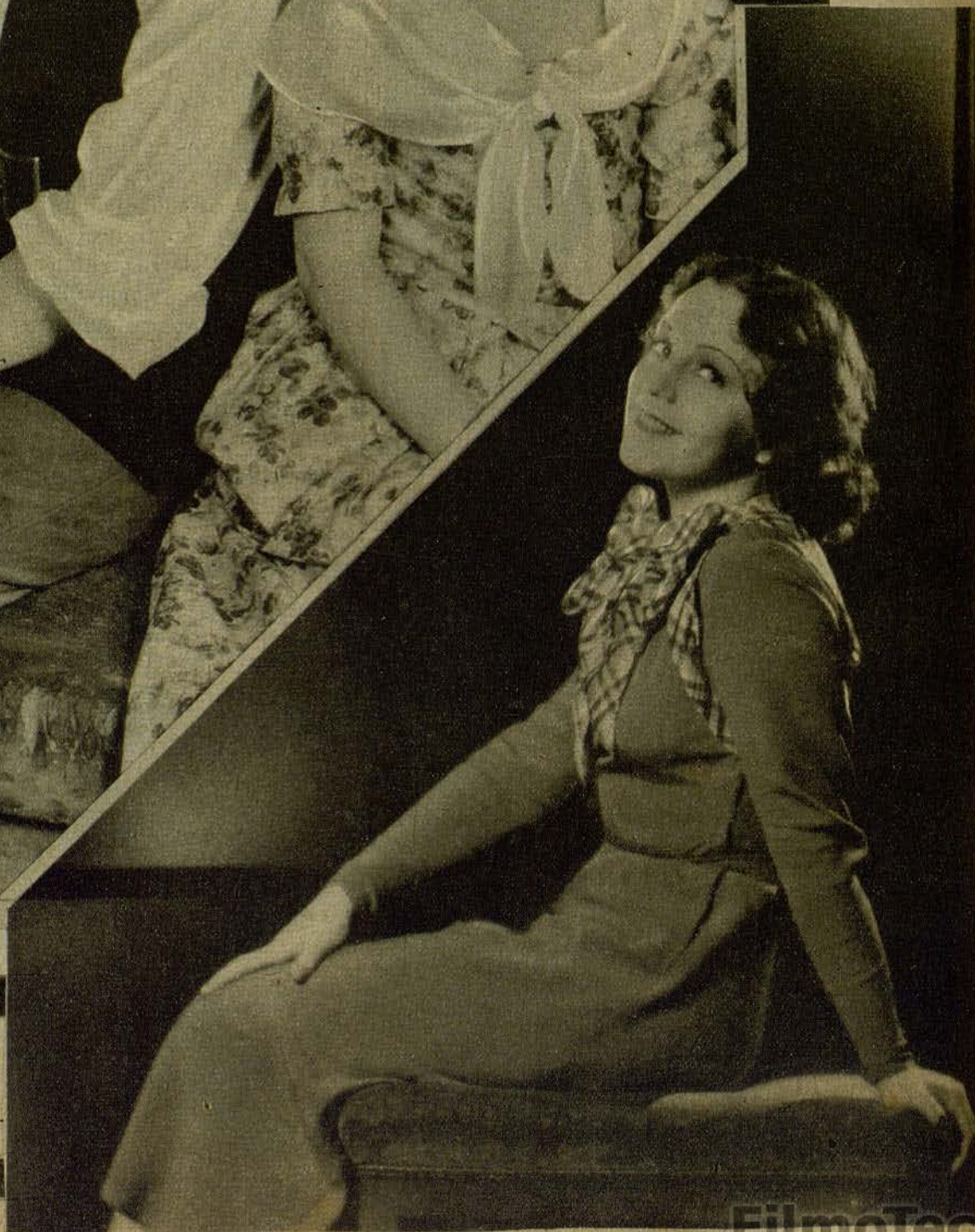
JAQUELINE DAIX térprete felicísima del film «Un jour viendra...» famosa artista de la UFA, in-