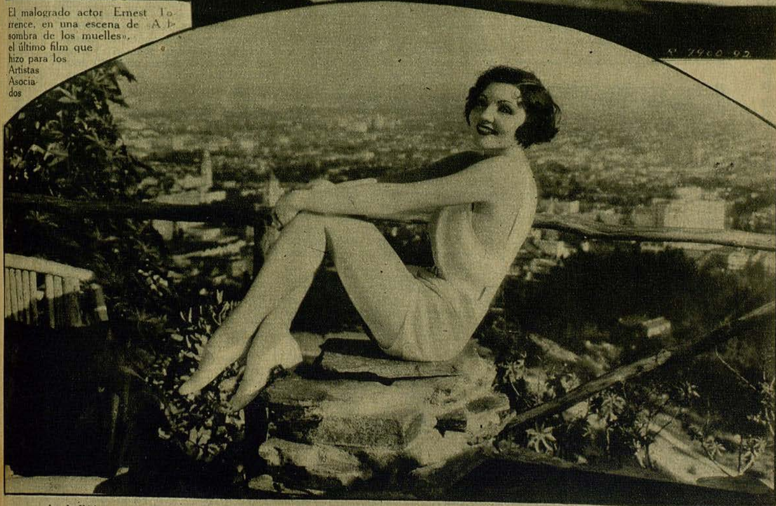
La bellísima y gran actriz Claudette Colbert, disfrutando unos momentos de descanso durante la filmación de una cinta