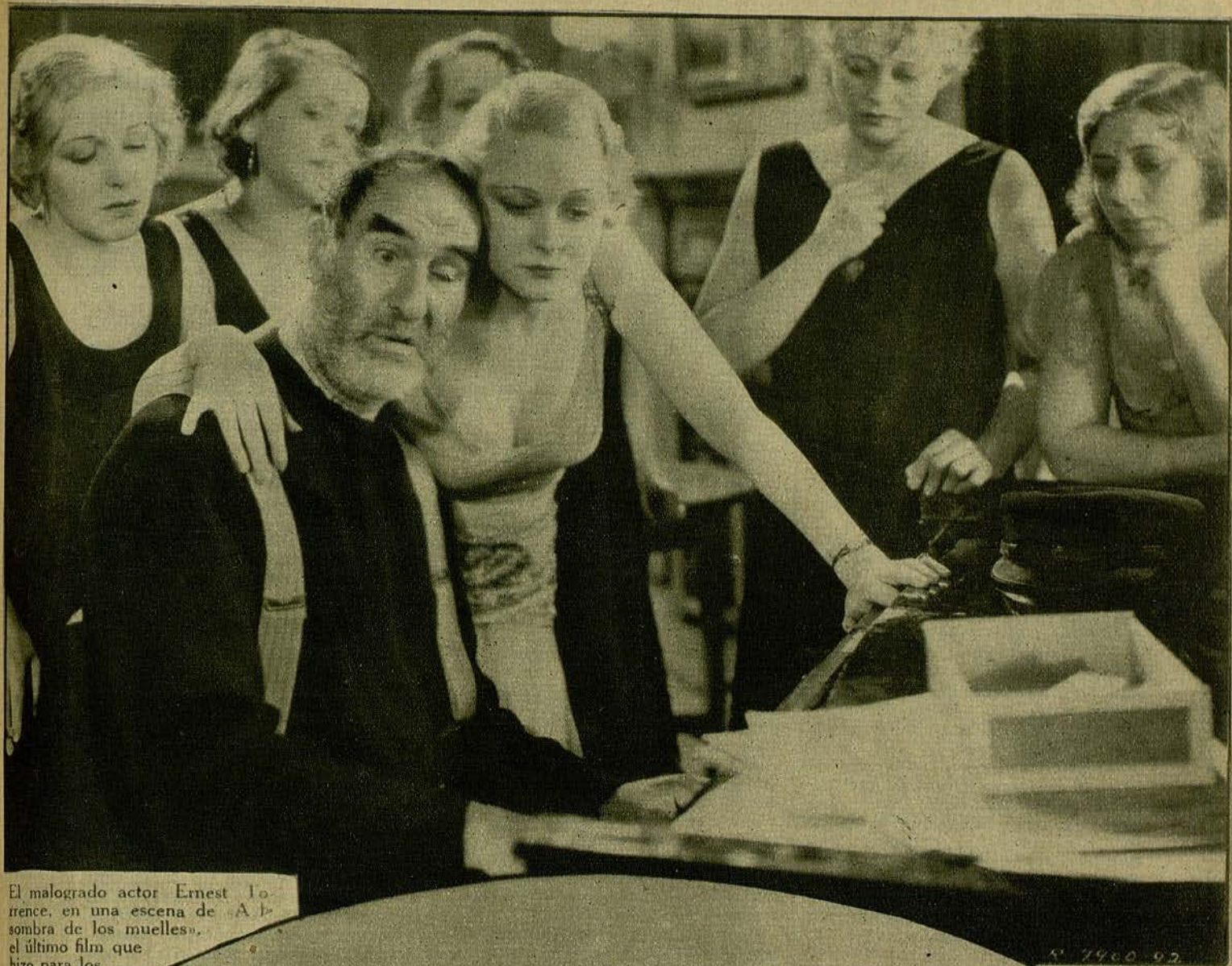
El malogrado actor Ernest Lorence, en una escena de «A la sombra de los muelles», el último film que hizo para los Artistas Asociados