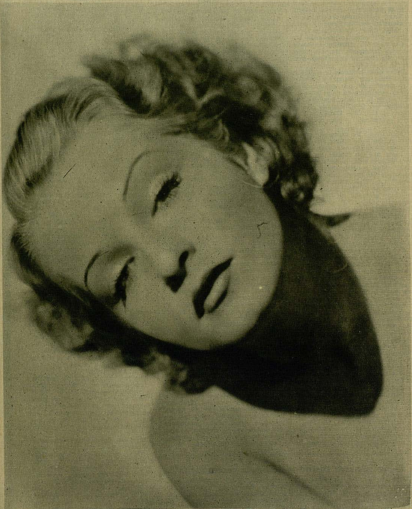
SARI MARITZA Popular y sugestiva actriz de la Paramount