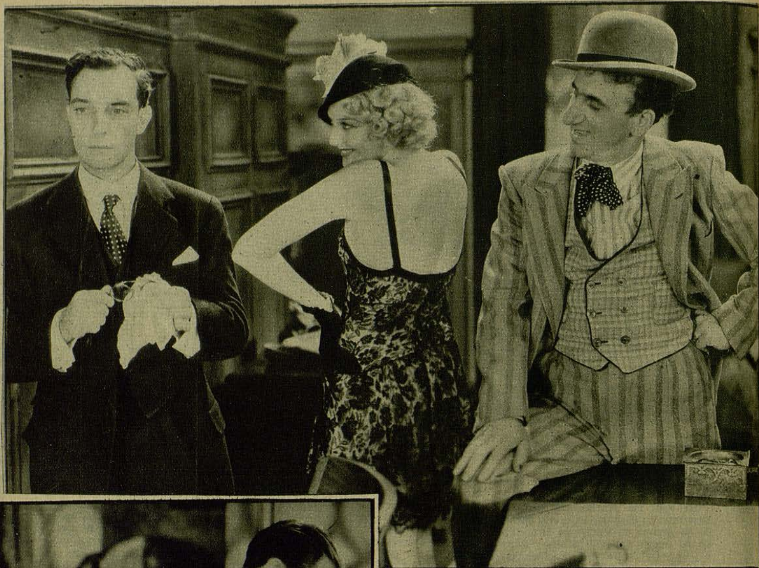
Buster Keaton (Pamplinas), Telma Todd y Jimmy Durante, en una escena de la regocijante comedia de la M. G. M., «Piernas de perfil», estrenada el lunes en el Urquinaona, con gran éxito