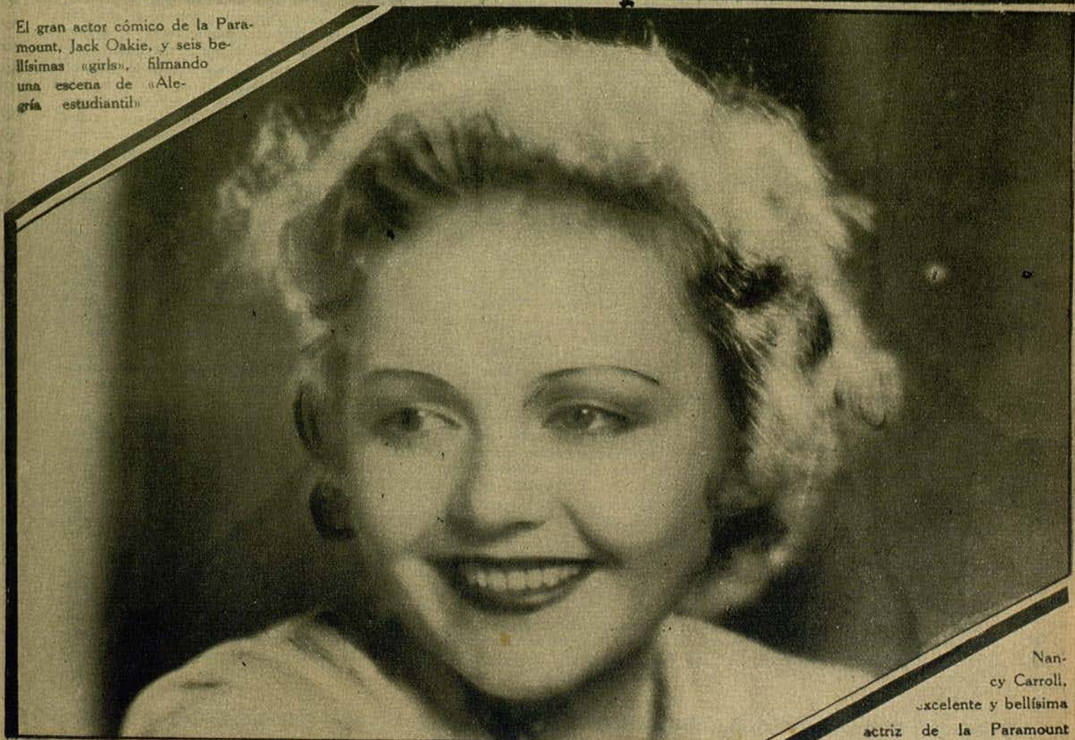
Nancy Carroll, excelente y bellísima actriz de la Paramount