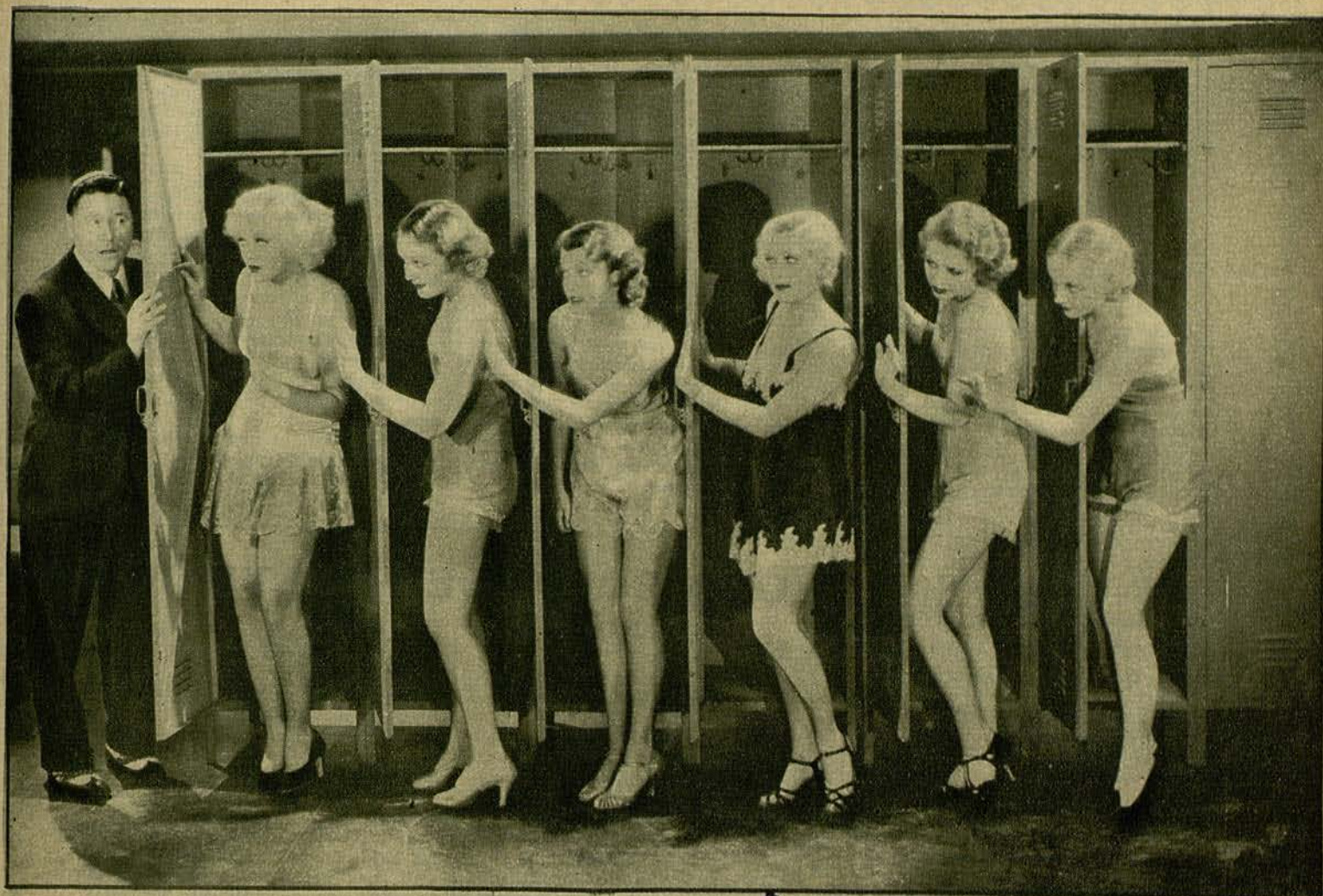
El gran actor cómico de la Paramount, Jack Oakie, y seis bellísimas «girls», filmando una escena de «Alegría estudiantil».