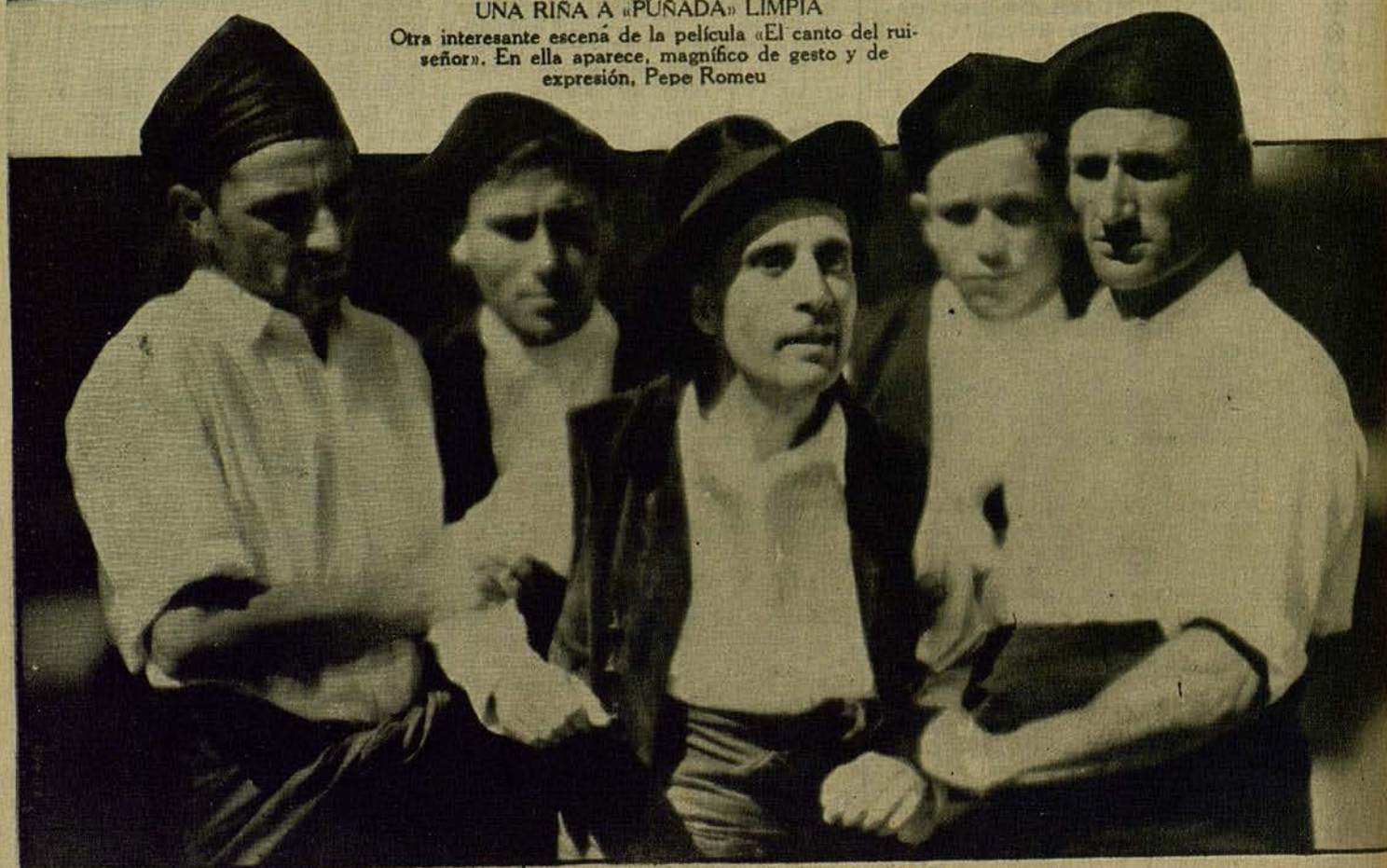
EL GRAN ACTOR ANTONIO PALACIOS, destacada figura del nuevo film «El canto del ruiseñor». Vedle aquí, rodeado de los mozos de El Roncal, interpretando una escena de la citada película