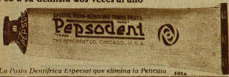
La Pasta Dentífrica Especial que elimina la Película 5012

Use Pepsodent dos veces al día — Vea a su dentista dos veces al año