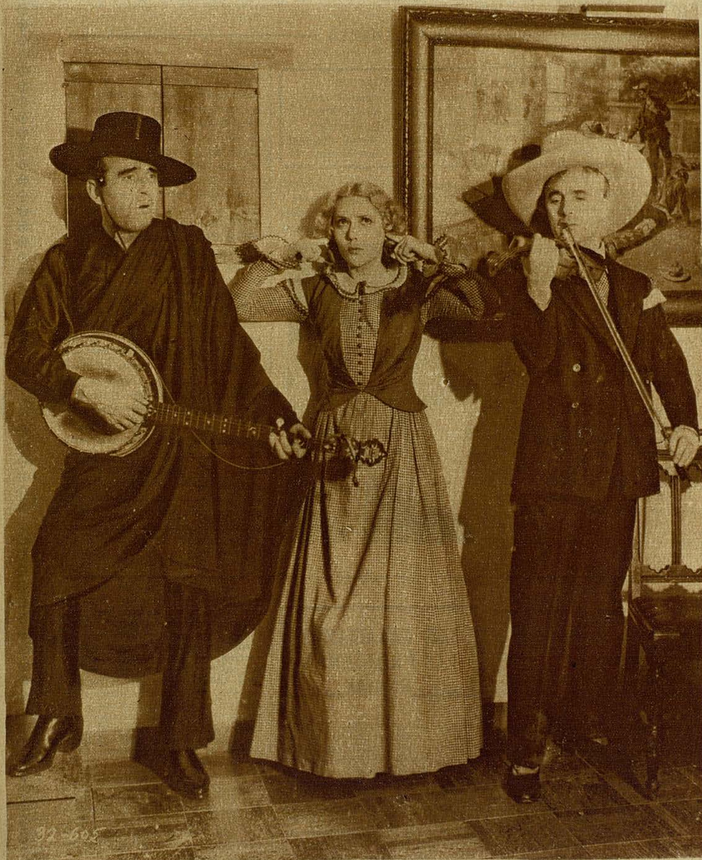
En una fiesta íntima dada por Mary Pickford, Douglas se disfrazó con el traje que usó en «El signo del Zorro»; su esposa con uno de los que usa en «Secretos», y Charlie Chaplin, para no ser menos, se disfrazó con el traje que ustedes ven. A pesar de la crisis, en Hollywood conservan, todavía el buen humor.