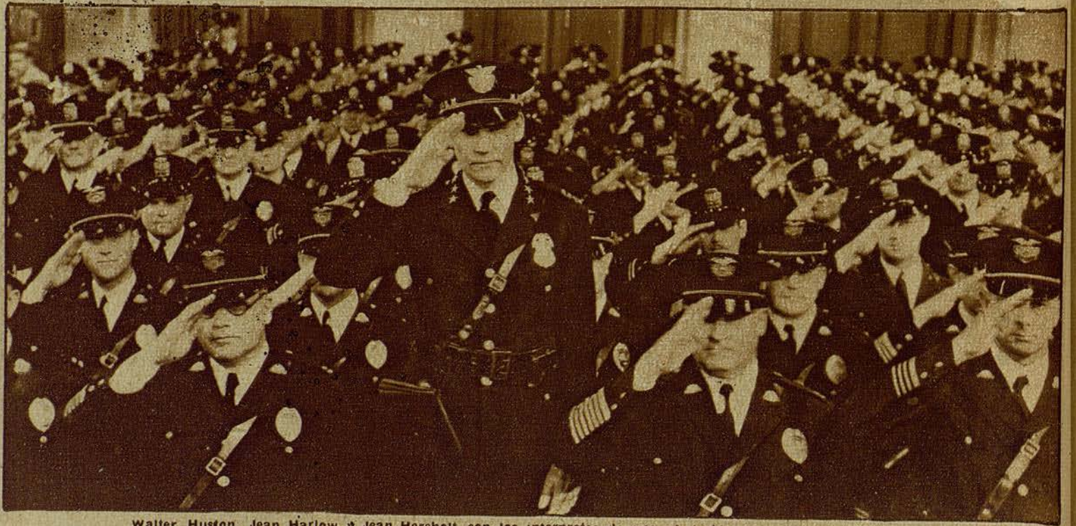
Walter Huston, Jean Harlow y Jean Hersholt, son los interpretes de este admirable film de Metro Goldwyn Mayer, «El monstruo de la ciudad», que tiene la virtud de levantar el pecho de los ciudadanos honrados contra el monstruo repugnante del banditismo