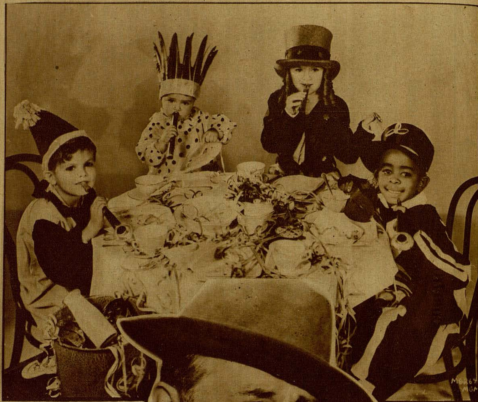
Cuatro importantes miembros de «La Pandilla», que han celebrado alegre- mente la llegada de Navidad