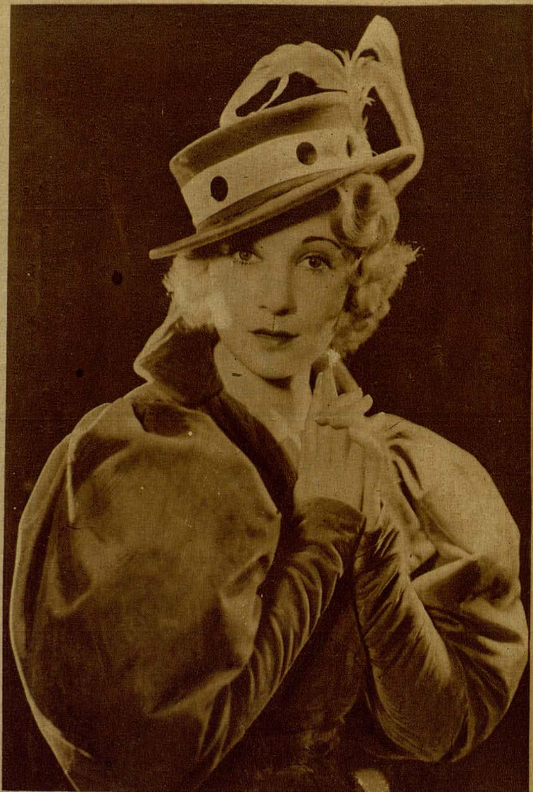
Una Merkel, encantadora actriz de la M. G. M., aparece aquí con un vestido que podríamos llamar «veterano», quizá recordando que ella lo fué del cine hablado. En efecto, miss Merkel fué la primera mujer que impresionó una película hablada.

Aun en esos tiempos—añadió—, teníamos nuestros problemas del sonido. Recuerdo cierta escena que requería la vibración del timbre del teléfono. Ensayamos toda suerte de campanillas, timbres y gongos; pero, o bien no se dejaban oír, o retumbaban como una ametralladora en la impresión. Finalmente alguien sugirió la campanilla de una bicicleta; nuestro electricista, director de escena y tramoyista, todo en uno, corrió a la esquina a buscar el indispensable artefacto, y al cabo, la impresión resultó perfecta.