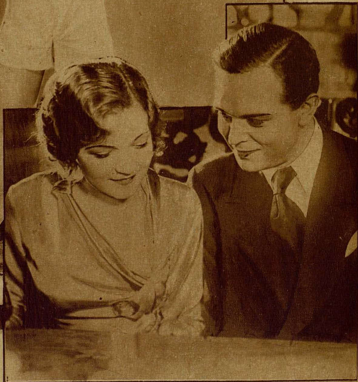
Gustav Frolich y Marta Eggerth, en una interesante escena de la bella película «Una canción, un beso, una mujer»,

Jackie Cooper, es un gran camarada de Wallace Beery, y aquí le vemos ejercitando sus fuerzas para poderse medir algún día con él