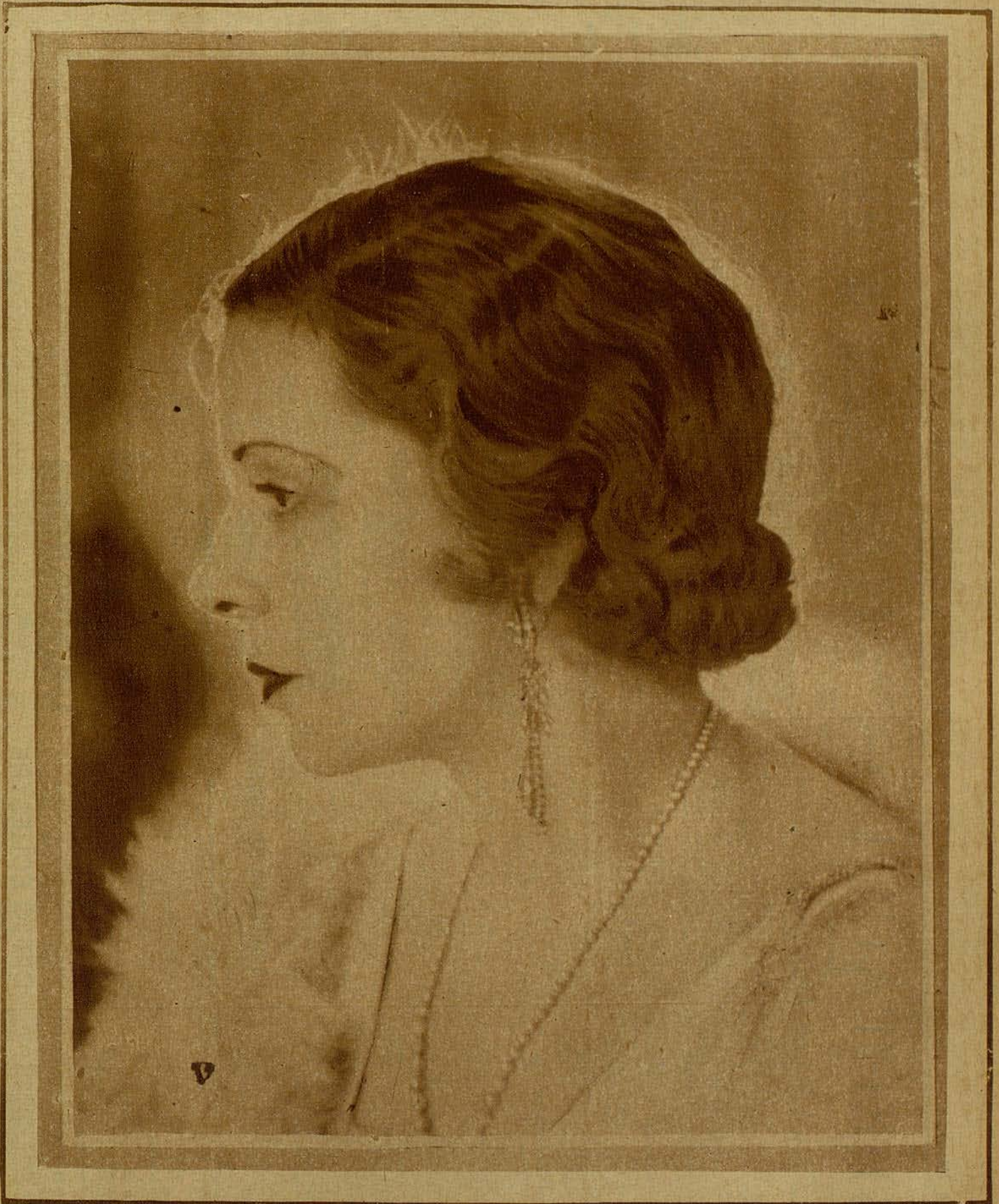
La eximia Catalina Bárcena, que al obtener éxito su primer film «Mamá», fué contratada de nuevo por la Fox, para filmar «Primavera en Otoño»