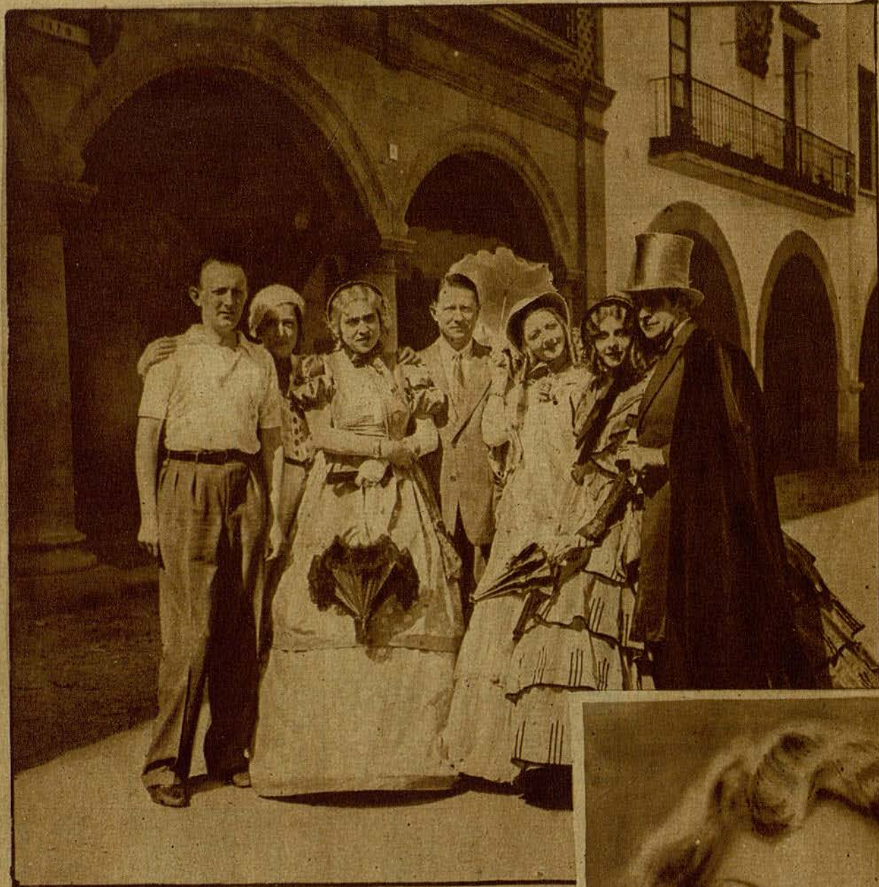
Algunos interpretes de la produccion sonora «Violetas Imperiales», rodeando al conocido cinematográfico señor Huet, concesionario de dicho film para España