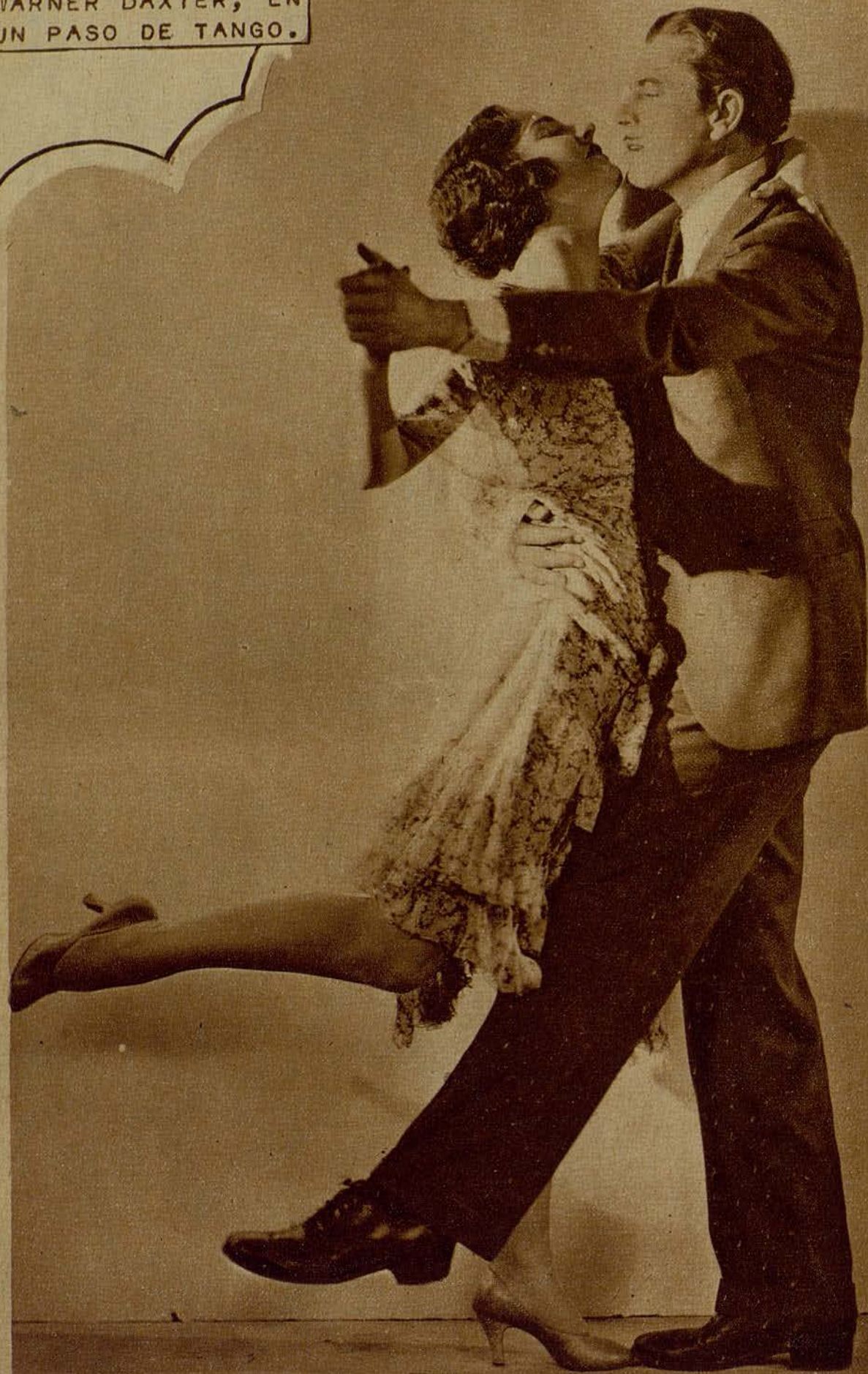
DOROTHY BURGESS Y WARNER BAXTER, EN UN PASO DE TANGO.