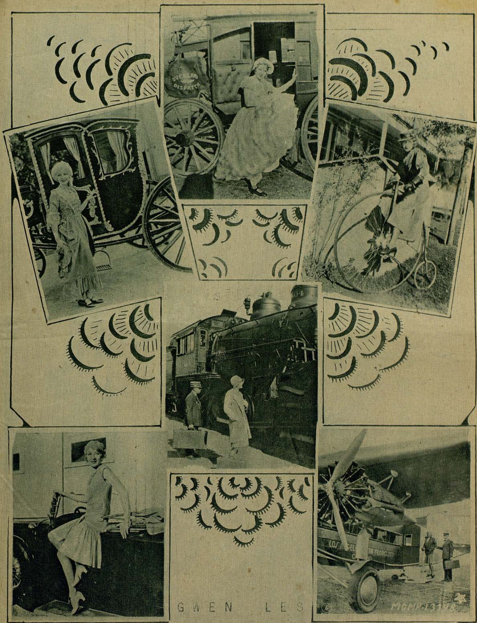
MOSTRÁNDONOS, PRACTICAMENTE, LA MANERA DE VIAJAR, A TRAVÉS DE LAS EDADES... MAS MODERNAS.