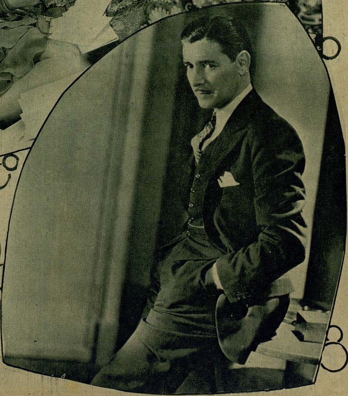
RONALD COLMAN, QUE EN LA PRÓXIMA TEMPORADA INTERPRETARÁ FILMS DE LOS ARTISTAS ASOCIADOS