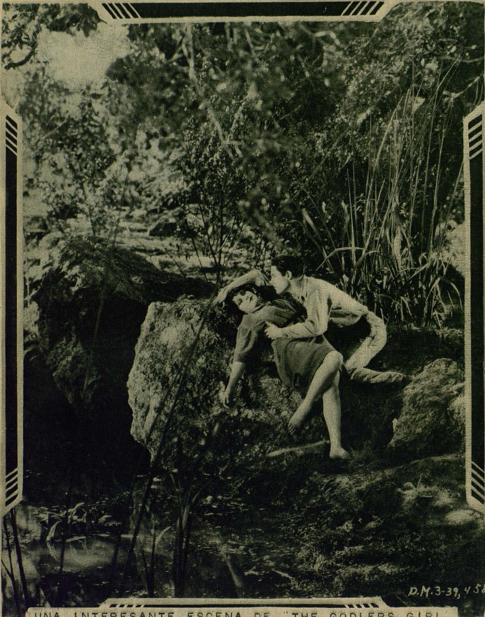
UNA INTERESANTE ESCENA DE "THE GODLERS GIRL" BAJO LA DIRECCIÓN DE CECIL B. DE MILLE CON EL CONCURSO DE LINA BASQUETTE