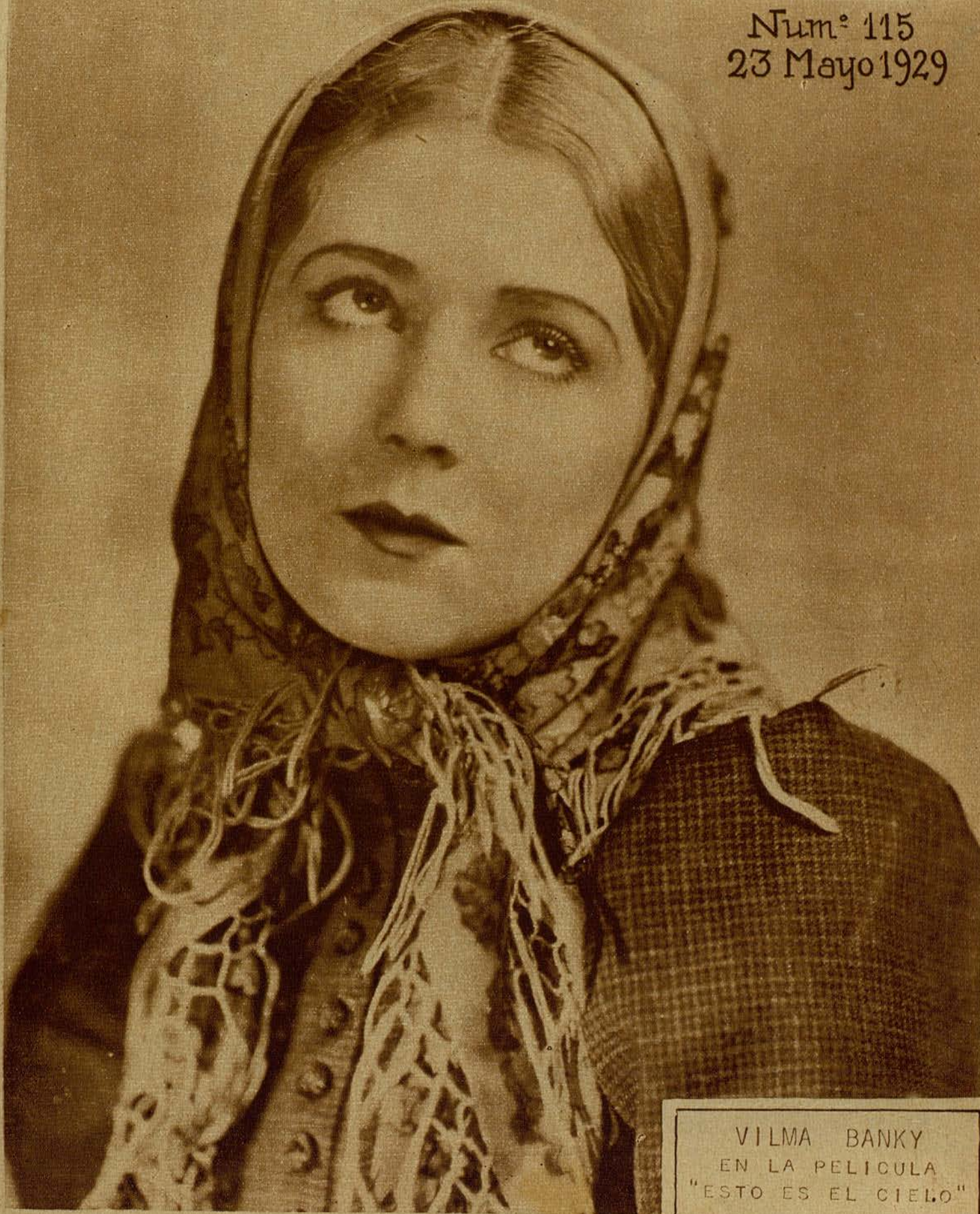
VILMA BANKY EN LA PELICULA "ESTO ES EL CIELO"