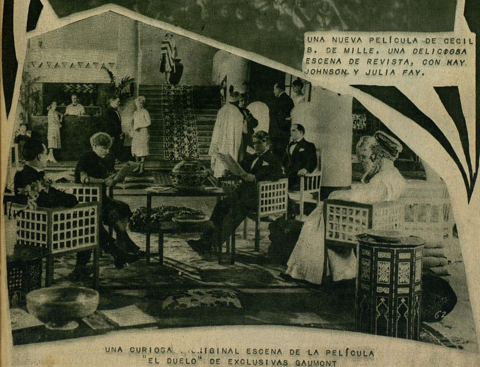
UNA CURIOSA Y ORIGINAL ESCENA DE LA PELÍCULA "EL DUELO" DE EXCLUSIVAS GAUMONT