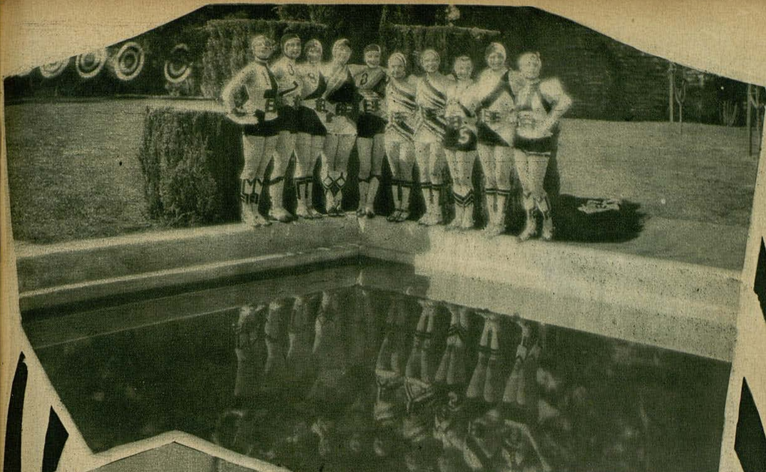
UNA NUEVA PELÍCULA DE CECIL B. DE MILLE. UNA DELICIOSA ESCENA DE REVISTA, CON KAY JOHNSON Y JULIA FAY.