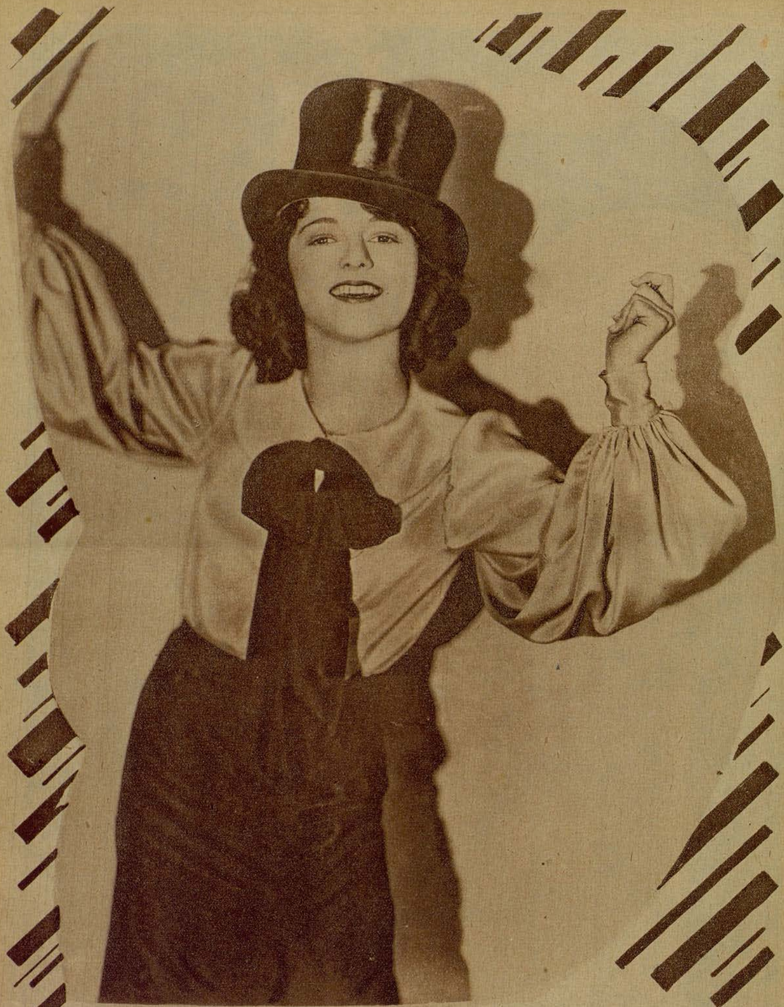
JANET GAYNOR, LA ARTISTA GRACIOSA Y FLEXIBLE, EN SUS ACTITUDES CARACTERISTICAS