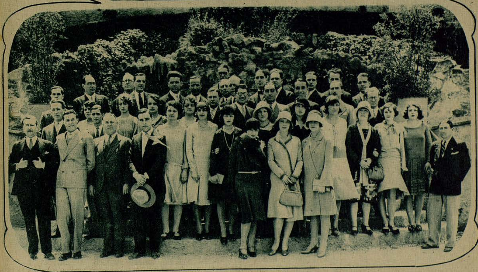
BANQUETE CON QUE EL PERSONAL DE LA CASA PARAMOUNT FILMS, OBSEQUIO A SU DIGNO DIRECTOR-GERENTE, MR. HESSERI.