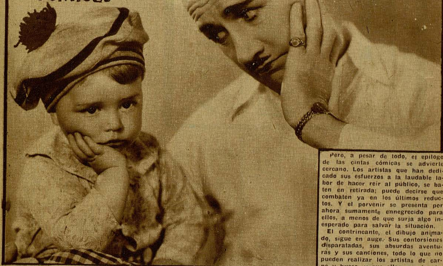
Charles Chase, intérprete de múltiples películas cómicas, en actitud pensativa, juntamente con el pequeño «Spanky», que pertenece a la famosa «Pandilla»

Pero, a pesar de todo, el epílogo de las cintas cómicas se advierte cercano. Los artistas que han dedicado sus esfuerzos a la laudable labor de hacer reír al público, se baten en retirada; puede decirse que combaten ya en los últimos reducidos. Y el porvenir se presenta por ahora sumamente ennegrecido para ellos, a menos de que surja algo inesperado para salvar la situación.