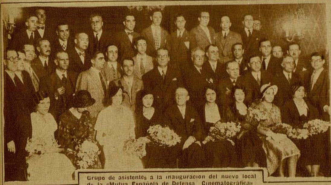
Grupo de asistentes a la inauguración del nuevo local de la «Mutua Española de Defensa Cinematográfica»

Los que podemos considerarnos como benjamines, advenedizos recién llegados al puñado de hombres heroicos que forman los redactores cinematográficos de Barcelona, nos sentimos emocionados. Emocionados porque comprendemos todo lo que para ellos ha de significar lo acontecido el sábado último con la implantación de un día dedicado al cine, ese arte nuevo—balbuciente ayer y esplendoroso hoy—hacia el que han rendido incansablemente todos sus esfuerzos y todos sus desvelos. Lo que parece un sueño, es realidad: el espectáculo de feria, de barraca, ha pasado al palacio y ha merecido la consagración de ese día, que bien puede considerarse como agradecimiento de público, críticos y empresarios al espectáculo varío que ha permitido a todos asomarnos al mundo y nos ha ofrecido fuentes inagotables de una cultura insospechada.