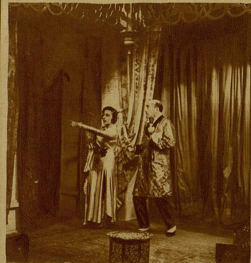
Blanche Uontel y Charles Deschamps, en una escena de uno de sus últimos films