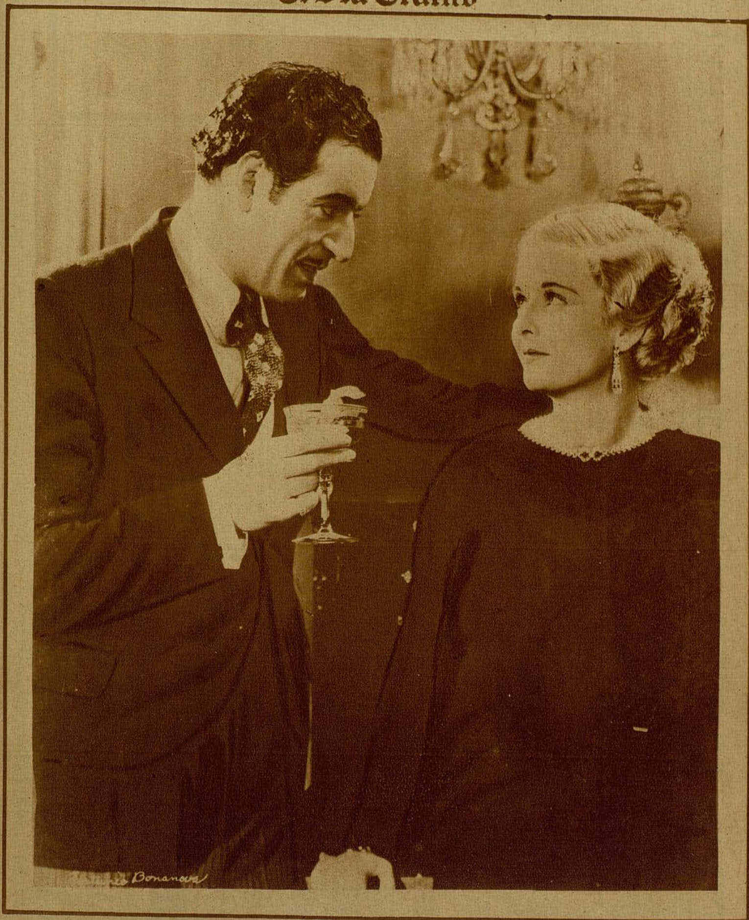
Joan Bennet y Fortunio Bonanova, en una escena de su última producción