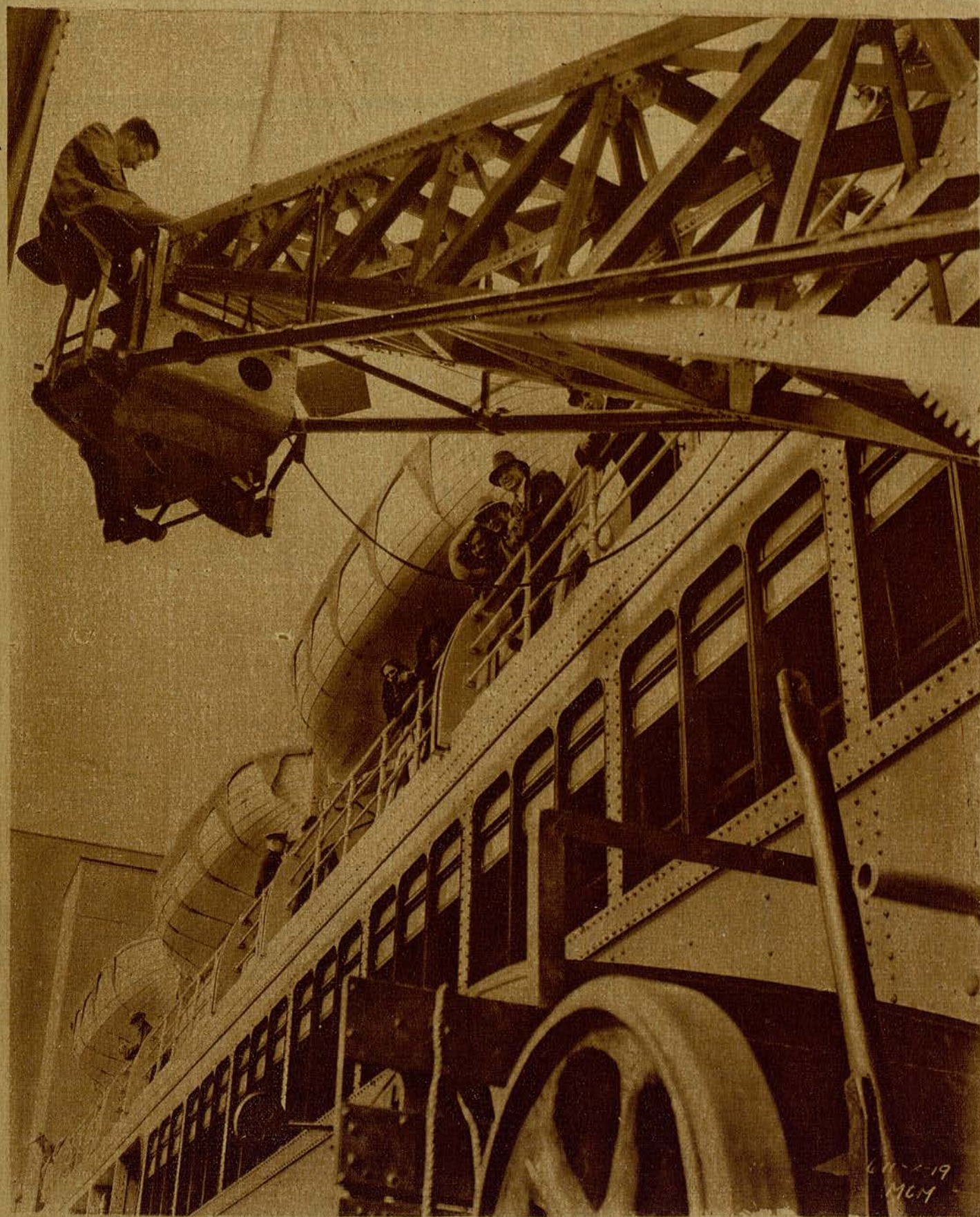
Joan Crawford y Robert Montgomery, con un grupo de actores y empleados de la M. G. M., filmando una escena