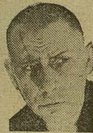
Erich von Stroheim