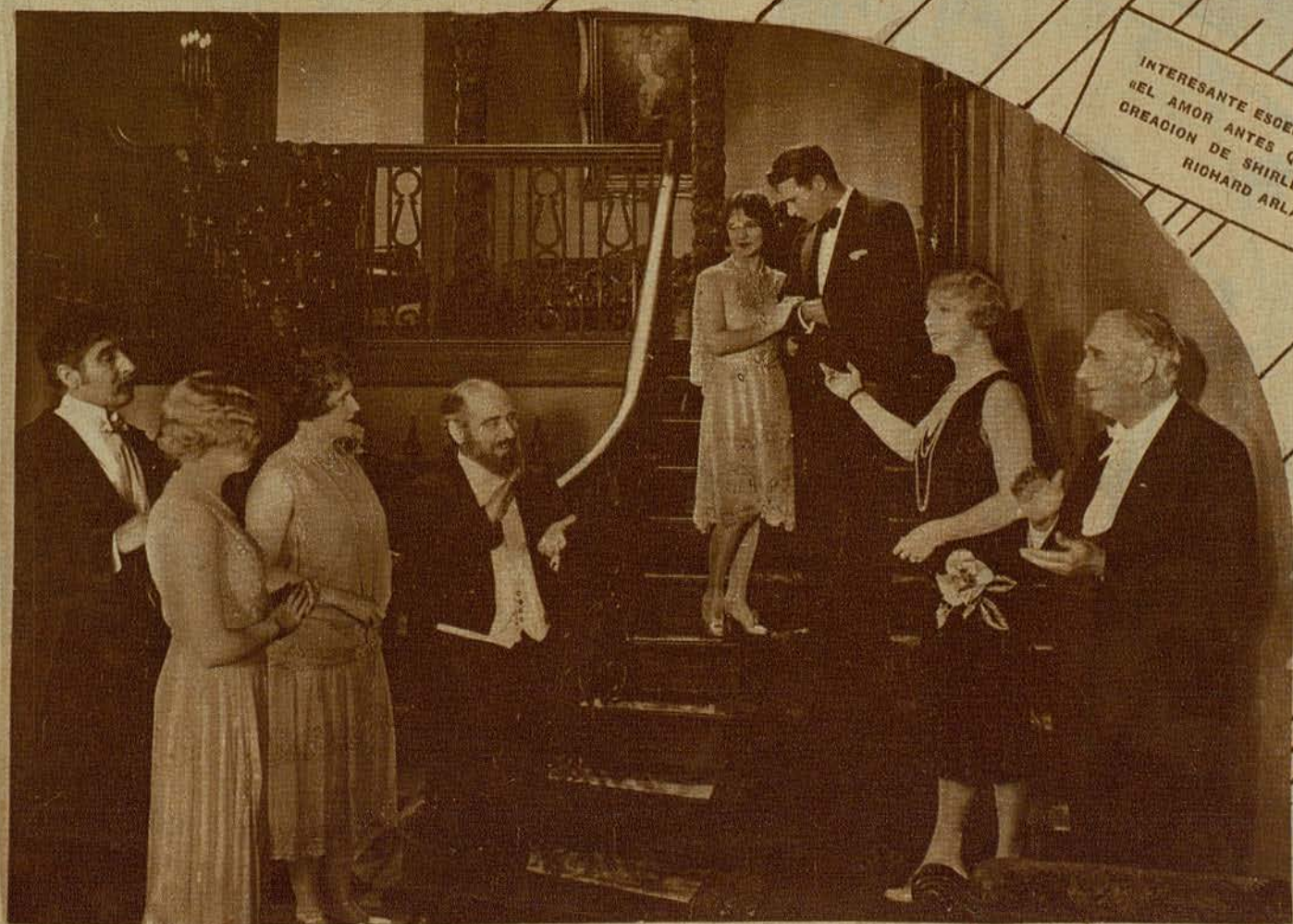
INTERESANTE ESCENA DE LA CINTA «EL AMOR ANTES QUE EL LUJO», CREACION DE SHIRLEY MASON Y RICHARD ARLAIN