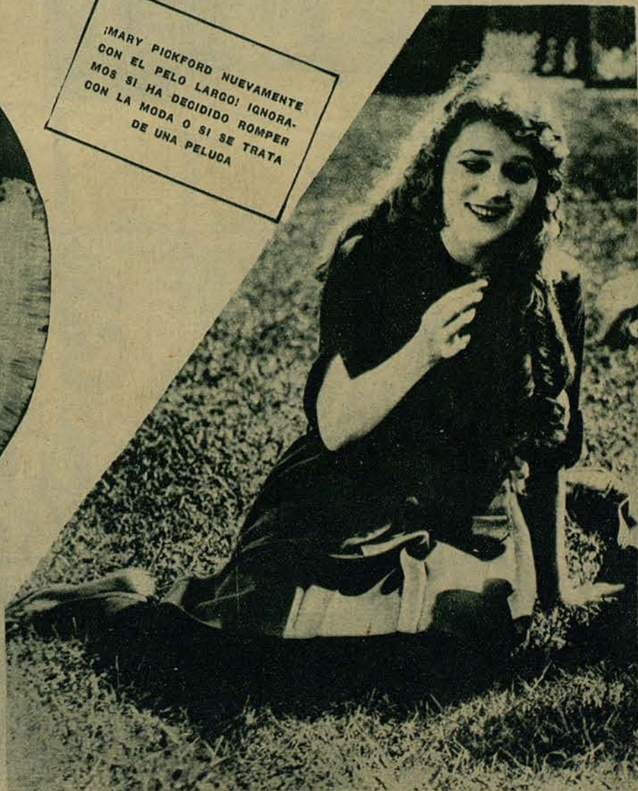
MARY PICKFORD NUEVAMENTE CON EL PELO LARGO! IGNORA- MOS SI HA DECIDIDO ROMPER CON LA MODA O SI SE TRATA DE UNA PELUCA