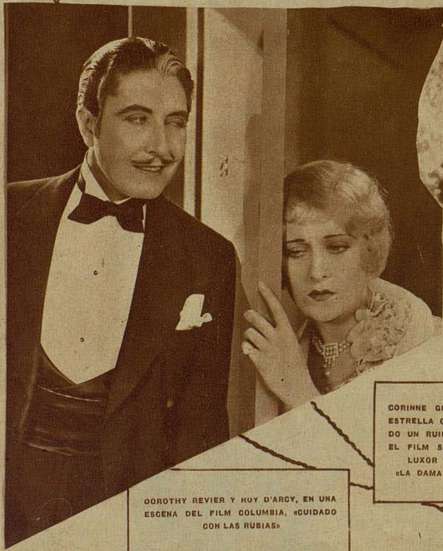
DOROTHY REVIER Y ROY D'ARCY, EN UNA ESCENA DEL FILM COLUMBIA, «CUIDADO CON LAS RUBIAS»