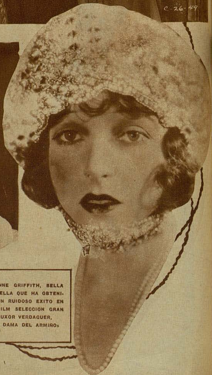
CORINNE GRIFFITH, BELLA ESTRELLA QUE HA OBTENIDO UN RUIDOSO EXITO EN EL FILM SELECCION GRAN LUXOR VERDAQUER, «LA DAMA DEL ARMINO»