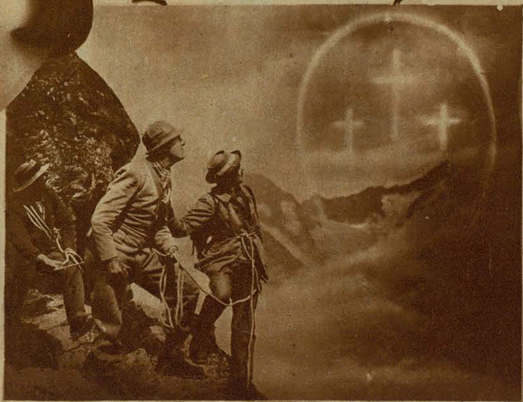
UNA ESCENA, PRODIGIO DE EJECUCION Y DE VERISMO, EN EL FILM ALEMAN, «DER KAMPF UMS MATTERHORN»