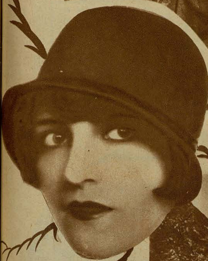
BERTHA VON WALTER, FAMOSA ARTISTA CINEMATOGRAFICA, ALEMANA, CUYA ANUNCIADA BODA CON UN PRINCIPE HA CAUSADO GRAN SENSACION