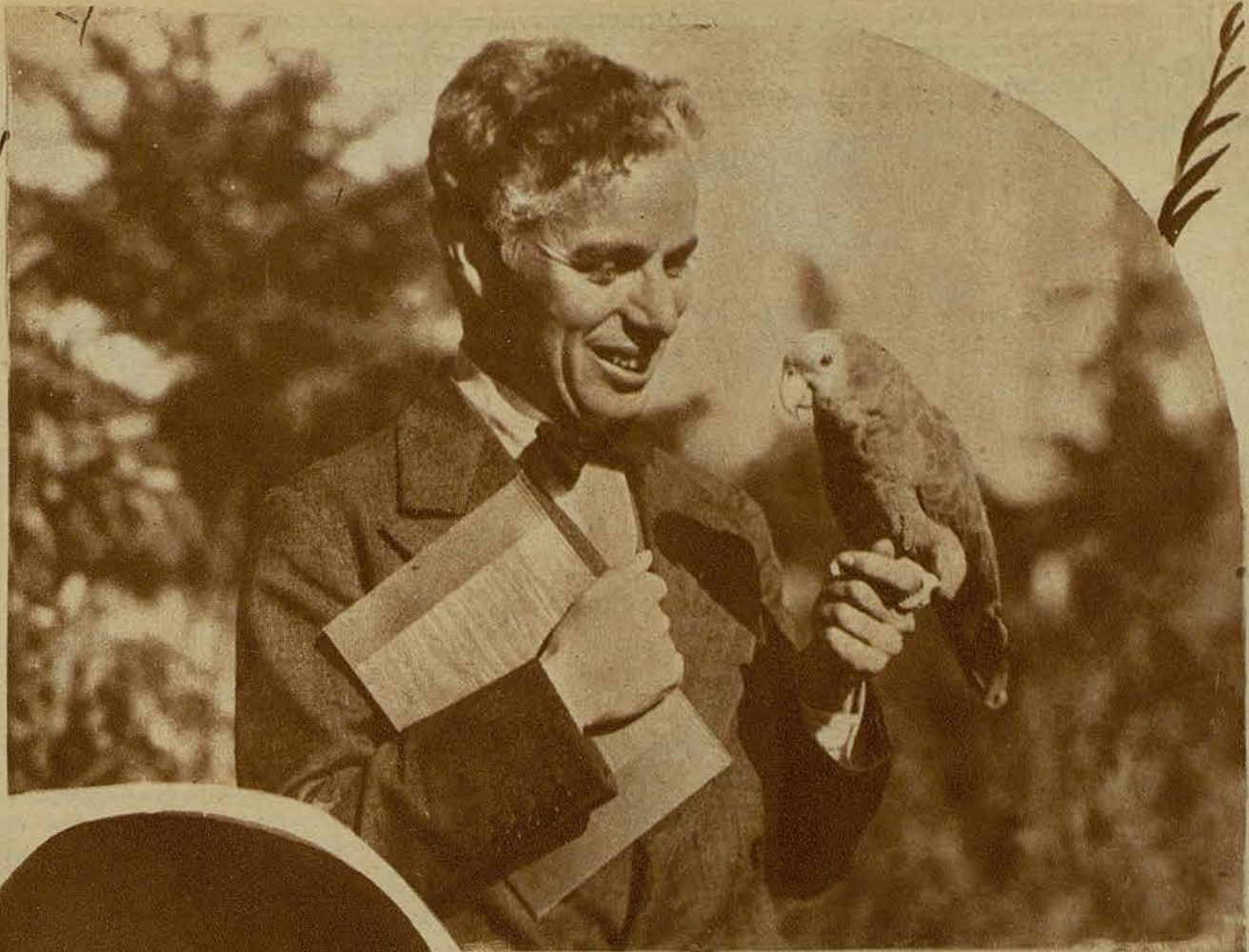
EL MAS RECIENTE RETRATO DE CHARLIE CHAPLIN, SORPRENDIDO EN PLAN DE CONFERENCIAR CON SU GOTORRA