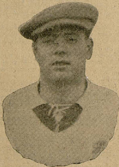
El guardameta internacional, Ricardo Zamora, confusinado en un accidente de automóvil

Los campeones del año pasado tienen un once fortísimo de gran valía, dominan la técnica del balón y poseen un juego brillantísimo, pero a los ases azul-grana les falta ya aquel entusiasmo y aquella fe ciega en la victoria