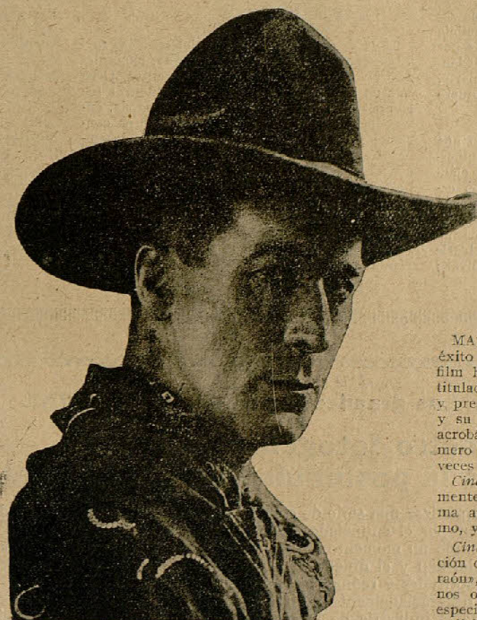
WILLIAM S. HART

SAN CELONI. — Ha constituido un acontecimiento la reaparición en el Mundial-Cine de la joven y popular cancionista Raquelita, quien por su bella voz, espléndida juventud, elegante presentación y fino arte, cautiva a cuantos públicos es presentada. Le auguramos un ríspido porvenir en su ya brillante carrera artística. — A. B. MIGUEL.