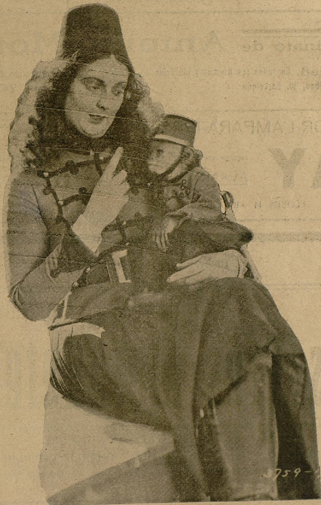
PRISCILLA DEAN La notable estrella de la Universal en la super-joya "Bajo dos Banderas" cuyo estreno se efectuará la semana próxima en el Palace-Cine.