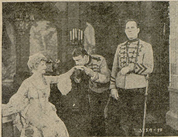
Una escena de la película «Bajo dos banderas»

Una vez sola surge de nuevo «El Sabueso» dispuesto a apoderarse de grado