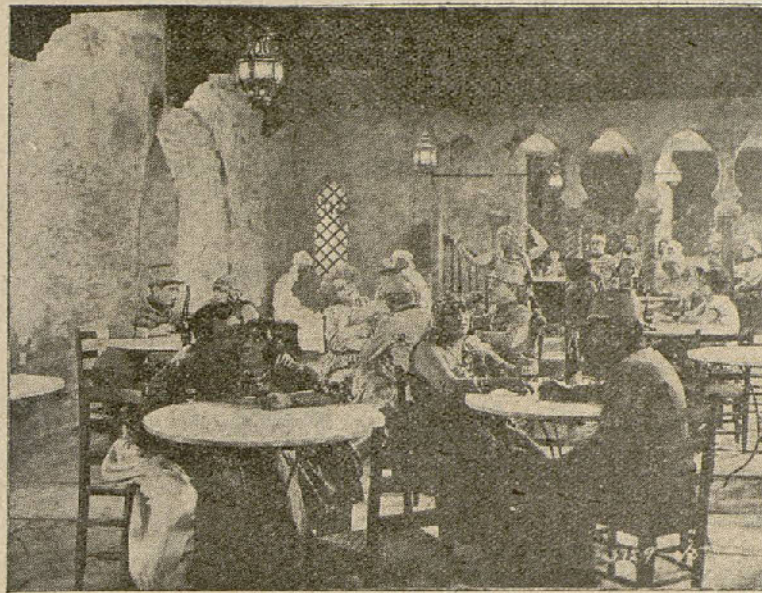
Una escena de la película «Bajo dos banderas»

go en fuente provechosa de todos órdenes, y comparte con su amiga italiana Dupre, aquella dulce soledad. En tales condiciones, recibe la visita de Carlos Bates, el empleado del juez Grandall, quien va a