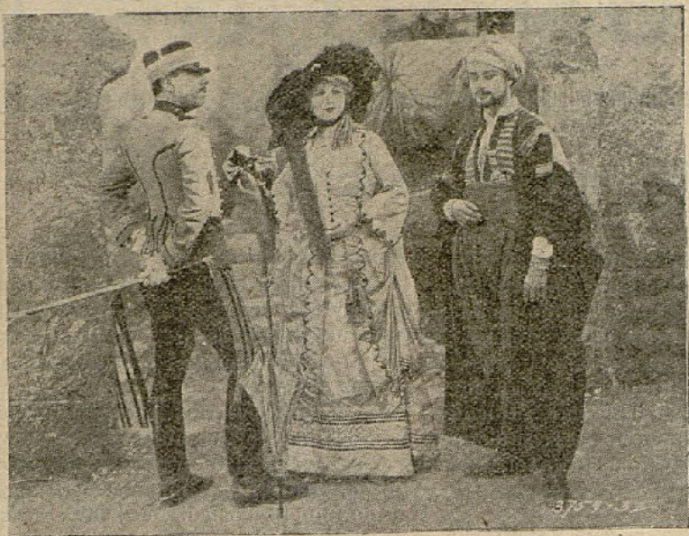
Una interesante escena de «Bajo dos Banderas».

CARL LAEMMLE presenta a PRISCILLA DEAN, en la «JOYA DE LA UNIVERSAL»