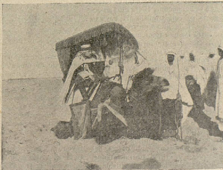
Una de las bellas escenas de «Bajo dos Banderas».