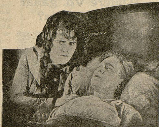
Una escena de la película «Las aventuras de Ruth»

Ruth es hacer extraer del río el oro de D. Justino y devolvérselo a su dueño. Cuando está realizado este nuevo acto meritorio, al abrir una caja de bombones halla una nota en la que se le advierte que