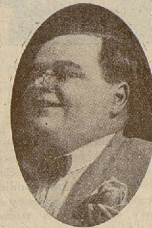
ROScoe ARBUCKLE (FATTY)

Charlie tomará posesión de su nueva estancia dentro de algunos meses, aproximadamente en la época en que habrá terminado su primer film para «United Artists».