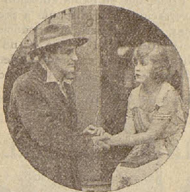
Una escena de la película «El triunfo de la vía férrea» de los Artistas Asociados

Huguette registra todos los bolsillos de Jaime para ver si encontraba la causa de su tardanza, encontrando la carta dirigida a Jaime por su primera mujer, y aunque ello la llenó de pena,