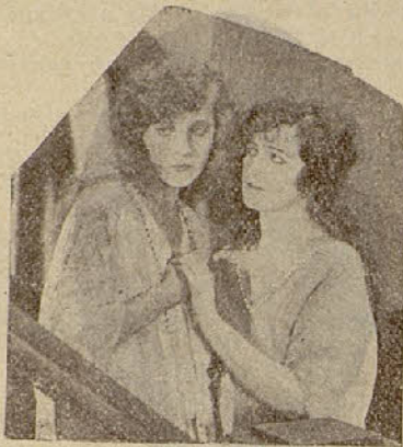
Una escena de la película «El triunfo de la vía férrea» de los Artistas asociados

Eliseo Boul. — Está en poder del crítico musical que es el que debe dicta-